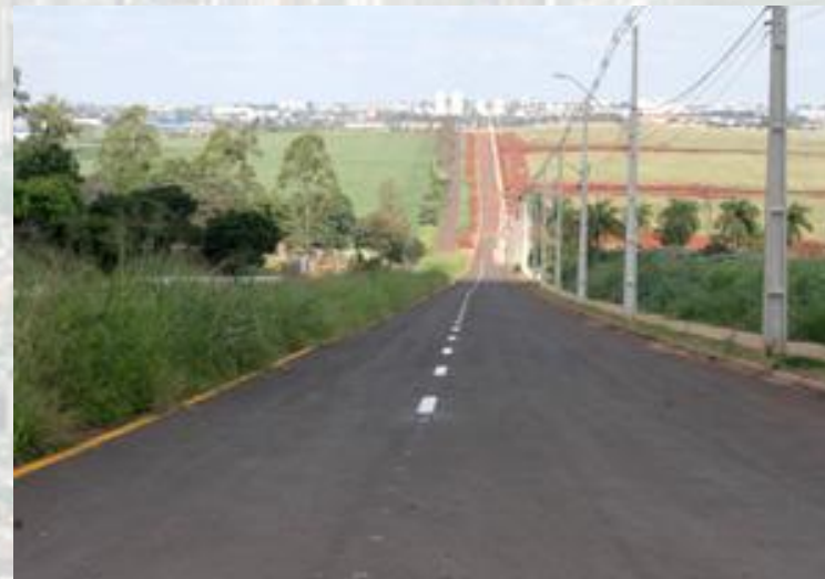
Duplicação da Avenida Angelina Ricci Vezozzo