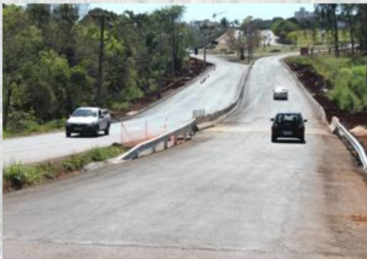
Melhorias na Av. Mábio Gonçalves Palhano