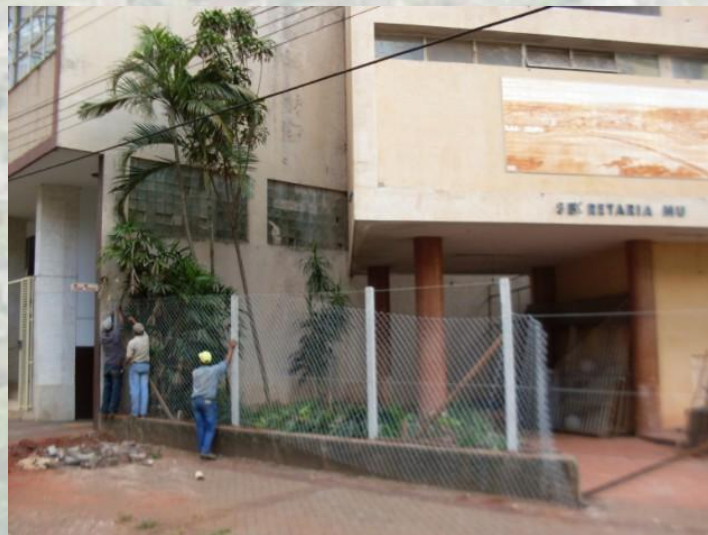
Restauração do Prédio da Sede da Secretaria Municipal de Cultura