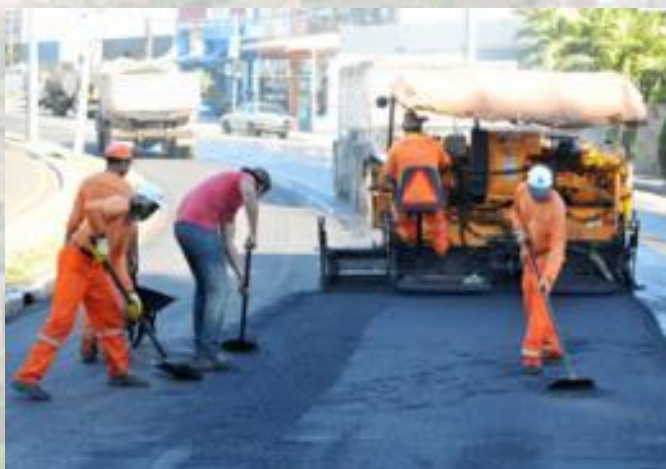
Recape Área Central