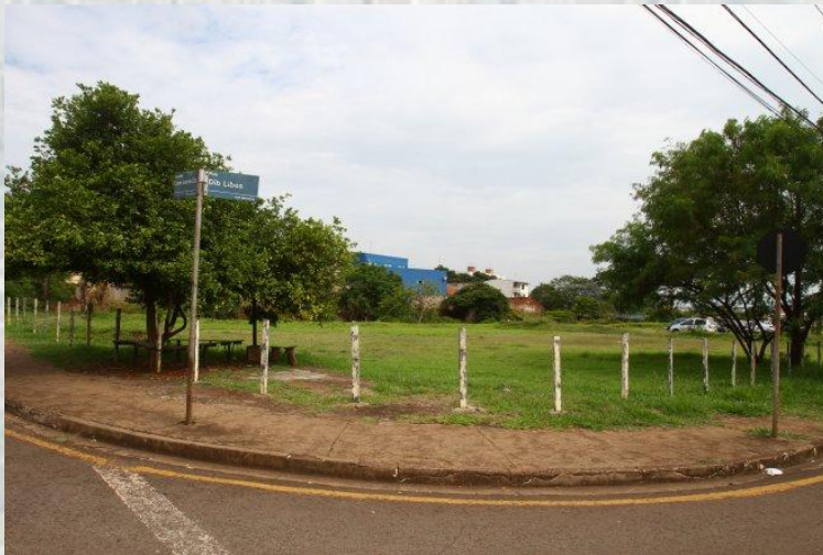
Construção do Centro de Referência Especializado para a População de Rua- CENTRO POP