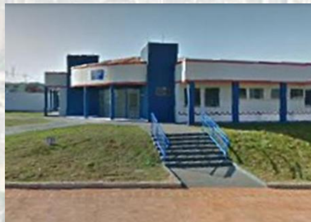
UBS – Vista Bela e JD. Padovani