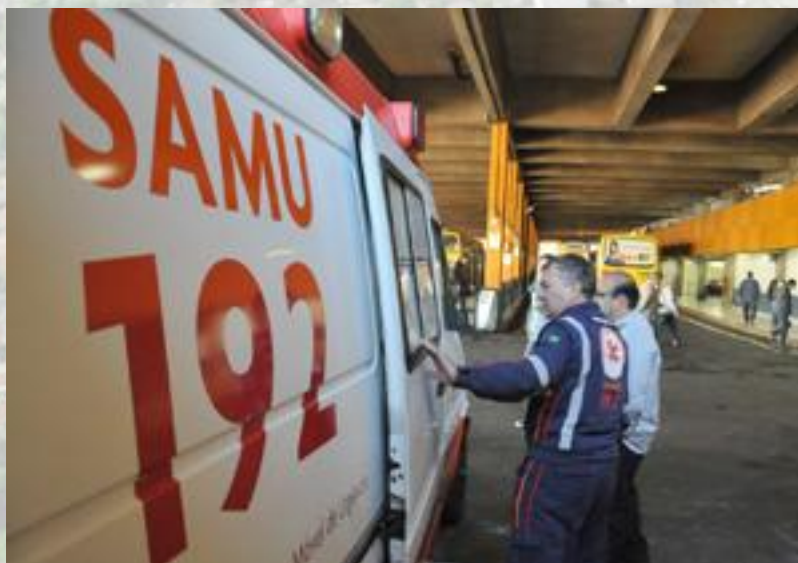
3 Ambulâncias (SAMU e SIATE)