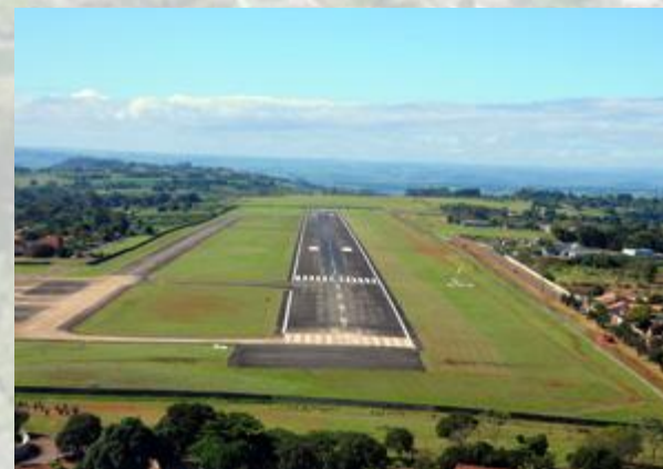
Ampliação do Aeroporto