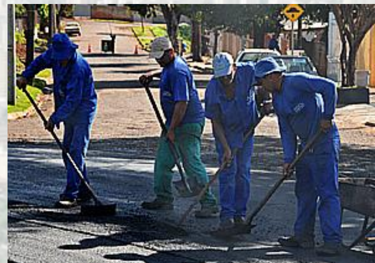
Tapa - Buraco