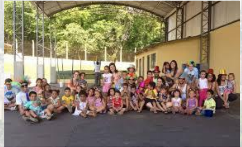
Reforma do CMEI Rafaella Kemmer de Moraes