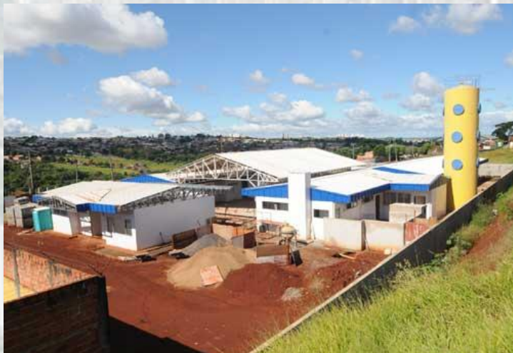
Construção do Centro de Educação Infantil do Jardim Maracanã