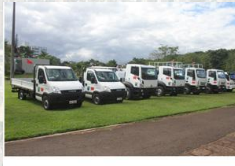
Aquisição de Veículos - 7 Caminhões