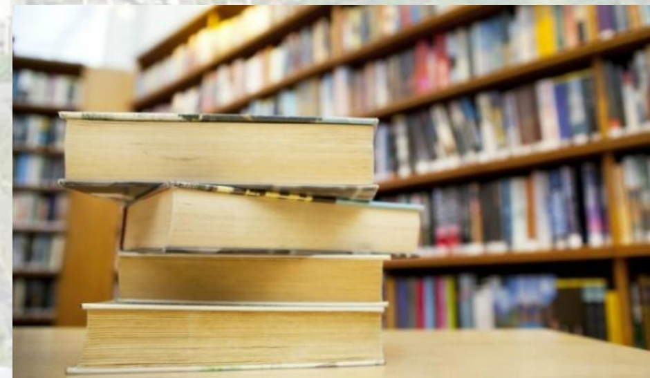
Construção da Biblioteca no Centro Cultural da Zona Sul