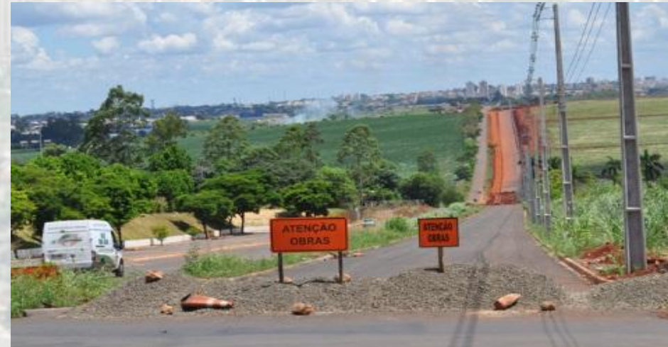
Duplicação da Avenida Angelina Ricci Vezozzo