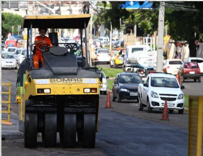
Recapeamento e sinalização na Av. Tiradentes