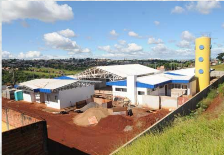
Construção do Centro de Educação Infantil do Jardim Maracanã