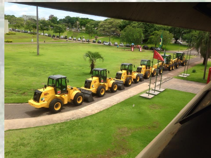
Aquisição de Maquinários