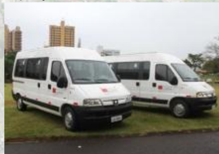
2 Vans (Saúde)