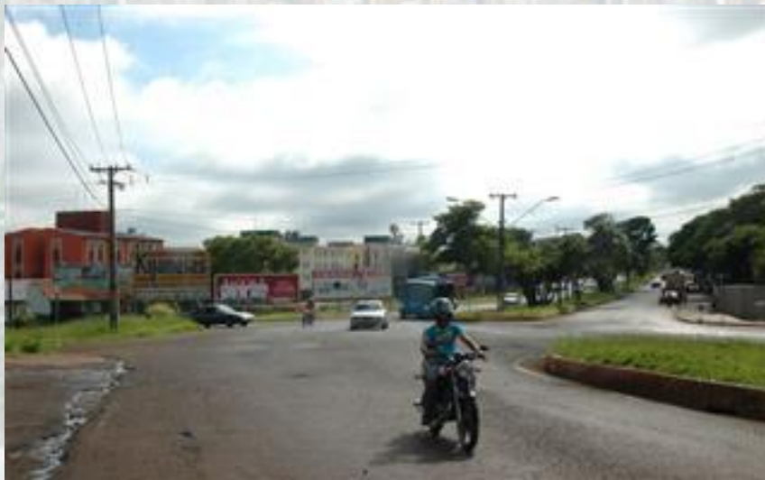
Pavimentação da Av. Saul Elkind