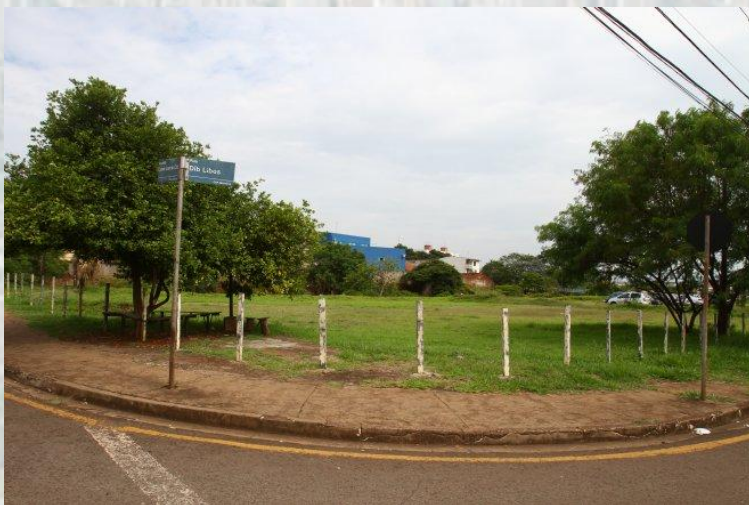
Construção do Centro de Referência Especializado para a População de Rua- CENTRO POP