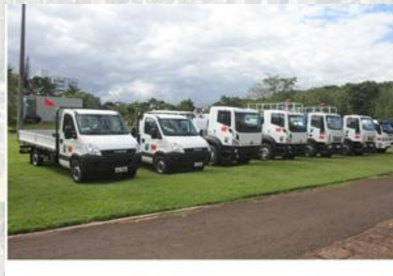
Aquisição de Veículos - 7 Caminhões