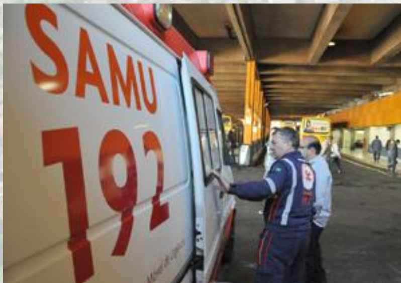
3 Ambulâncias (SAMU e SIATE)