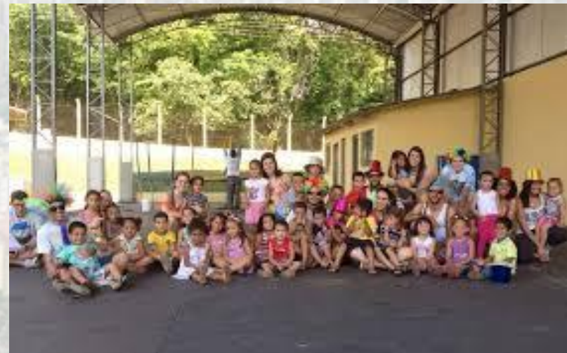
Reforma do CMEI Rafaella Kemmer de Moraes