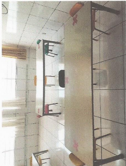
Sala de aula