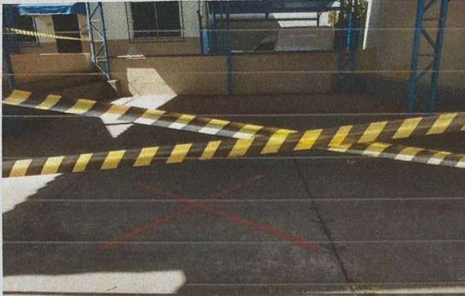
Figura 3 - Quadra com demarcações