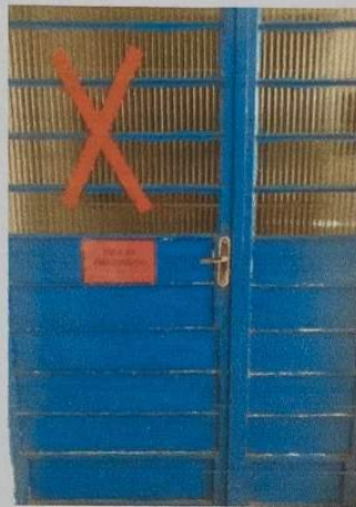
Figura 5 - Sala de Isolamento

quadra e em dias chuvosos, diretamente para a sala de isolamento. Nesses casos, os familiares serão comunicados imediatamente e a criança ficará aos cuidados da Diretora ou Coordenadora até que venham buscá-la.