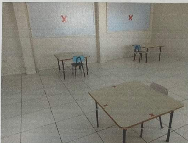
Figura 1 - Sala de aula com demarcações

haverá distanciamento entre as mesmas. Todas as janelas e portas permanecerão abertas durante o período em que as crianças estiverem na instituição.