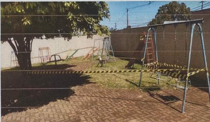
Figura 4 – Parque