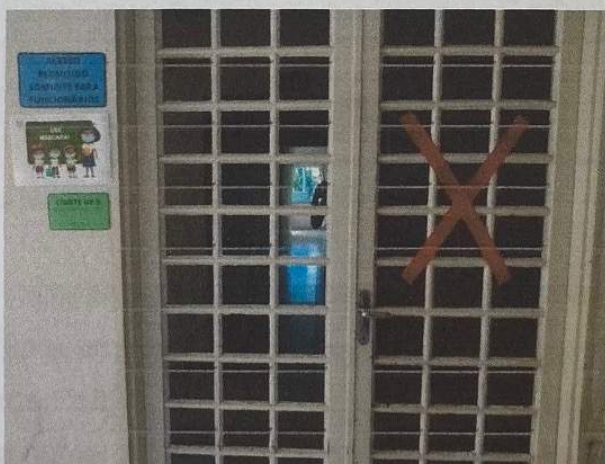
Figura 2 - Porta do refeitório

O refeitório também contará com placas de sinalizações, porém não será utilizado pelas crianças mas somente pelas professoras no horário de almoço, com revezamento e distanciamento.