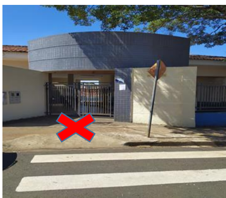
Bloco B – Entrada/Saída Rua Jequitibá, seguirá x vermelho

Os alunos utilizarão os dois portões de acesso, sendo um na Rua Jequitibá e o outro na Rua Carvalho, essa entrada será organizada por ano/turma, com horário escalonado, conforme tabela abaixo. O chão será demarcado por cores para facilitar o direcionamento dos alunos, além da demarcação do lado de fora para que os pais mantenham distanciamento na entrada. Os alunos serão conduzidos pelo professor regente do portão de entrada até o refeitório para o desjejum ou lanche da tarde.