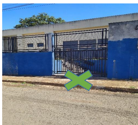
Bloco A – Entrada/Saída Rua Carvalho, seguirá x verde

Os professores e funcionários das empresas terceirizadas deverão aferir a temperatura na entrada, higienizar as mãos com álcool em gel e os calçados no tapete