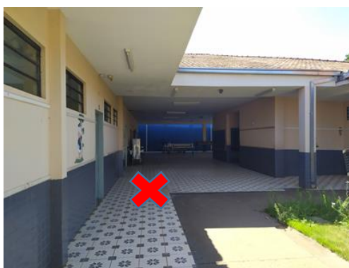
Foto da saída do refeitório

Após o término da refeição, os alunos serão organizados pela professora e orientados para realização da higienização. A saída do refeitório será pela lateral, conforme foto sinalizada com um x vermelho.