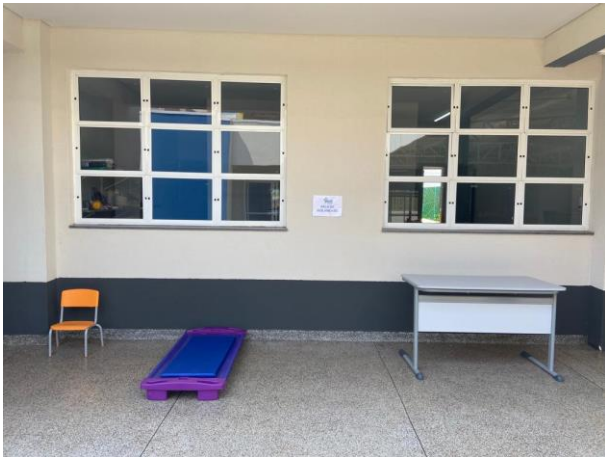
Sala de Isolamento Externo