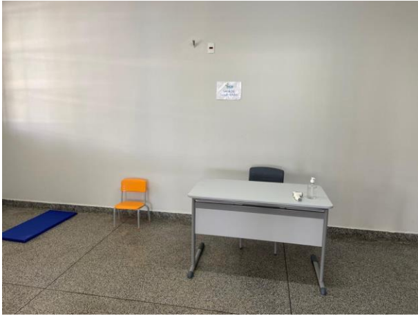
Sala de isolamento para dias de chuva