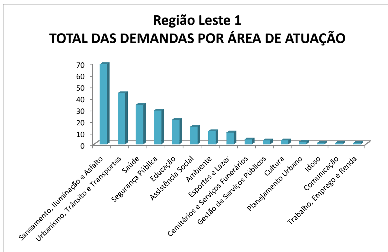
Gráfico 1 - Gráfico referente aos dados da tabela 1 que tem os pedidos da população por área de atuação.