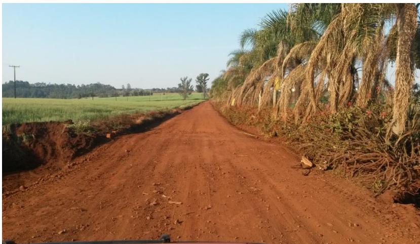
Estrada do Barro Preto