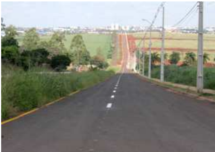
Duplicação da Avenida Angelina Ricci Vezozzo