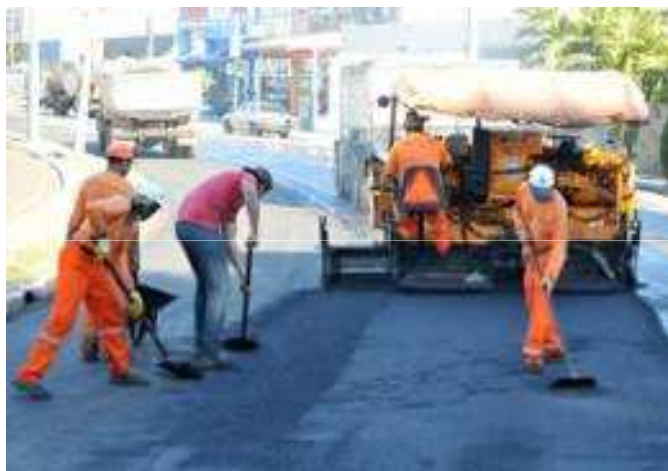
Recape Área Central