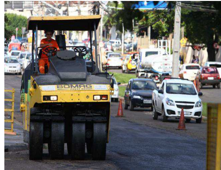
Recapeamento e sinalização na Av. Tiradentes