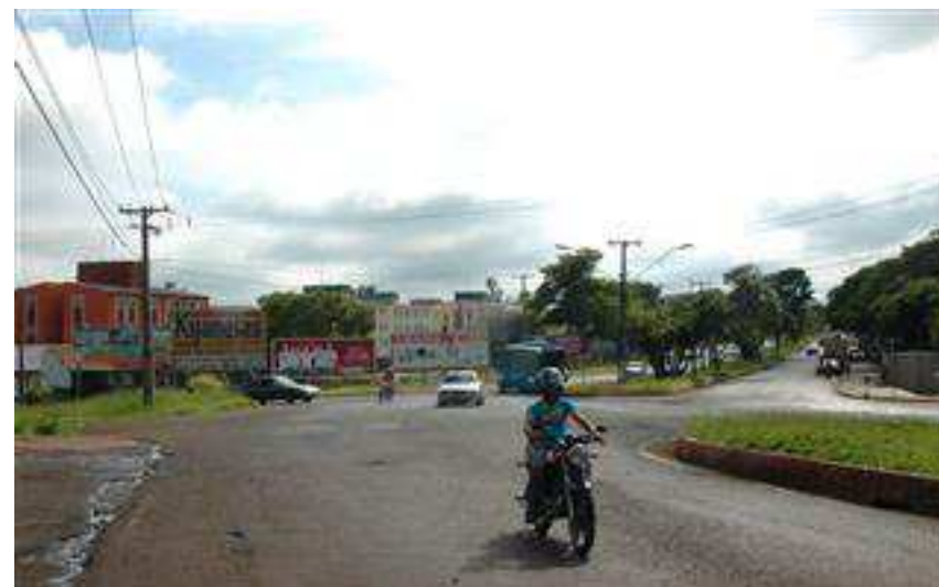
Pavimentação da Av. Saul Elkind