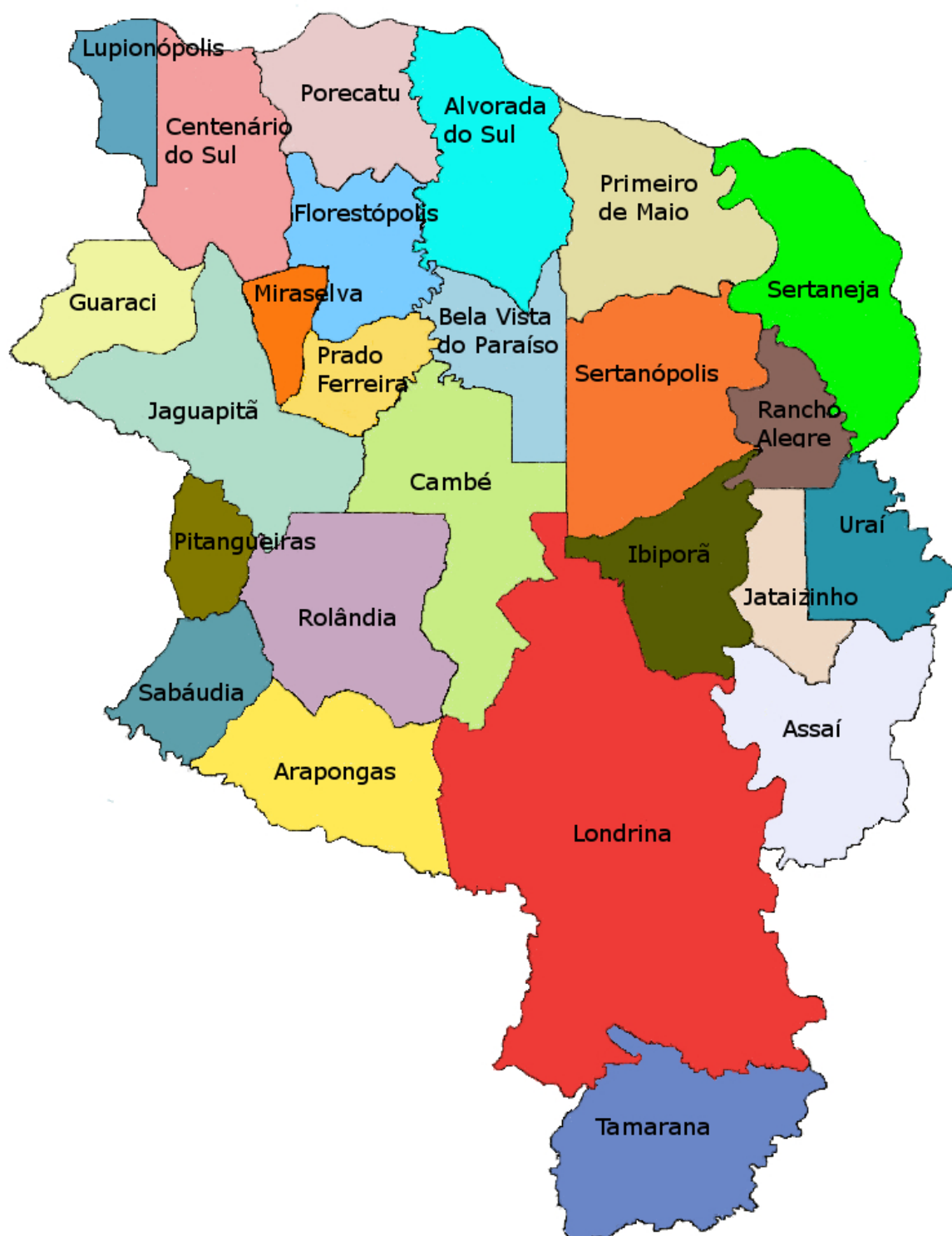
Mapa dos Municípios da Região Metropolitana de Londrina.