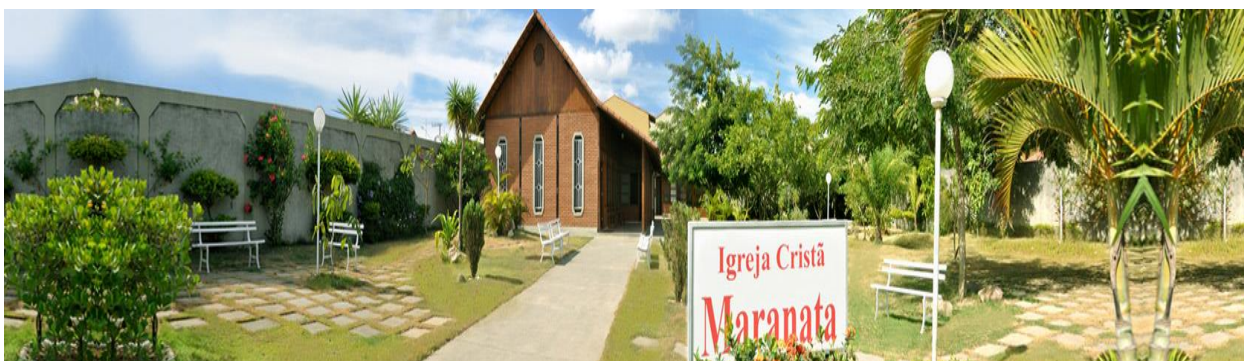
Igreja Cristã Maranata.

A Igreja Cristã Maranata realiza atividades pastorais no período diurno e cultos 19h30mim (horário de Brasília) de segunda a sábado, com exceção da sexta feira onde o culto é realizado nos lares. Aos domingos, às 10h30m acontece a Escola Bíblica Dominical, neste horário ocorrem também, as aulas para crianças, intermediárias e adolescentes. Nesse dia, a igreja volta a se reunir as 19h30min para o culto da noite. Aos Sábados, no horário das 18hs, é a vez da reunião dos jovens, momento em que é abordado sempre um tema específico para este grupo de irmãos.