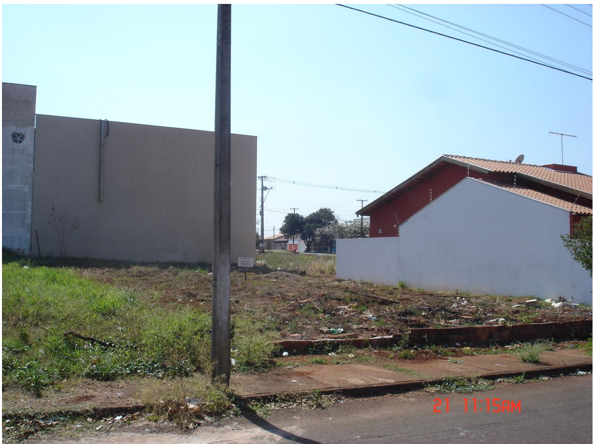
Foto: Terreno da Igreja Cristã Maranata no Jardim Belo Horizonte – Londrina – PR.

Na região do Norte do Estado do Paraná, tem representações da Igreja Cristã Maranata em várias cidades. Em Londrina existem 2 templos e um terceiro a ser instalado ainda.