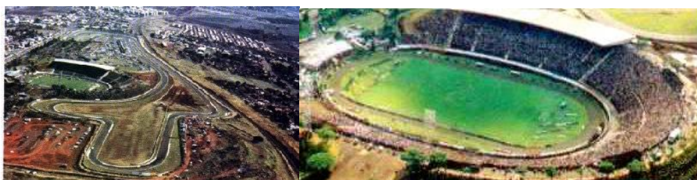
Estádio do Café – Londrina - Paraná Autódromo Internacional Ayrton Senna – Londrina – Paraná

Como Patrimônio Natural, Londrina consta com três Unidades de Conservação de supra importância para a biodiversidade regional: o Parque Municipal Arthur Thomas, o Parque Municipal Daisaku Ikeda e o Parque Estadual Matam dos Godoy – este último remanescente original da floresta que antes cobria todo o norte e oeste do Estado do Paraná da Floresta Estacional Semidecidual (Floresta Atlântica de Interior).