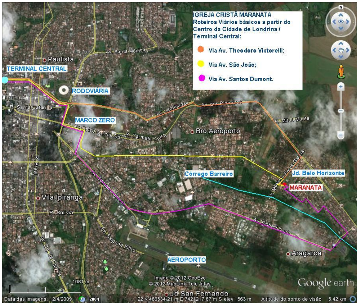
Figura: Roteiros Viários.

As referências as estas avenidas são fundamentais para o entendimento da dinâmica de fluxo de veículos da cidade de Londrina – PR. O empreendimento em análise e apesar de não está localizado nas regiões mais centrais da cidade, mas se encontra em local estratégico com direcionamentos dos fluxos a serem considerados para esta análise deste EIV – Estudo de Impacto de Vizinhança.