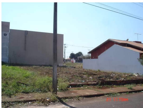
Terreno da Igreja Cristã Maranata na Rua Leontina Augusto (Quadra 05, Lote 03 – Jardim Belo Horizonte) Londrina – Paraná.