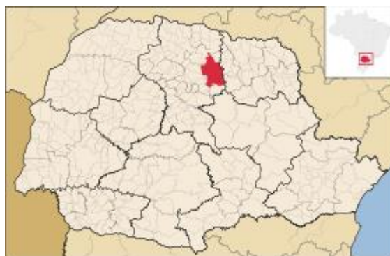
Localização de Londrina no Paraná