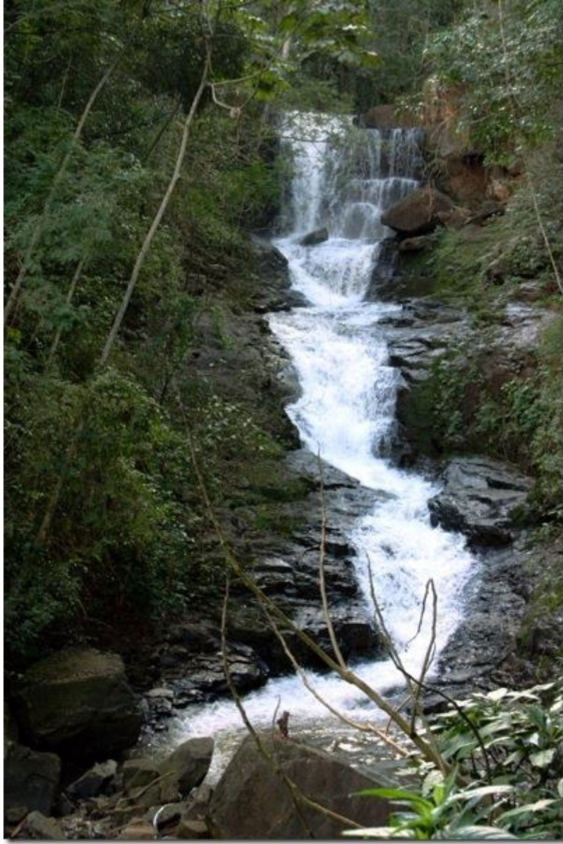
Parque Municipal Arthur Thomas – Londrina - Paraná