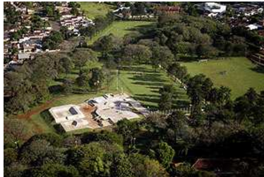
Vista aérea do CSU.

incluem posto de saúde, setores social e administrativo, setor de recreação orientada e setores esportivo e educativo-cultural. O CSU possui os seguintes equipamentos urbanos: campo de futebol, pista de caminhada, quadra poliesportiva, pista profissional de skate e um palco para apresentações. Ao redor do espaço destinado ao lazer, ficam os órgãos de assistência à comunidade.