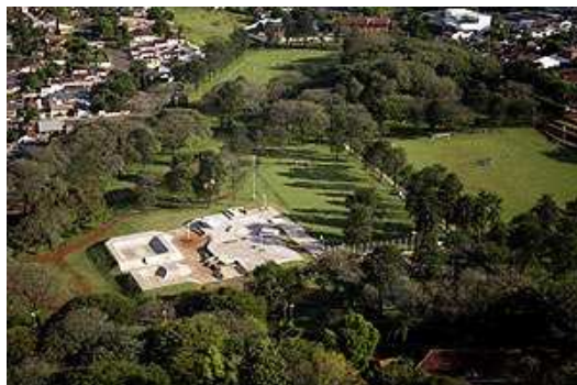
Vista aérea do CSU.

incluem posto de saúde, setores social e administrativo, setor de recreação orientada e setores esportivo e educativo-cultural. O CSU possui os seguintes equipamentos urbanos: campo de futebol, pista de caminhada, quadra poliesportiva, pista profissional de skate e um palco para apresentações. Ao redor do espaço destinado ao lazer, ficam os órgãos de assistência à comunidade.