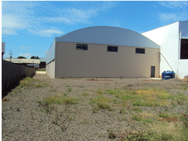
Área permeável (1.500M 2 = 60%) - fundos do lote.

O empreendimento apresenta como drenagem natural área permeável de 1.500m 2 (60% do total do lote). O corpo hídrico receptor é o Córrego Jaci, a aproximadamente 130m ao sul.