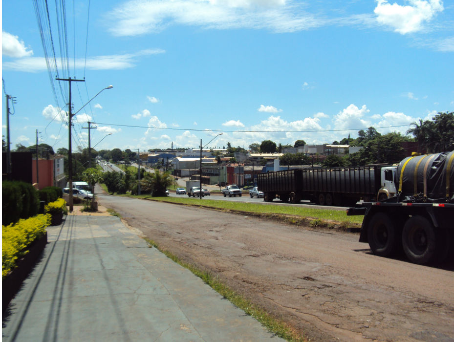
Rua marginal de acesso ao empreendimento.(rodovia cheia, marginal vazia)

O tráfego pela via marginal é muito baixo, embora pela Rodovia seja intenso.