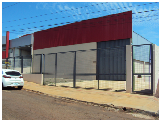
Fachada frontal para Rodovia BR369

O projeto prevê a ocupação do Lote CH-3, à Av. Brasília 6.820 em Londrina/PR, com 2.500,00m 2 , com a ocupação de um prédio existente (com área construída de 1.000,00M 2 ), com área de estacionamento de 950,00M 2 , área para carga /descarga com manobra interna (ver mapa 04), em 01 pavimento (pé direito=6,00m), previsto para as atividades de comercialização, montagem e instalação de vidros e acessórios automotivos.