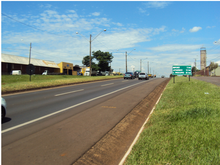
Sinalização vertical da via.