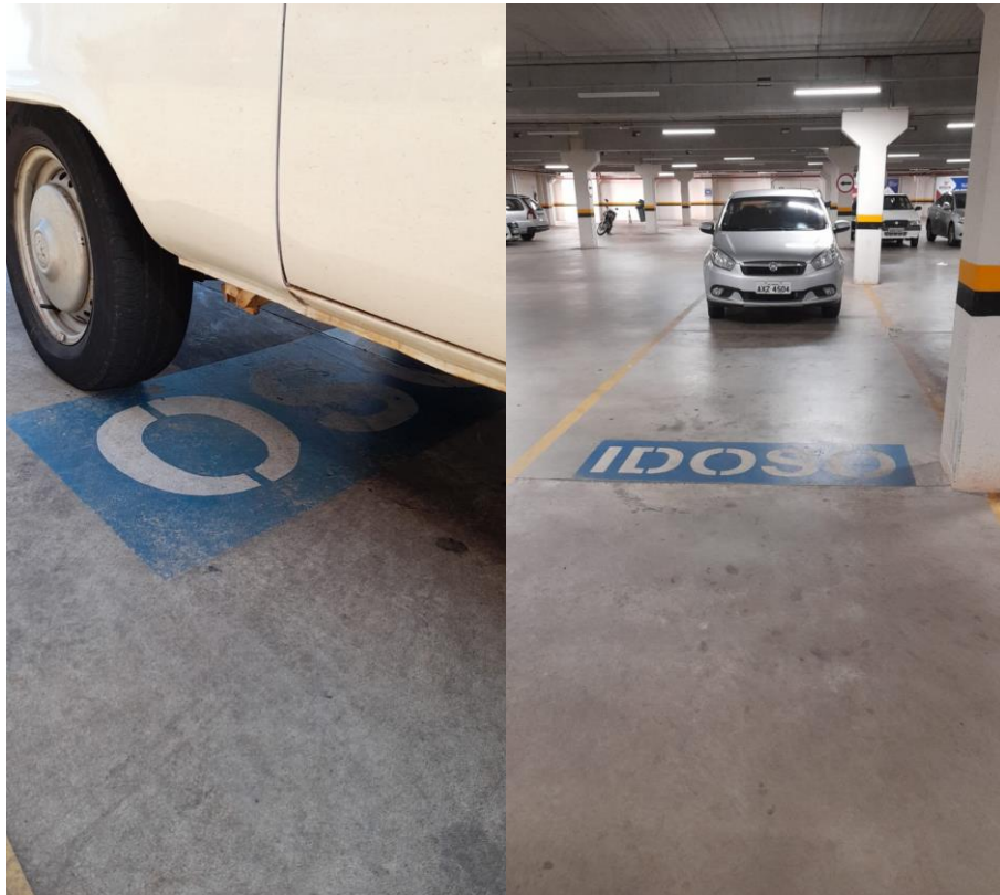
Figura 11: Vagas de idoso no estacionamento do empreendimento.