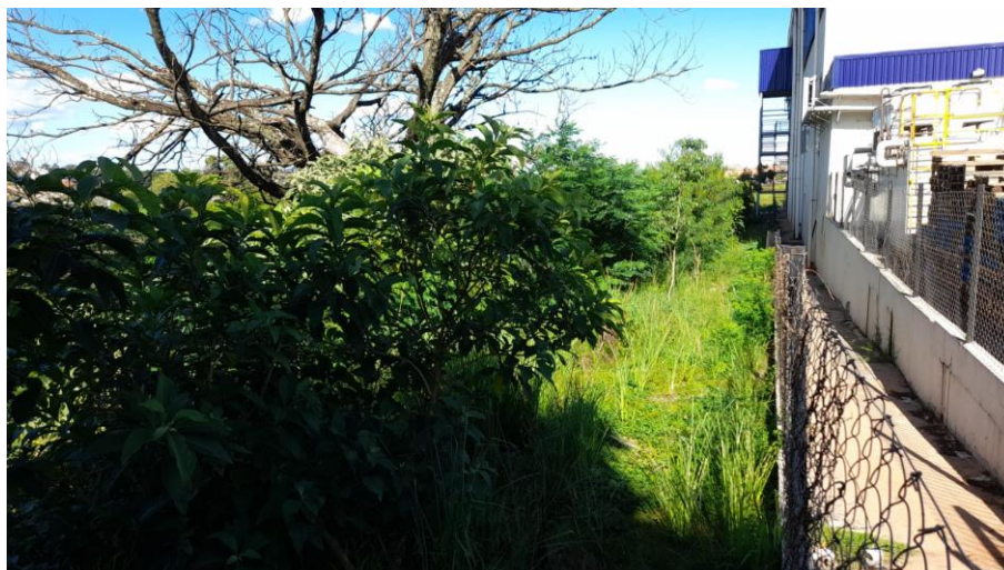
Figura 3: Cobertura vegetal existente no interior do lote.