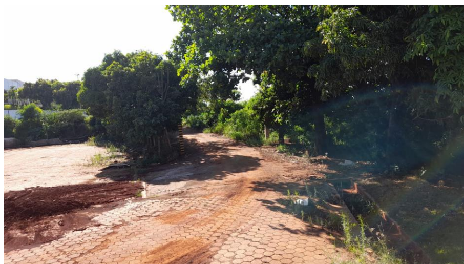
Figura 2: Cobertura vegetal existente no interior do lote. Fonte: CSD, 2022.