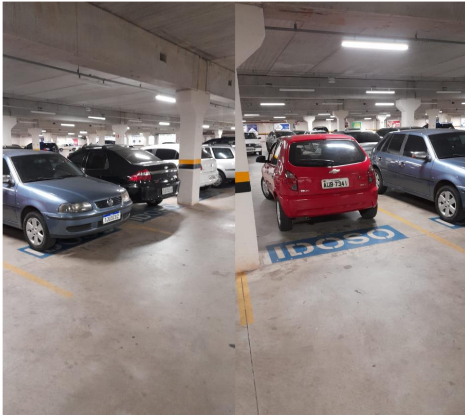
Figura 12: Vagas de idoso no estacionamento do empreendimento.