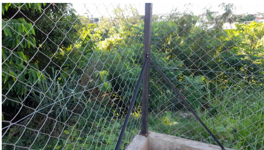
Figura 5: Cobertura vegetal existente no interior do lote.