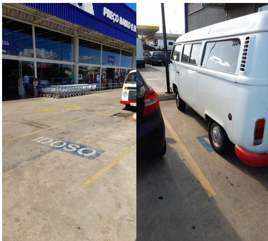
Figura 10: Vagas de idoso no estacionamento do empreendimento.