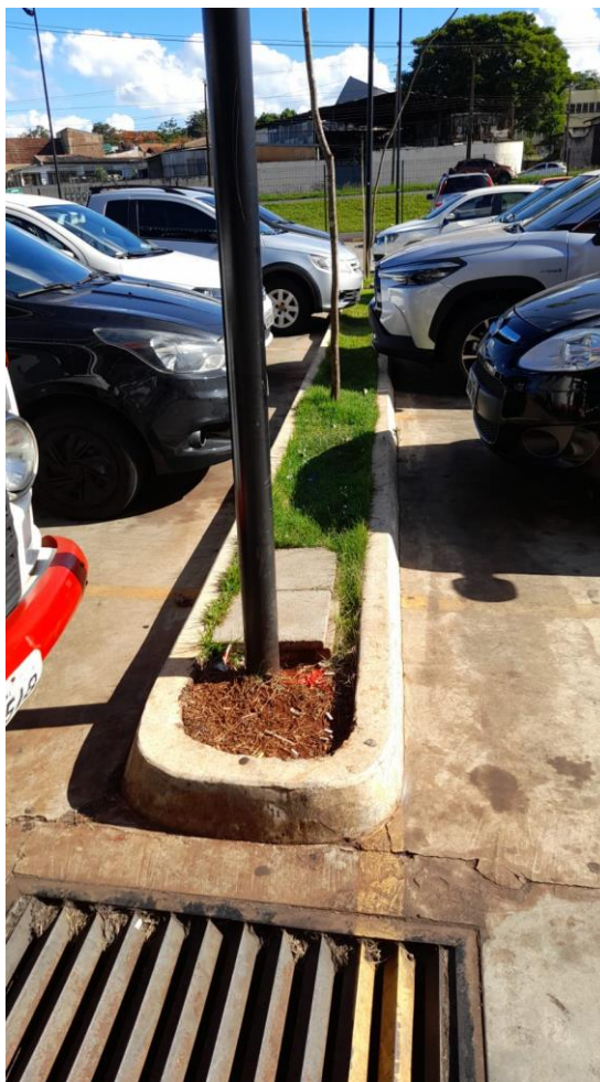
Figura 8: Canteiros com cobertura vegetal existentes no interior do lote.