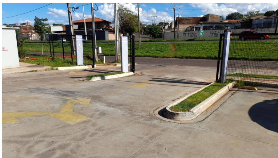
Figura 7: Canteiros com cobertura vegetal existentes no interior do lote.