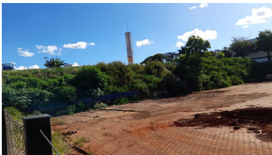
Figura 4: Cobertura vegetal existente no interior do lote.