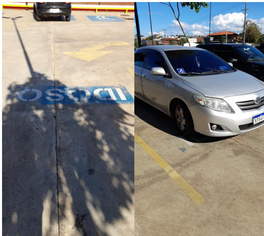
Figura 9: Vagas de idoso no estacionamento do empreendimento.