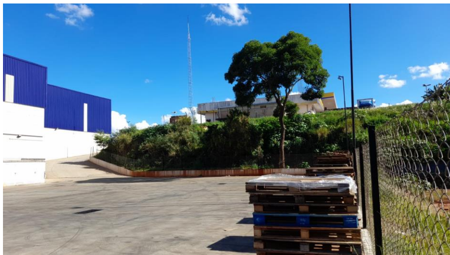
Figura 6: Cobertura vegetal existente no interior do lote.