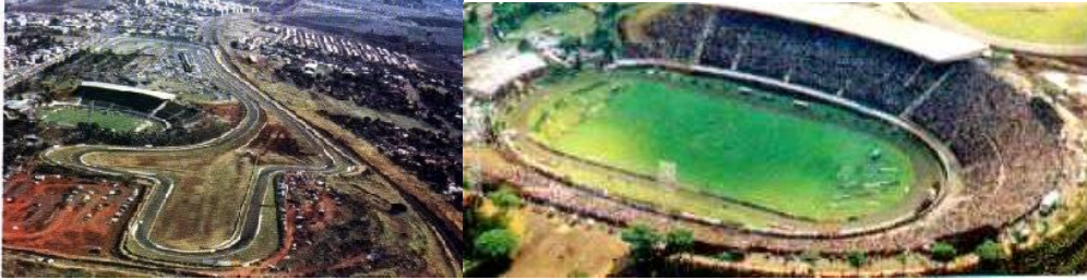
Estádio do Café – Londrina - Paraná Autódromo Internacional Ayrton Senna – Londrina – Paraná