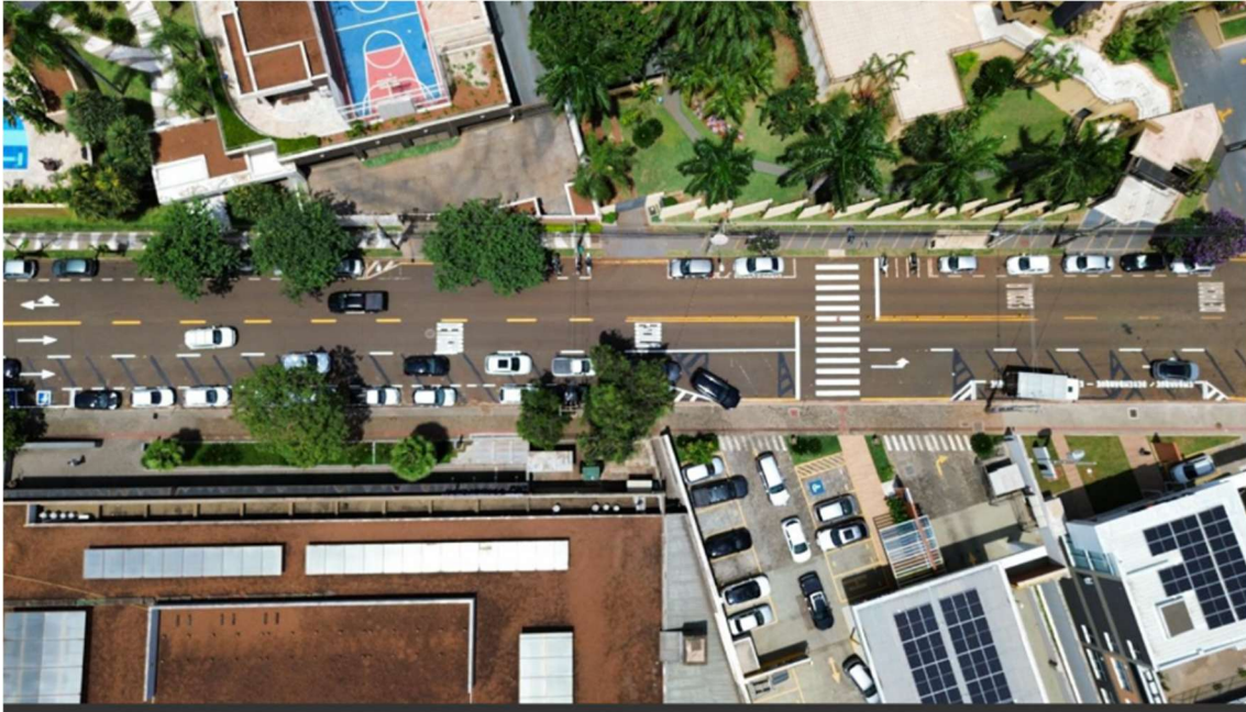
Imagem 25 de fevereiro de 2025 11:48

Em 8 de setembro de 2020 é emitido o Alvará de Licença para construção 1918/2020.