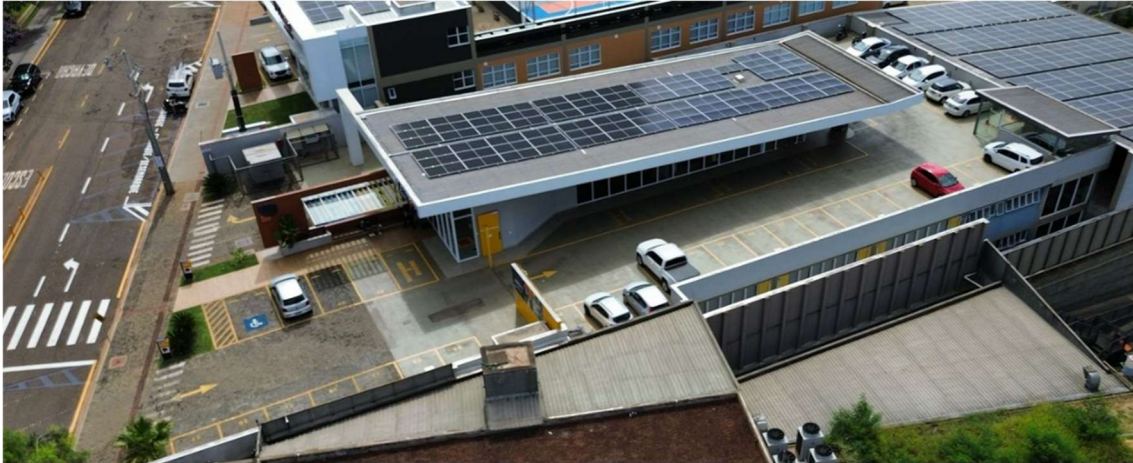
Vista aérea da região de embarque e desembarque