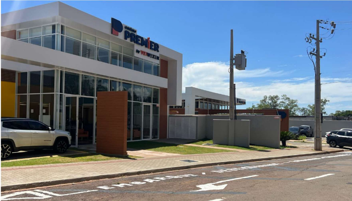
Imagem feita em 7 de março de 2025 as 11:59.

Já em 12 de agosto a Gerencia de Instrumentos Urbanísticos – IPPUL emitiu a seguinte informação: