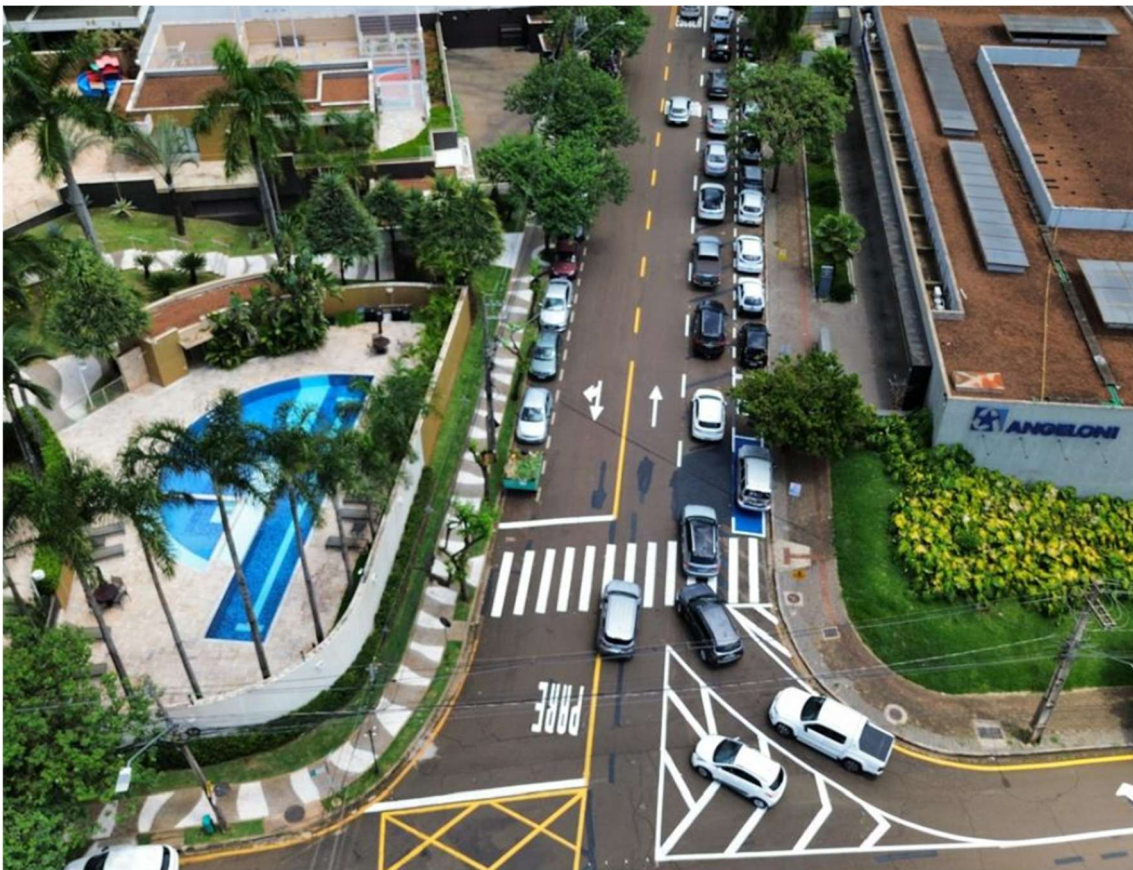
Imagem em 25 de fevereiro de 2025 as 11:54

Em 4 de setembro de 2020 foram apresentados os projetos corrigidos, ART, Anexo de dispensa de EIV e RRT do projeto, e o DAP encaminhou para o Setor de Alvará.