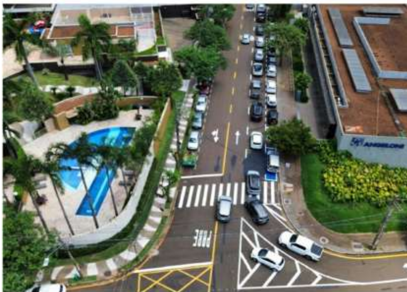
Imagem em 25 de fevereiro de 2025 às 11:54

Conforme foto acima, de 25/02/2025, posterior às adequações das vias pelo órgão competente do Município - CMTU, apresentado no Laudo, verifica-se veículo passando por cima de faixa branca, posto que os veículos que se dirigem às Escolas estão posicionados congestionando a via.