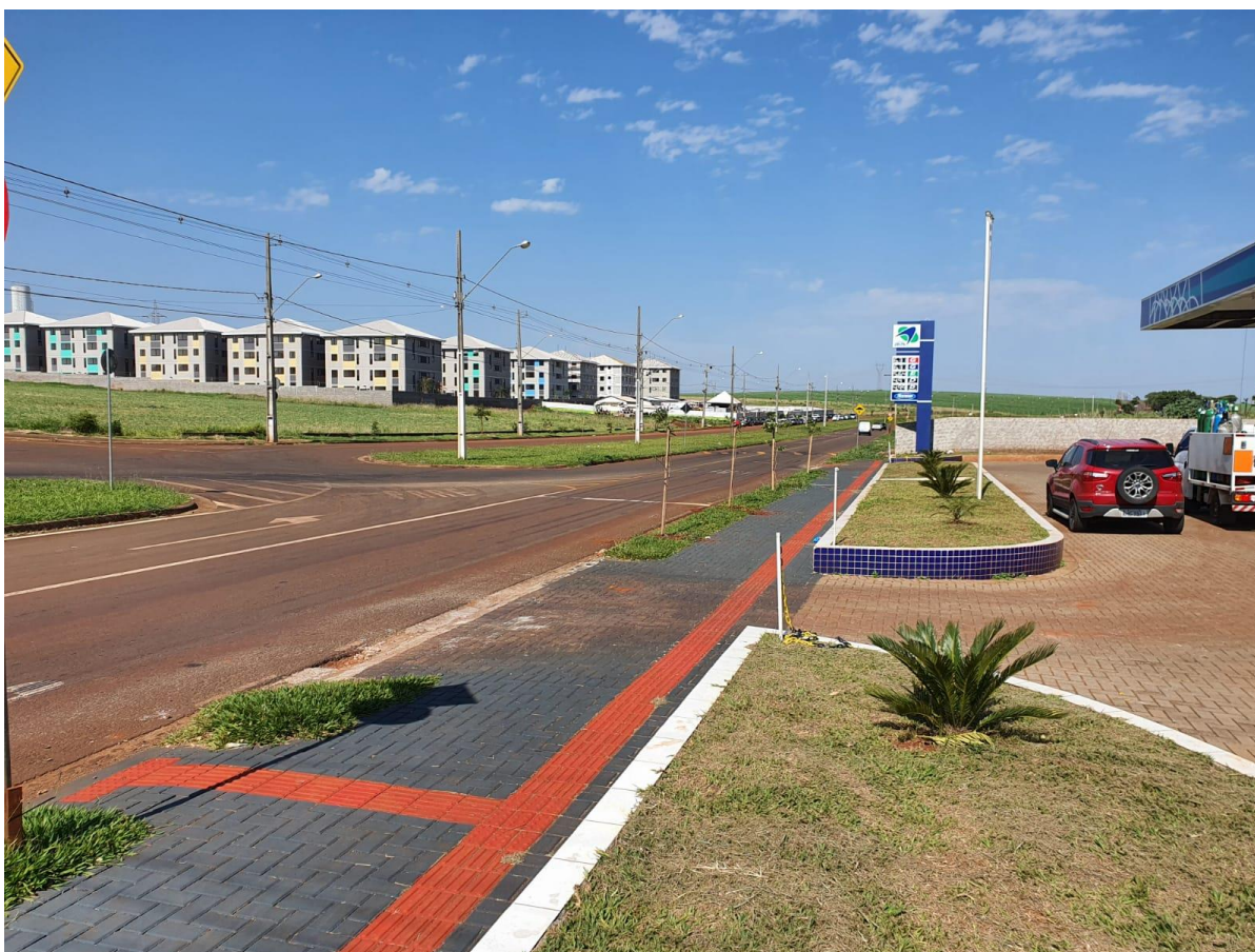
Figura 14 - Mudas plantadas na Av. Saul Elkind.

Para atender tal medida foram plantadas 4 (quatro) mudas de médio porte na Avenida Saul Elkind, sem posteamento, 3 (três) mudas de pequeno porte na Rua Rosa Golin Milhorini, com posteamento, e 2 (duas) mudas de médio porte no canteiro lateral do pátio do posto.