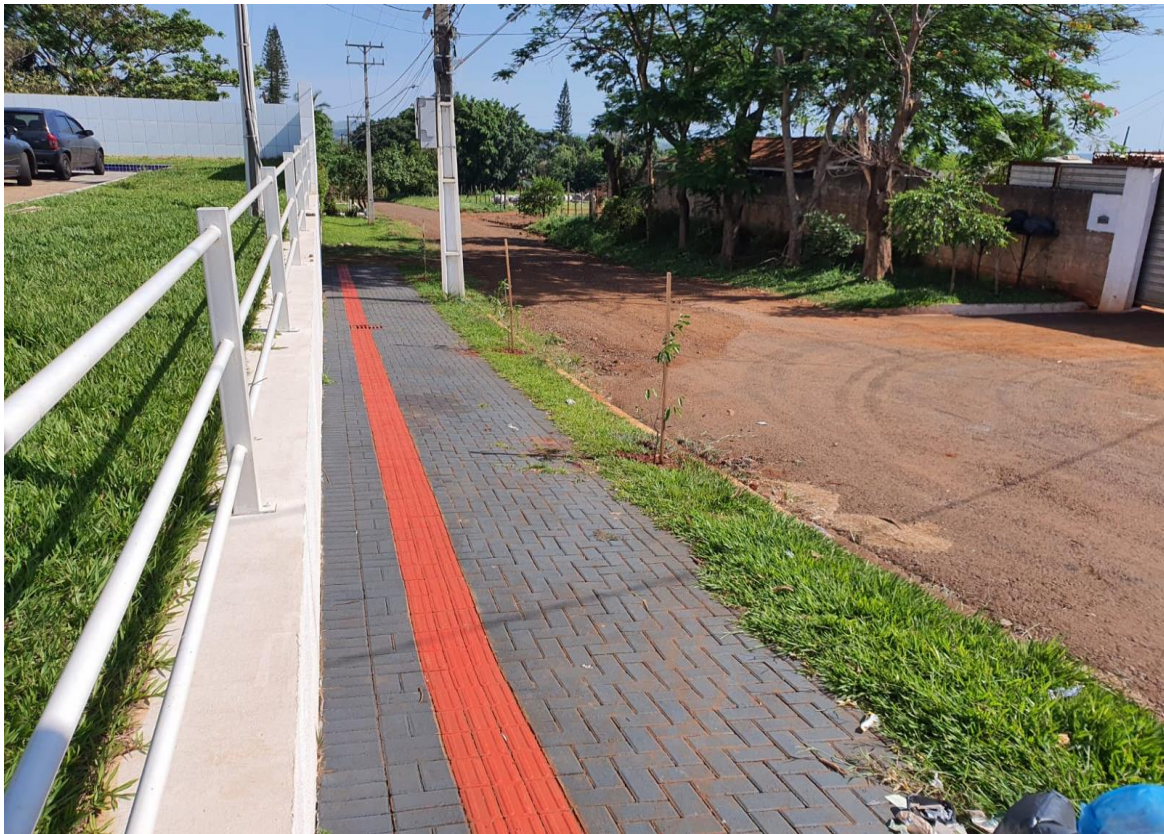
Figura 16 - Mudras plantadas na Rua Rosa Golin Milhorini.