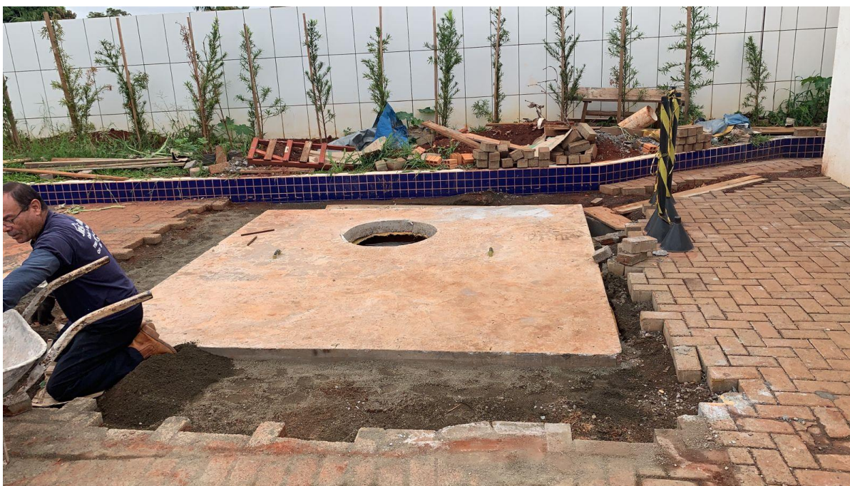
Figura 30 - Execução da cisterna.