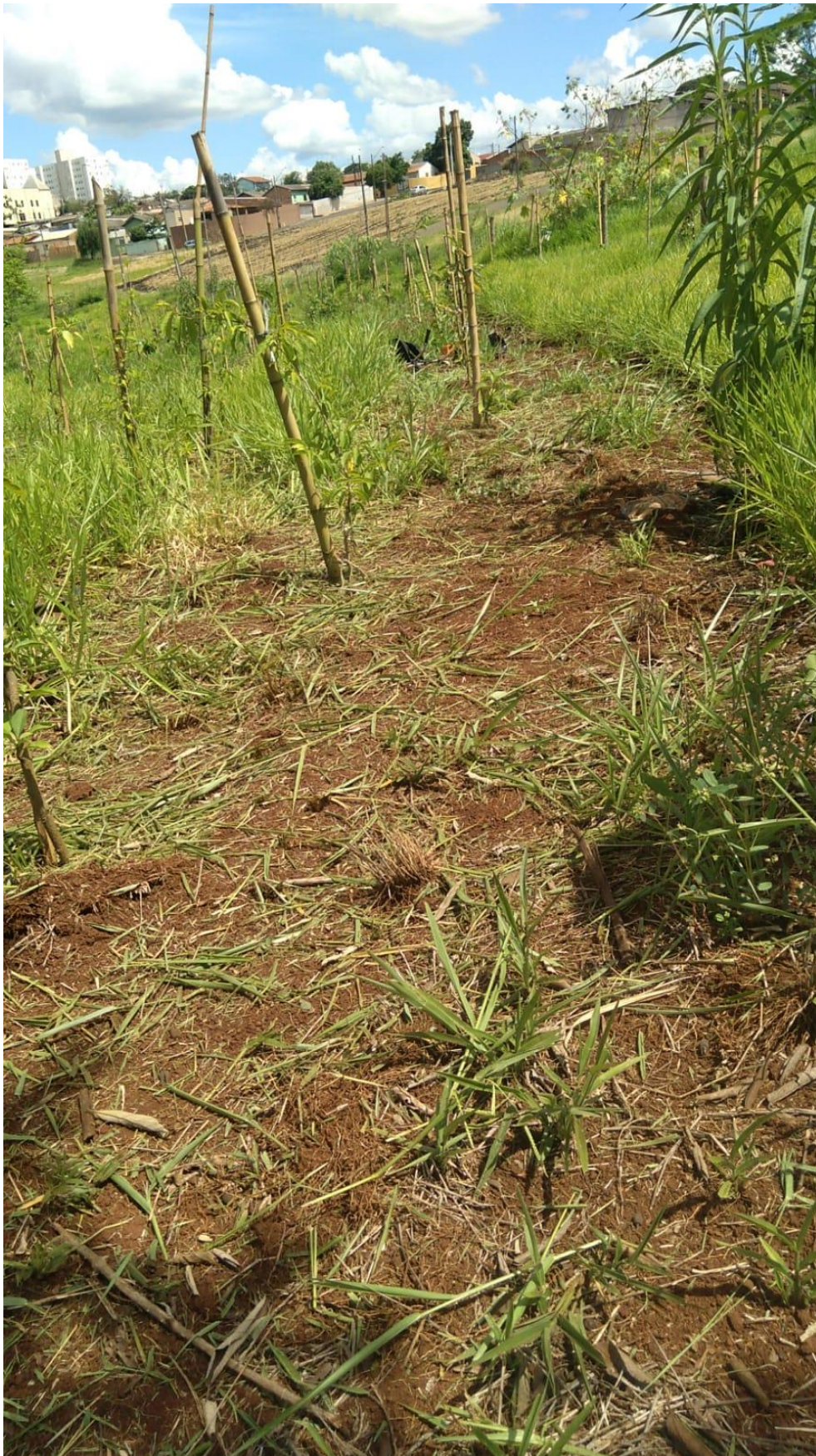
Figura 11 - Mudanças já plantadas.