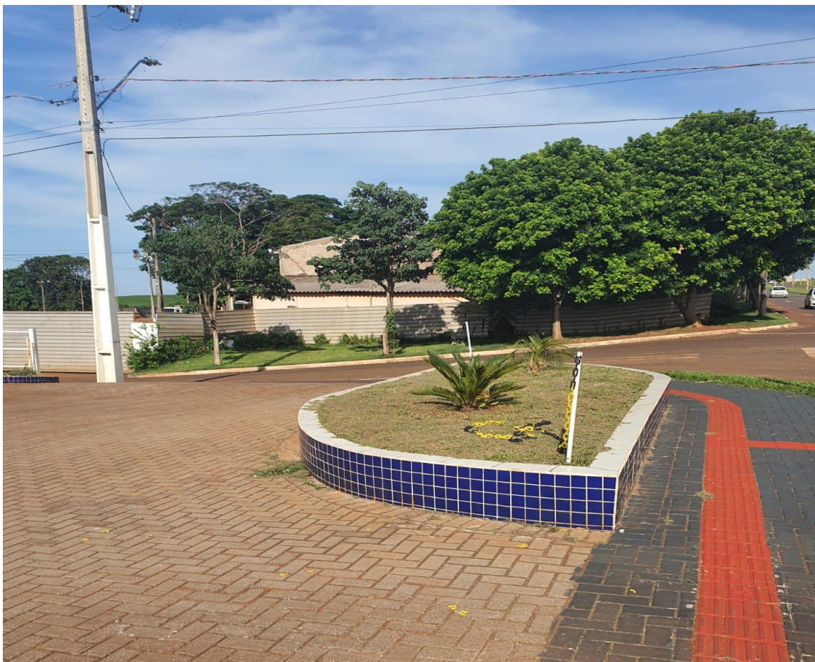
Figura 19 - Canteiros com vegetação.

De acordo com o projeto de paisagismo elaborado, que segue em anexo, foram executados canteiros com vegetação e plantas para barreira vegetal na lateral e fundos do terreno, que contribuem para obstrução parcial sonora gerada pelo empreendimento, e para o conforto da população do entorno. Além dos canteiros permeáveis, também foi executado piso em paver na área de manobra e estacionamento, o qual garante uma área permeável de 51,27%.