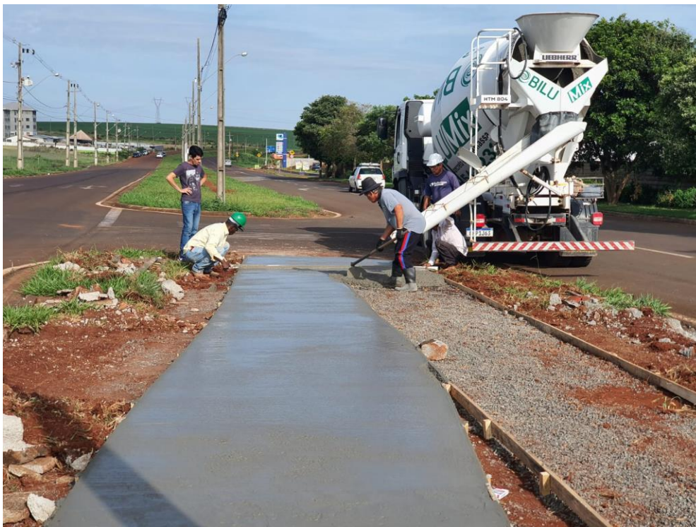
Figura 17 – Etapa 3 – Concretagem da ciclovia.