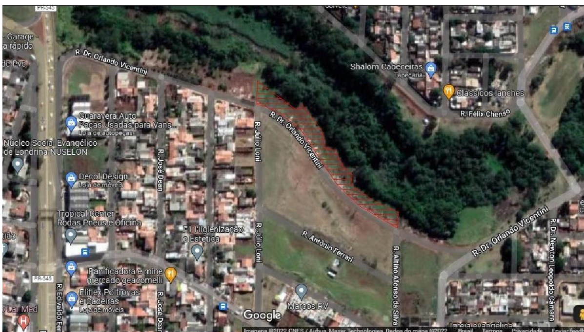
Figura 2 - Localização da área de reflorestamento.

O cumprimento da medida acima citada, foi executada na área de preservação ambiental na Rua Dr. Orlando Vicentini, entre as Ruas Altino Afonso da Silva e Julio Loni, bairro Jardim Moema, com as seguintes coordenadas geográficas -23.274206, -51.145759. Local esse indicado pela Secretaria Municipal de Meio Ambiente (SEMA).