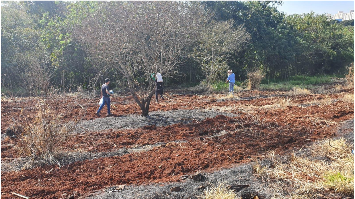
Figura 6 - Limpeza do terreno e preparo da terra.