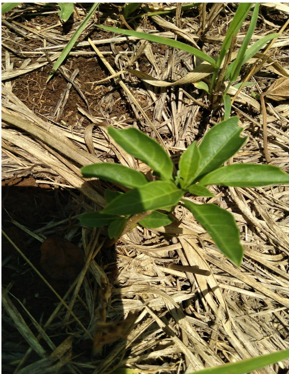
Figura 9 - Mudas já plantadas.

Após o plantio, a equipe contratada para o acompanhamento e cuidado das mudas está executando mensalmente a limpeza, o controle de pragas e a irrigação das mudas nos períodos de estiagem.