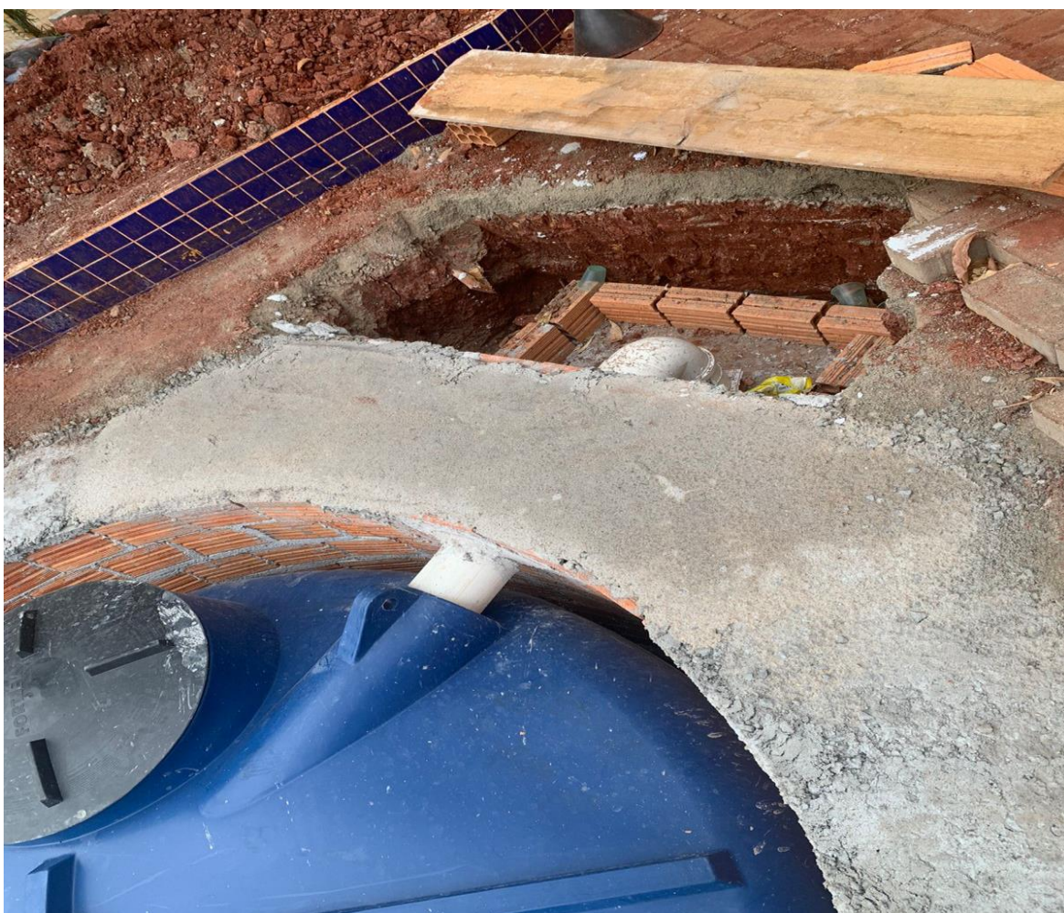
Figura 29 - Execução da cisterna.