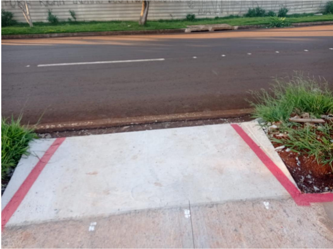
Figura 22 – Etapa 4 – Pintura da ciclovia.