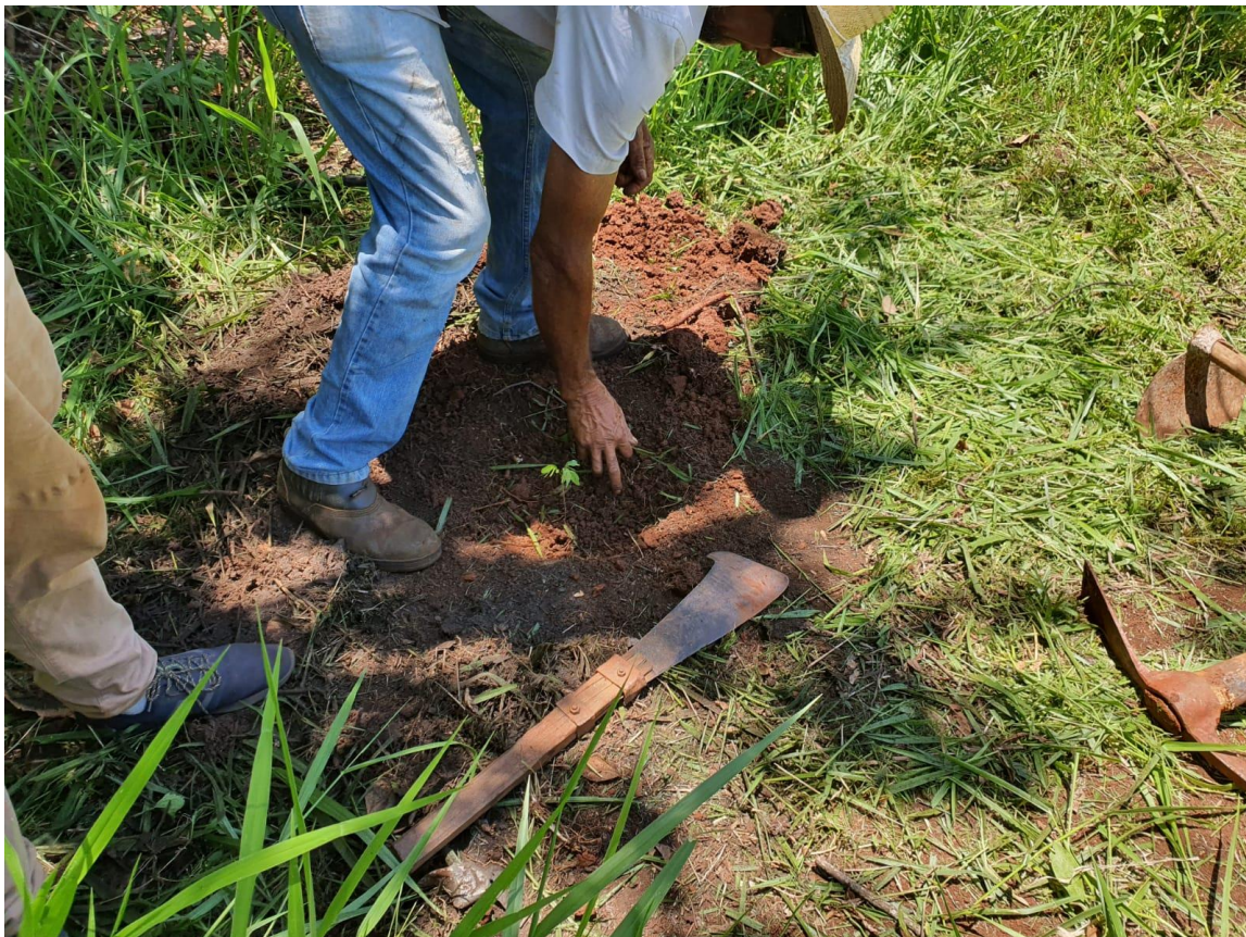
Figura 5 - Limpeza do terreno e preparo da terra.

Para realização do plantio das 800 mudas, a empresa contratou uma equipe especializada para executar a limpeza do local e o preparo da terra.