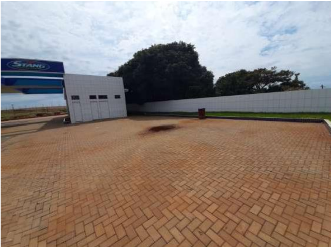
Figura 24 - Piso permeável (paver).