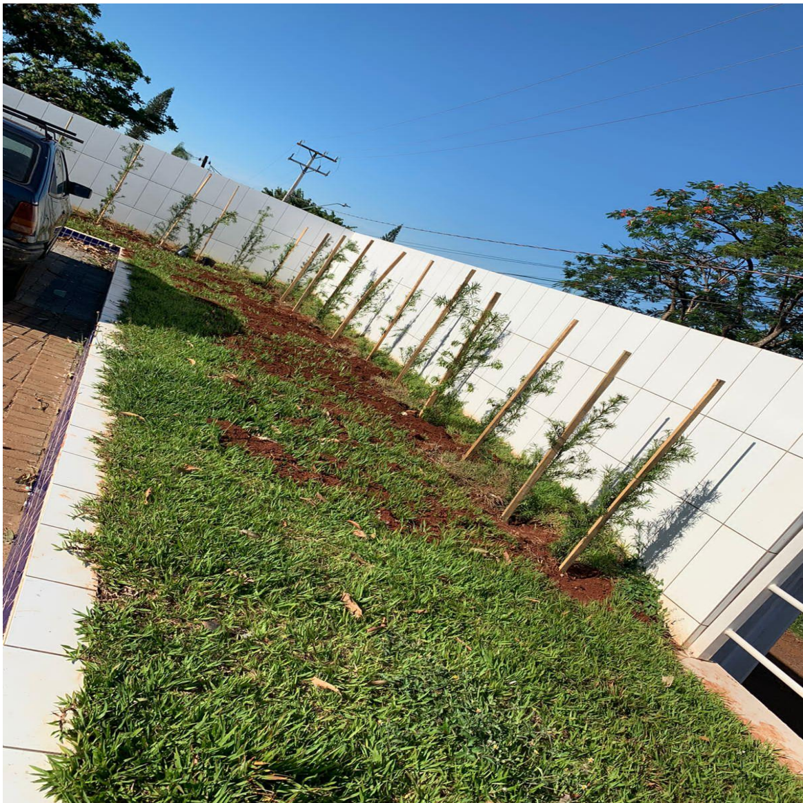
Figura 21 - "Barreira Vegetal" na lateral do terreno.