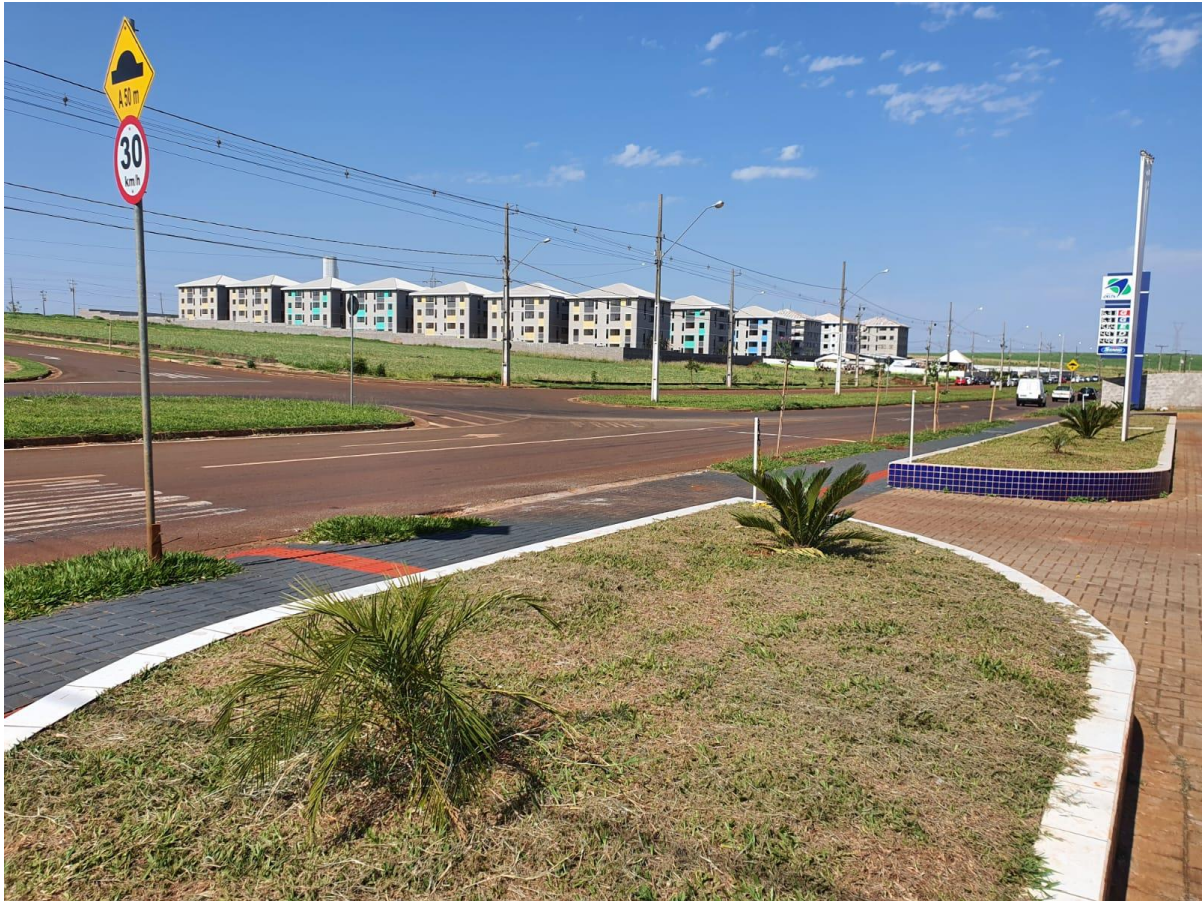
Figura 33 - Av. Saul Elkind.