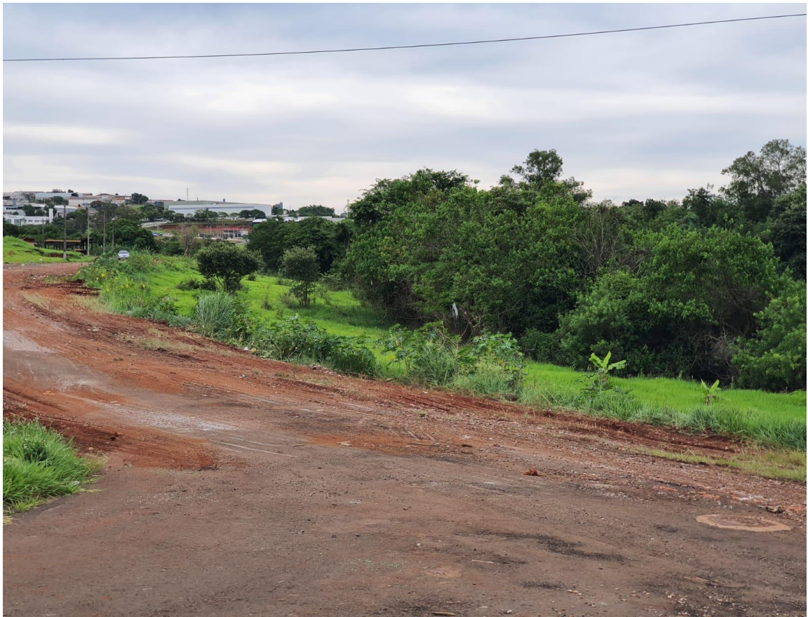
Figura 3 - Foto do local antes do plantio.