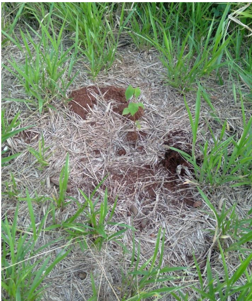
Figura 13 - Mudras já plantadas.