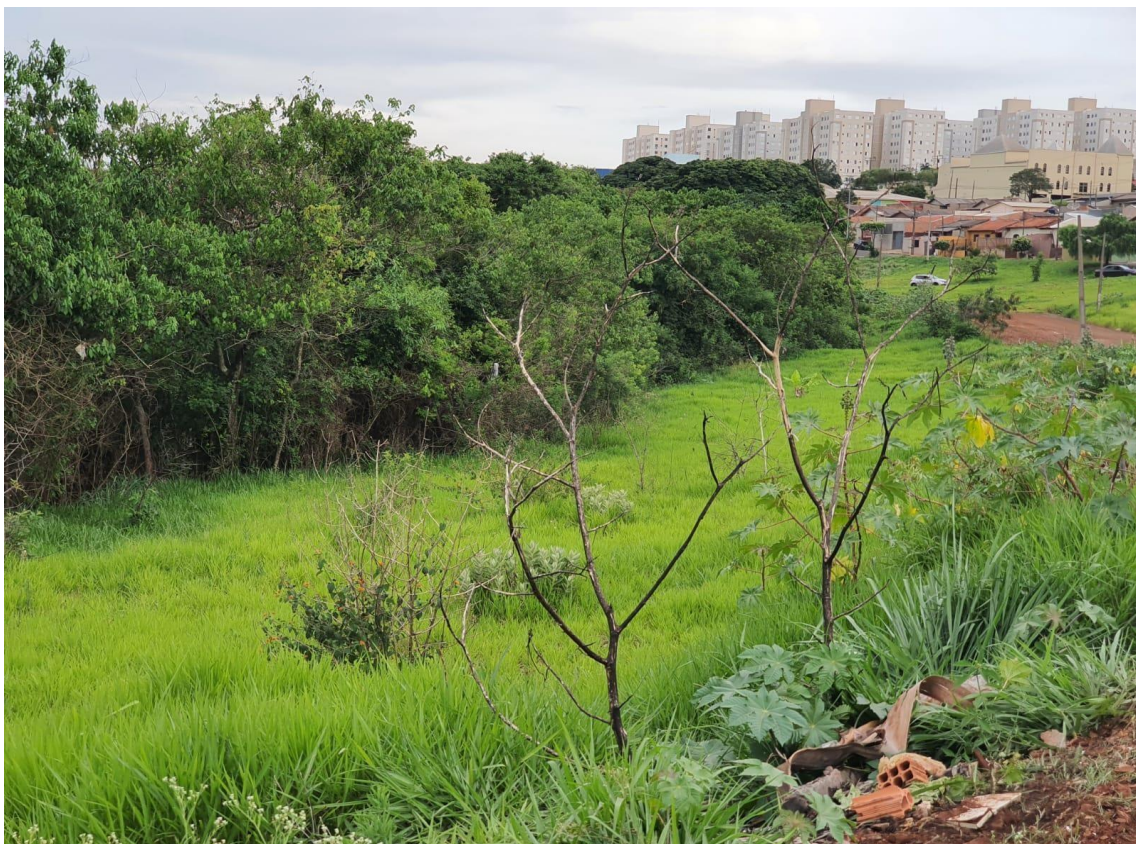
Figura 4 - Foto do local antes do plantio.