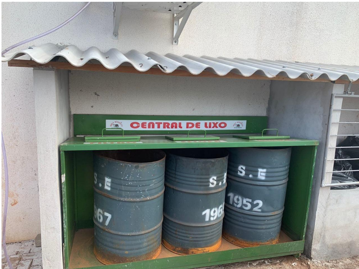
Figura 25 - Central de lixo, criada atrás da conveniência.

Para atender tais itens, foi elaborado um PGR (plano de gerenciamento de risco), elaborado pela engenheira ambiental responsável pela empresa. Para atender o item cinco o qual trata da separação do lixo produzido pelo empreendimento, houve a construção de um ambiente coberto com divisórias de lixo comum e contaminado.