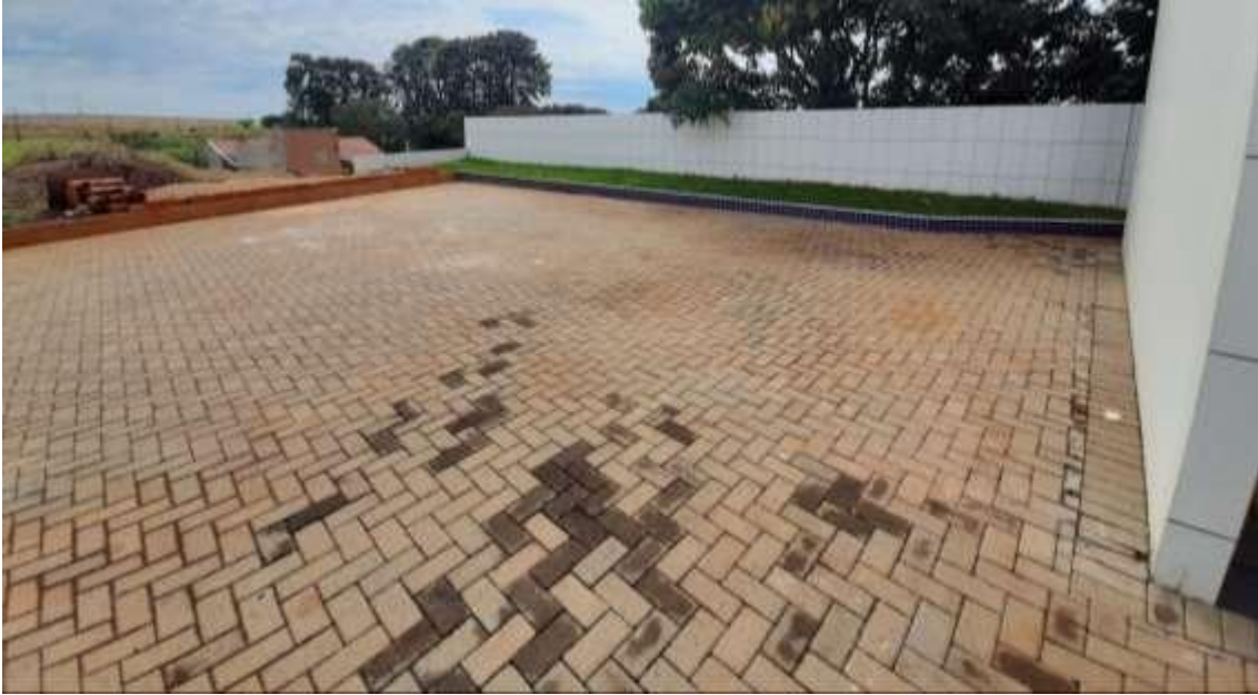
Figura 23 - Piso permeável (paver).