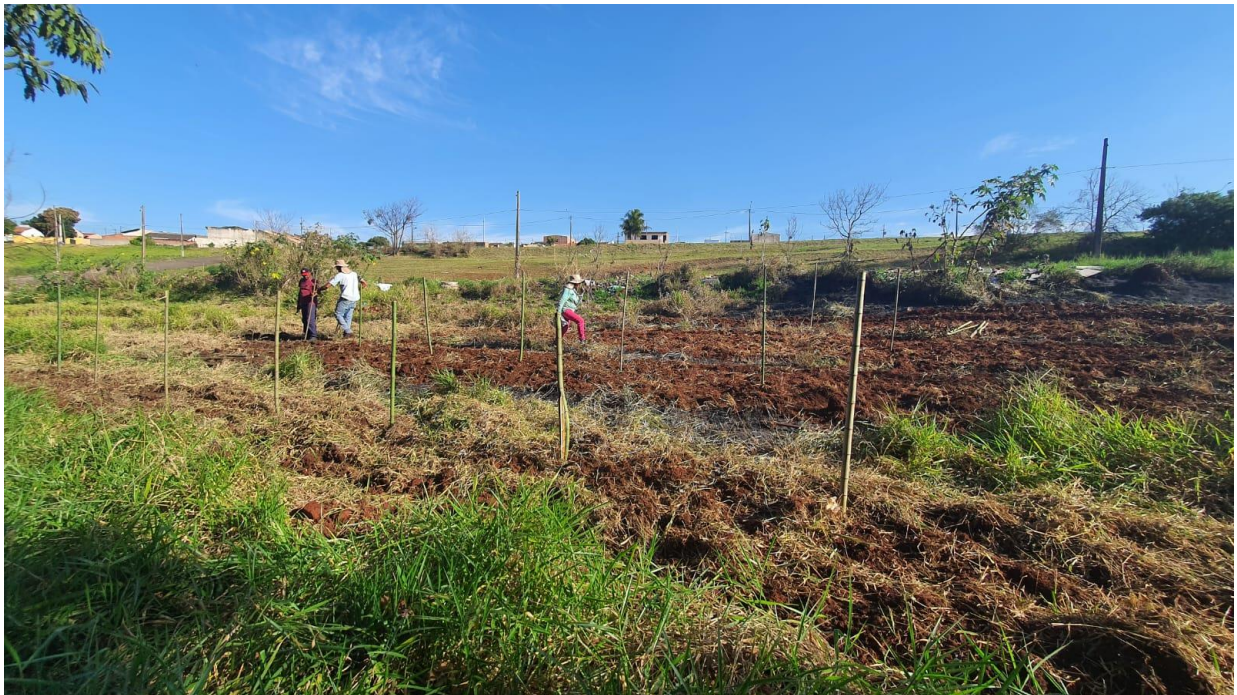
Figura 7 - Limpeza do terreno e preparo da terra.