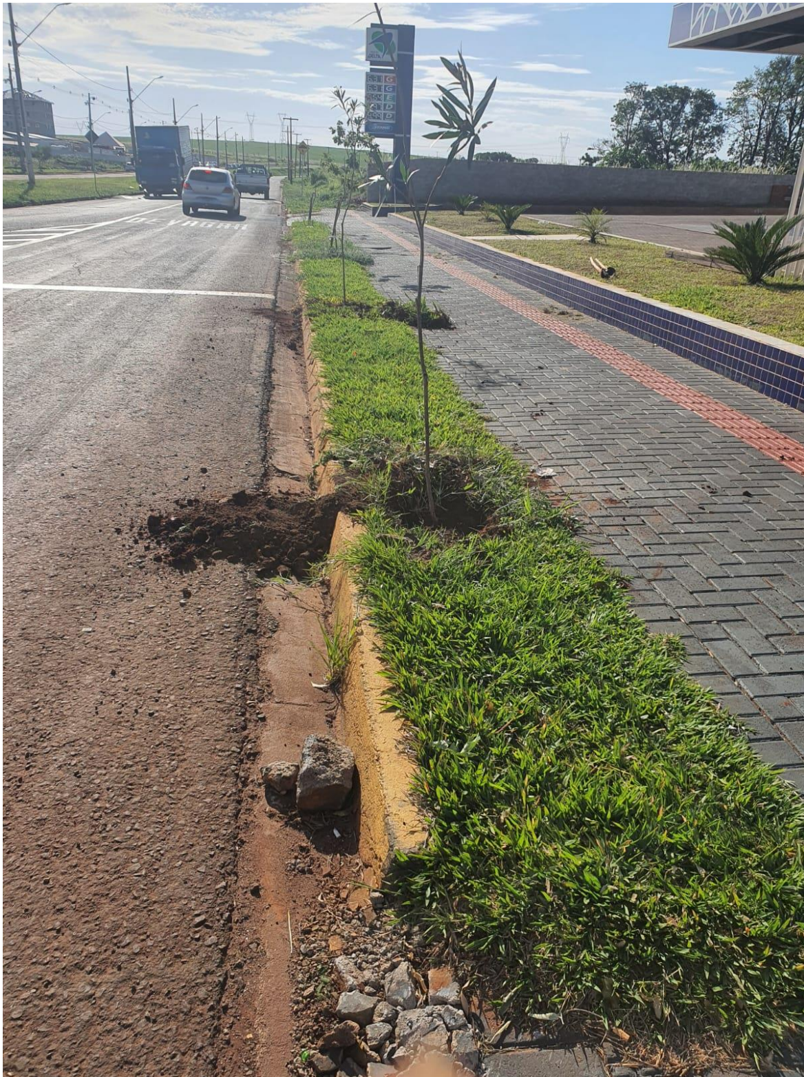
Figura 15 - Mudas plantadas na Av. Saul Elkind.