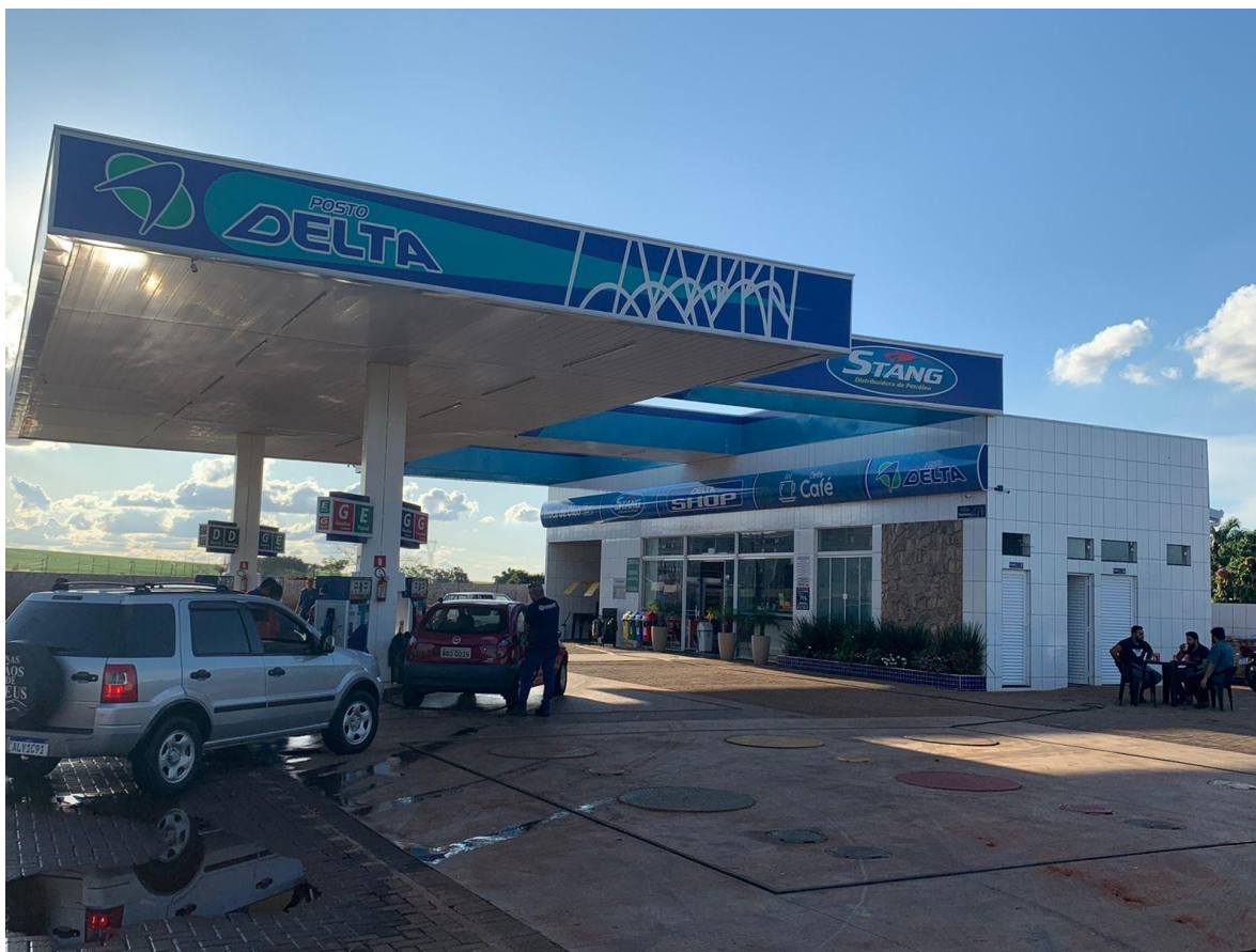
Figura 1 - Imagem do Estabelecimento.