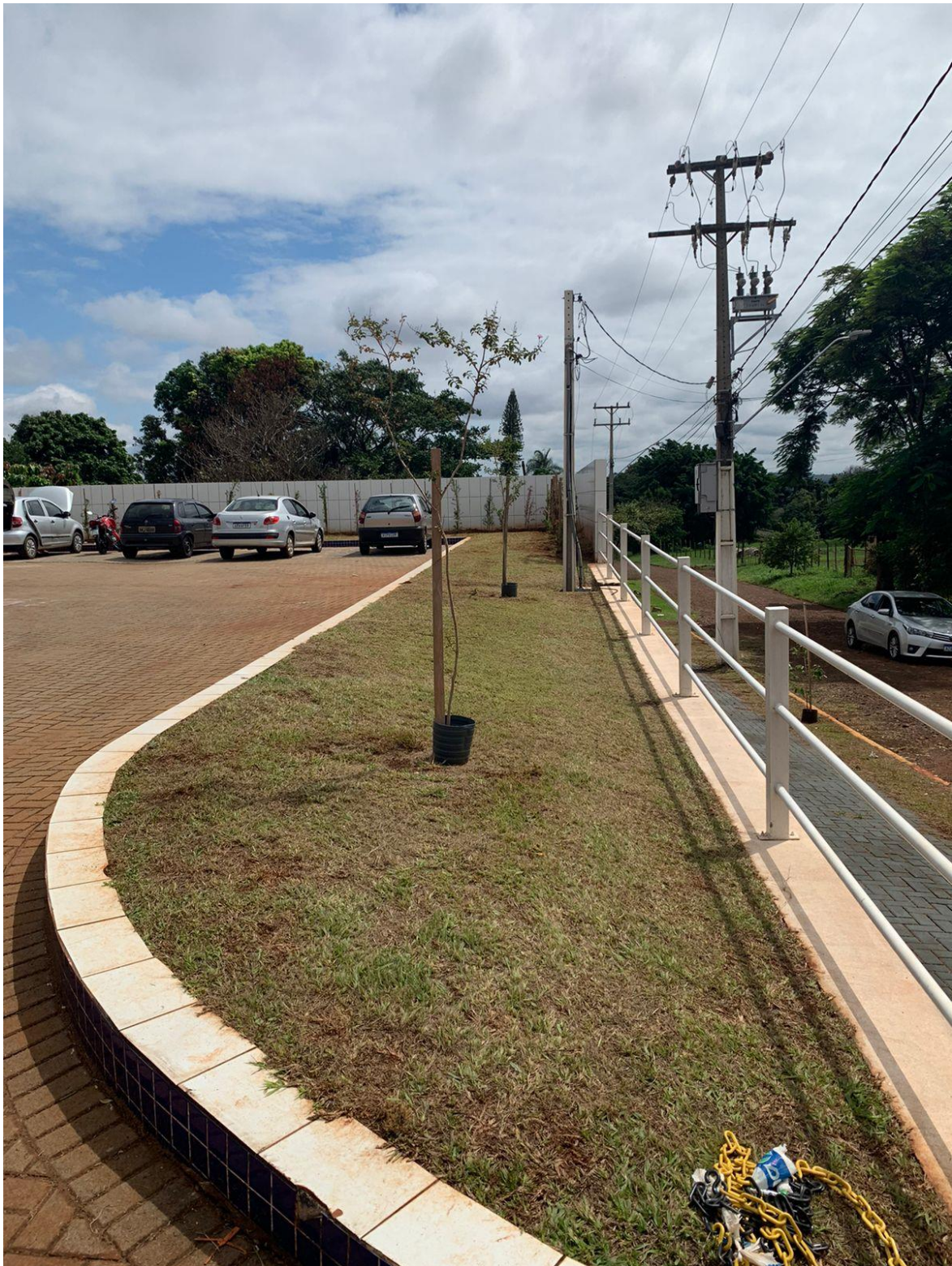
Figura 18 - Árvores plantadas no canteiro lateral do empreendimento.

Essas árvores estão sendo cuidadas e mantidas pelos responsáveis do posto.