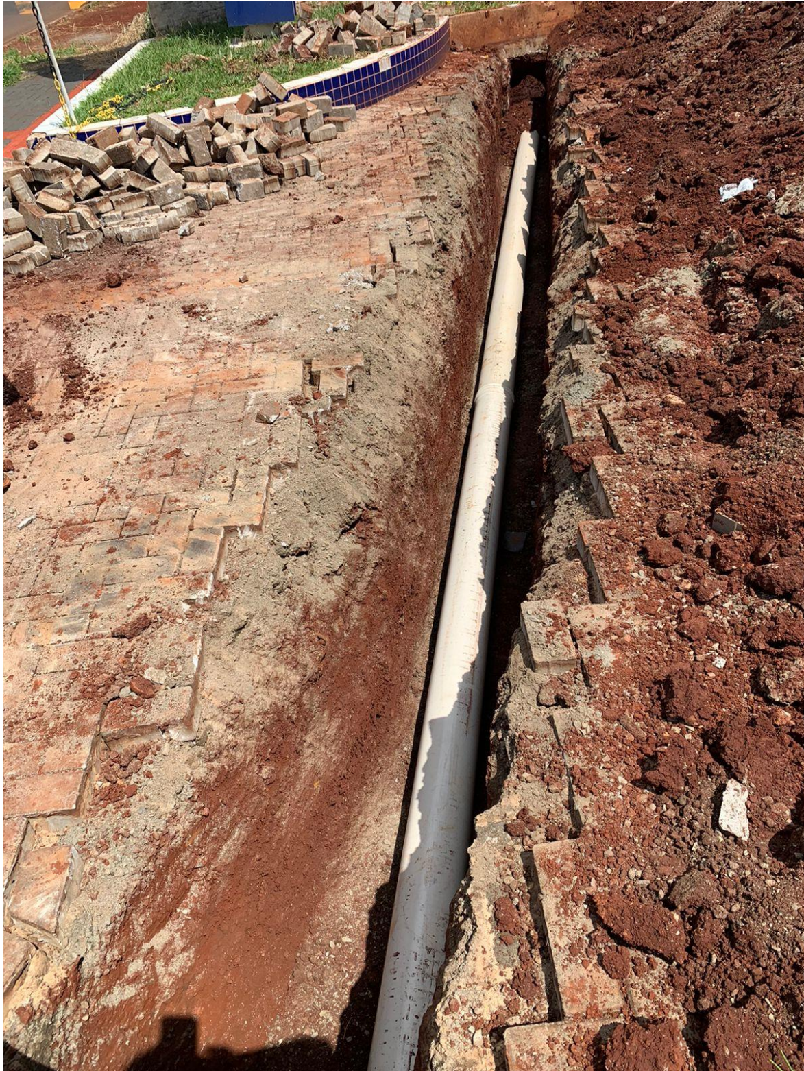
Figura 32 - Tubo de condução da água excedente da cisterna.