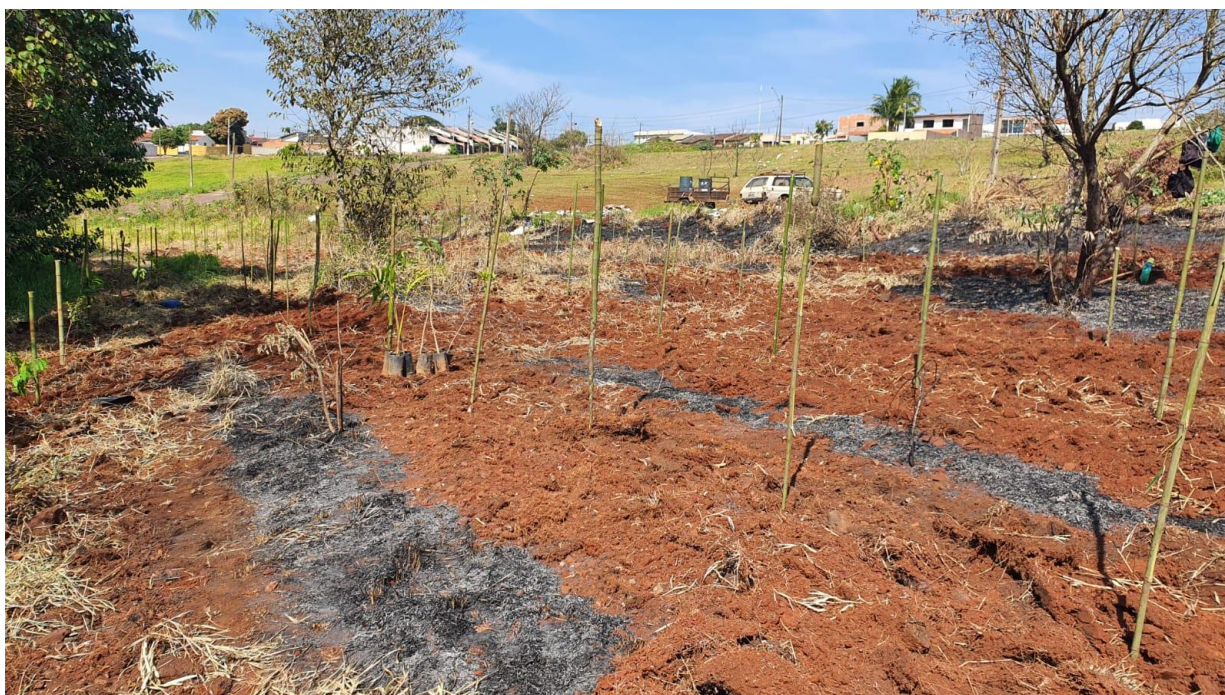
Figura 5 - Limpeza do terreno e preparo da terra.

Para realização do replantio das 800 mudas, a empresa contratou uma equipe especializada para executar a limpeza do local e o preparo da terra, também em conversa com o fiscal, nos comprometemos em plantar as mudas indicadas pela SEMA, mudas de maior porte e com grande parte delas sendo frutíferas.