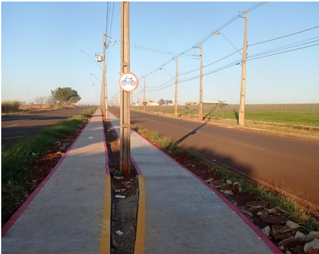
Figura 23 – Etapa 4 – Pintura e instalação das placas.