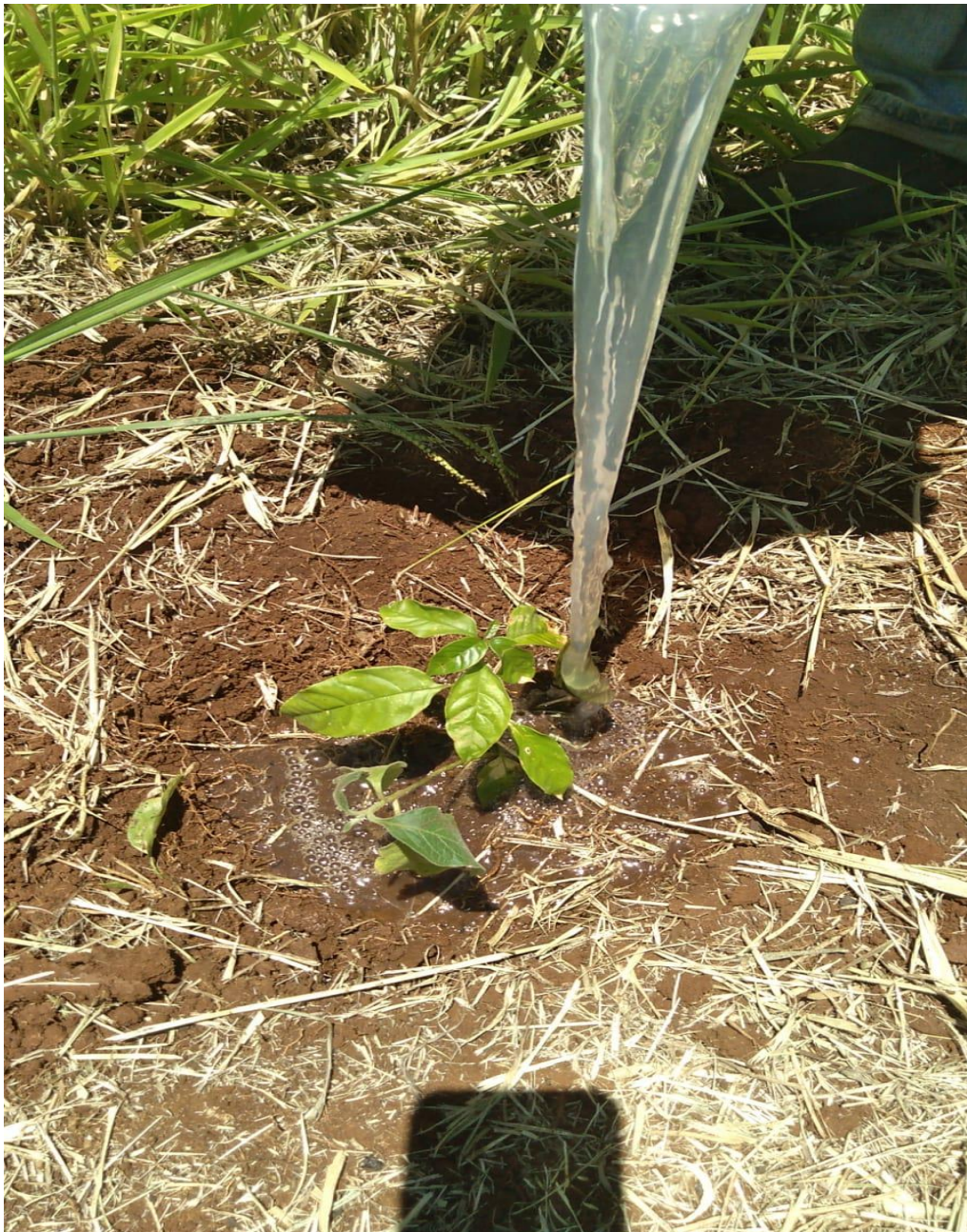
Figura 11 - Irrigação das mudas.