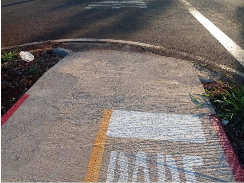
Figura 20 – Etapa 4 – Pintura da ciclovia.