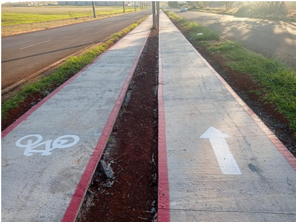
Figura 21 – Etapa 4 – Pintura da ciclovia.