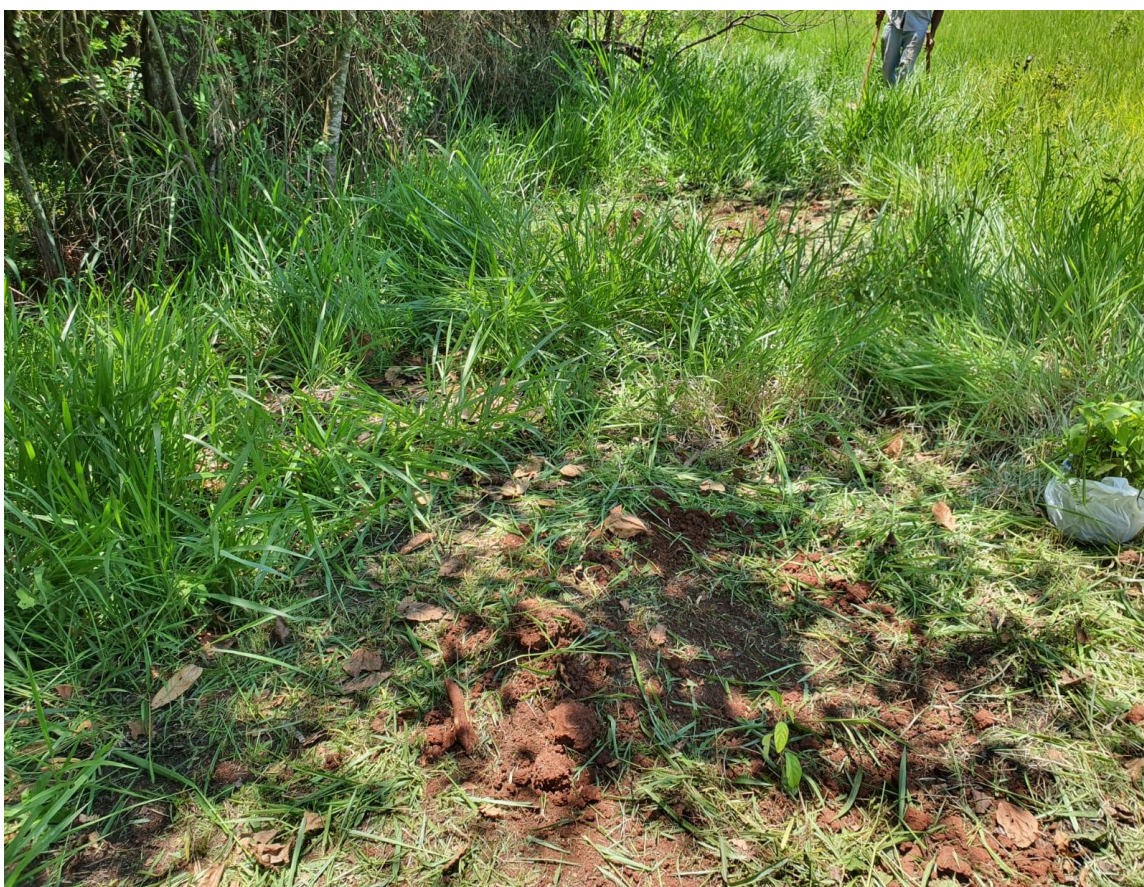
Figura 7 - Limpeza do terreno e preparo da terra.