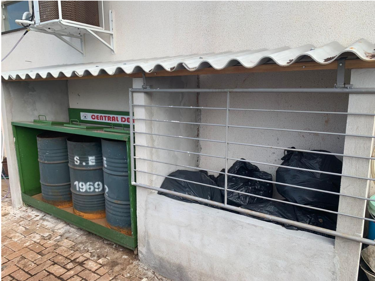
Figura 26 - Armazenamento de lixo, executada através da conveniência.