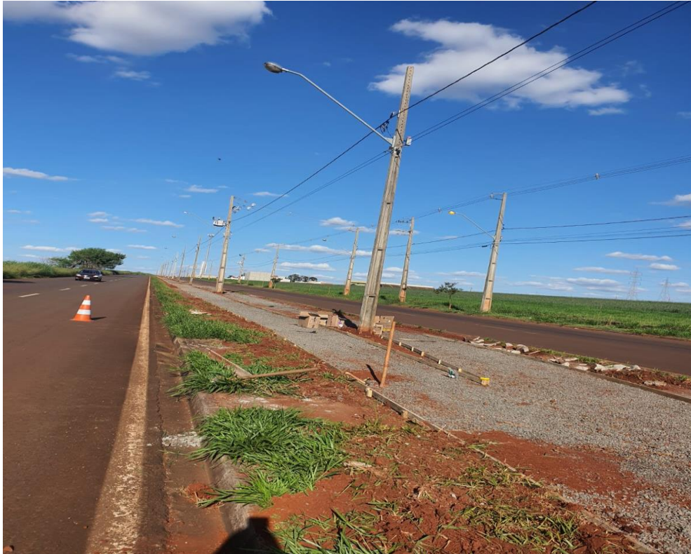
Figura 16 – Etapa 2 – Nivelamento do solo e camada de brita.