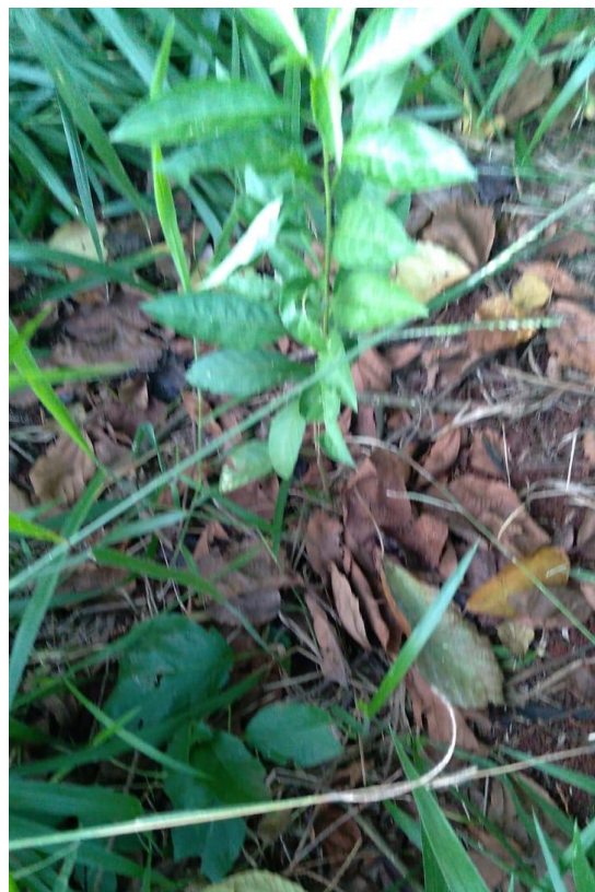
Figura 12 - Mudras já plantadas.