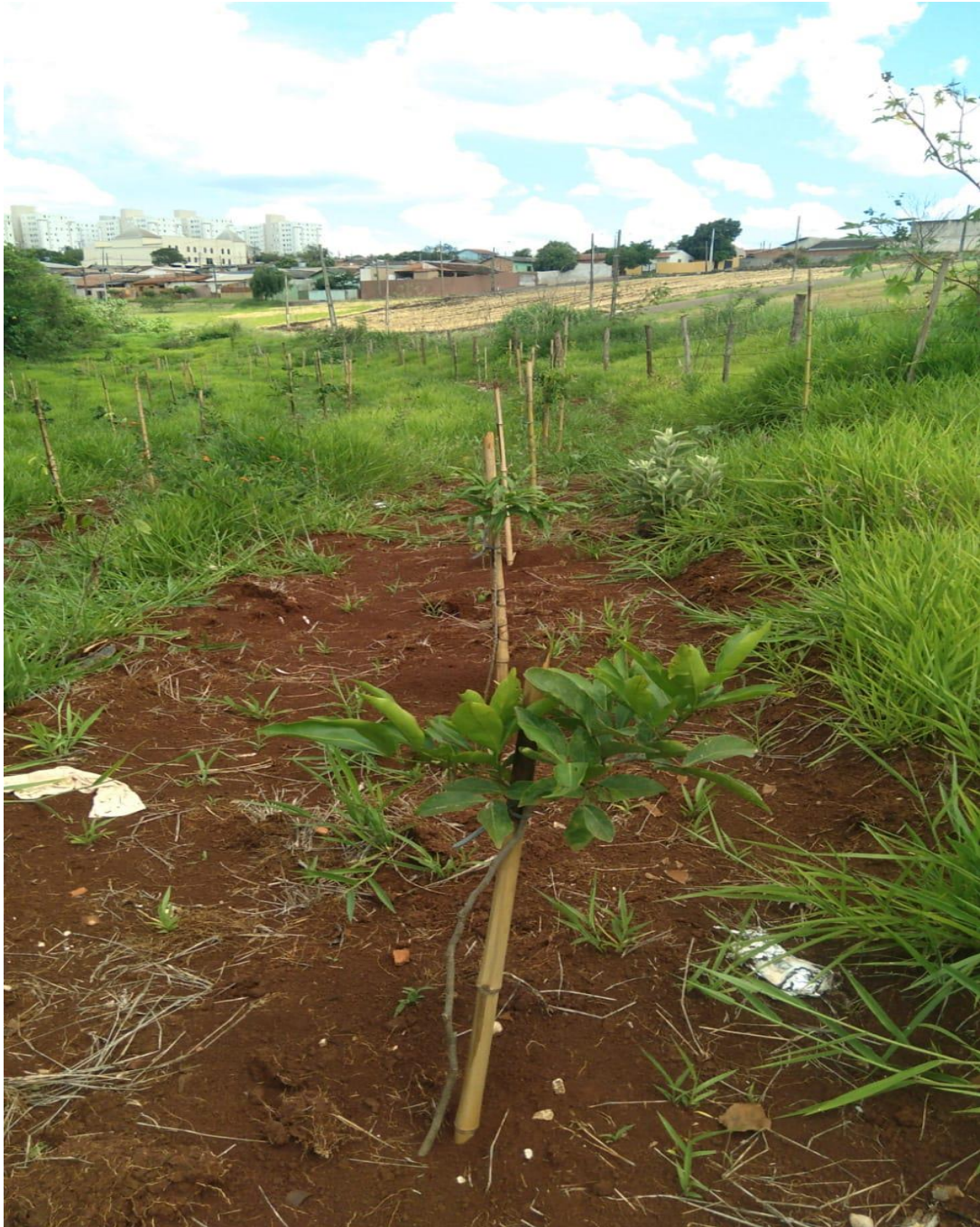
Figura 9 - Mudas já plantadas.