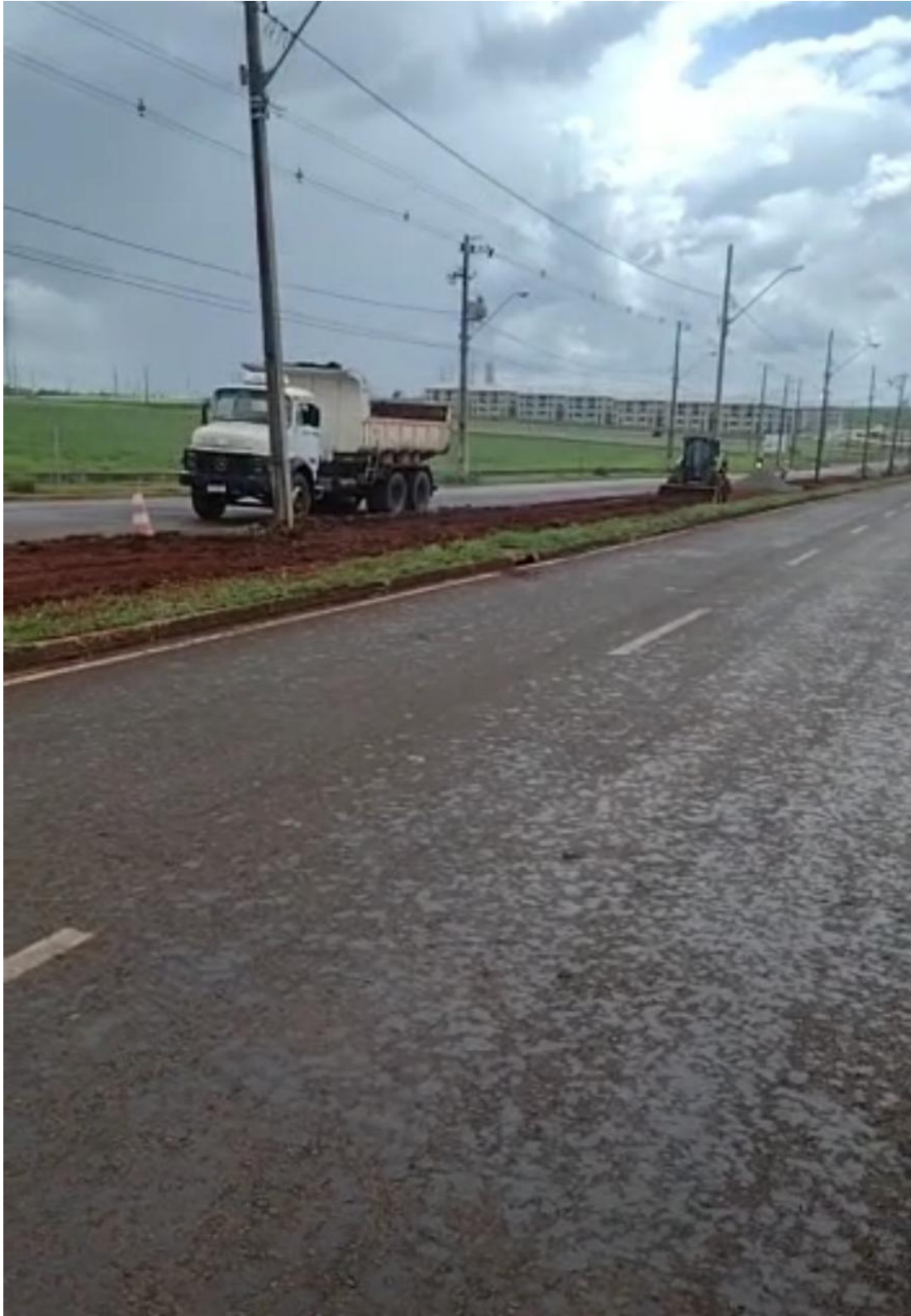
Figura 15 – Etapa 1 – Remoção da vegetação e preparação do solo.