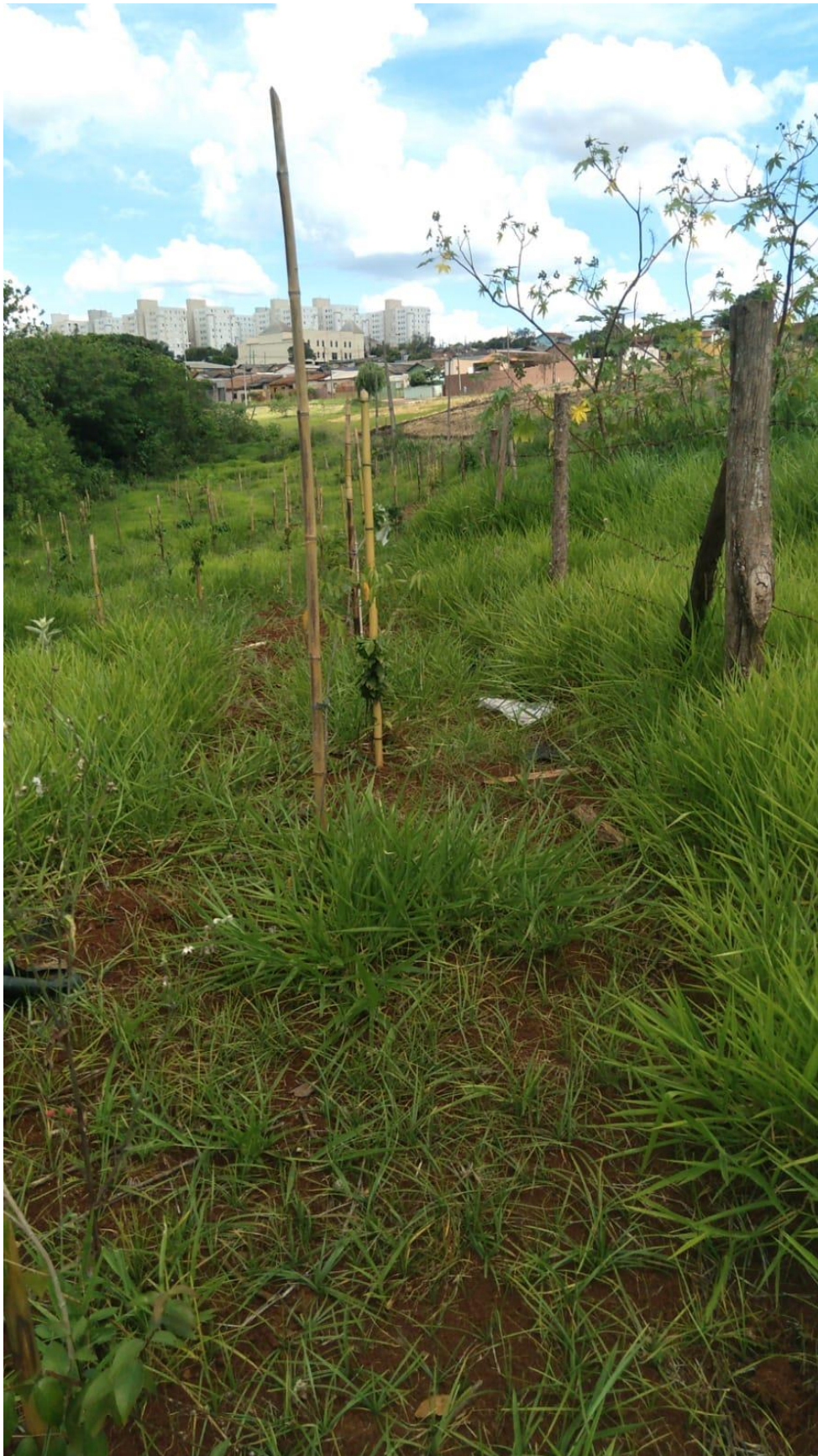
Figura 13 - Mudas já plantadas.