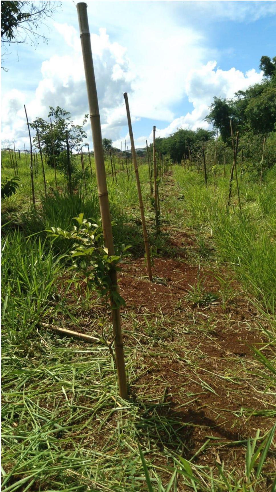
Figura 14 - Mudas já plantadas.