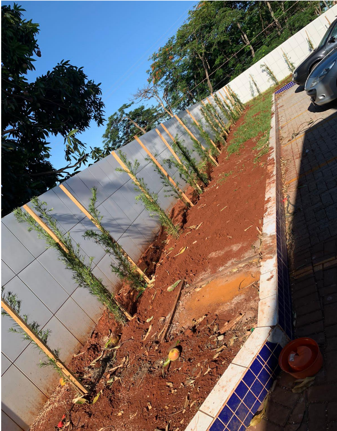
Figura 22 - "Barreira Vegetal" nos fundos do terreno.