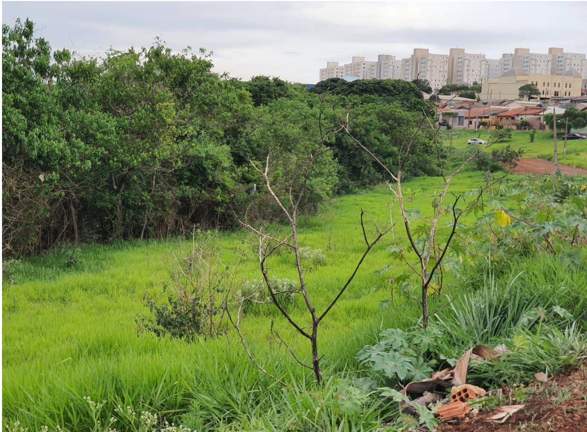
Figura 4 - Foto do local antes do plantio.