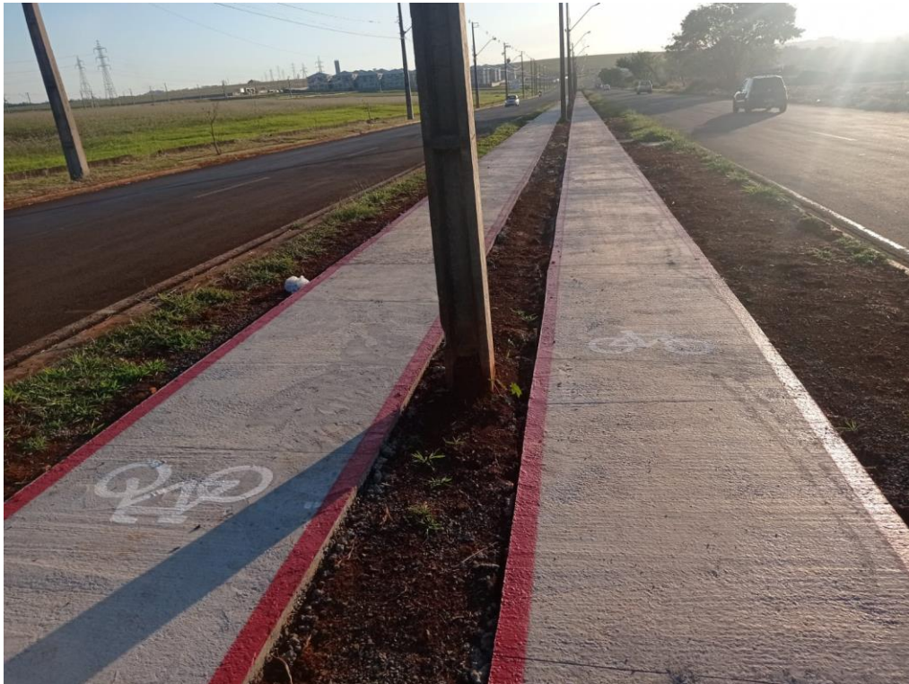
Figura 19 – Etapa 4 – Pintura da ciclovia.