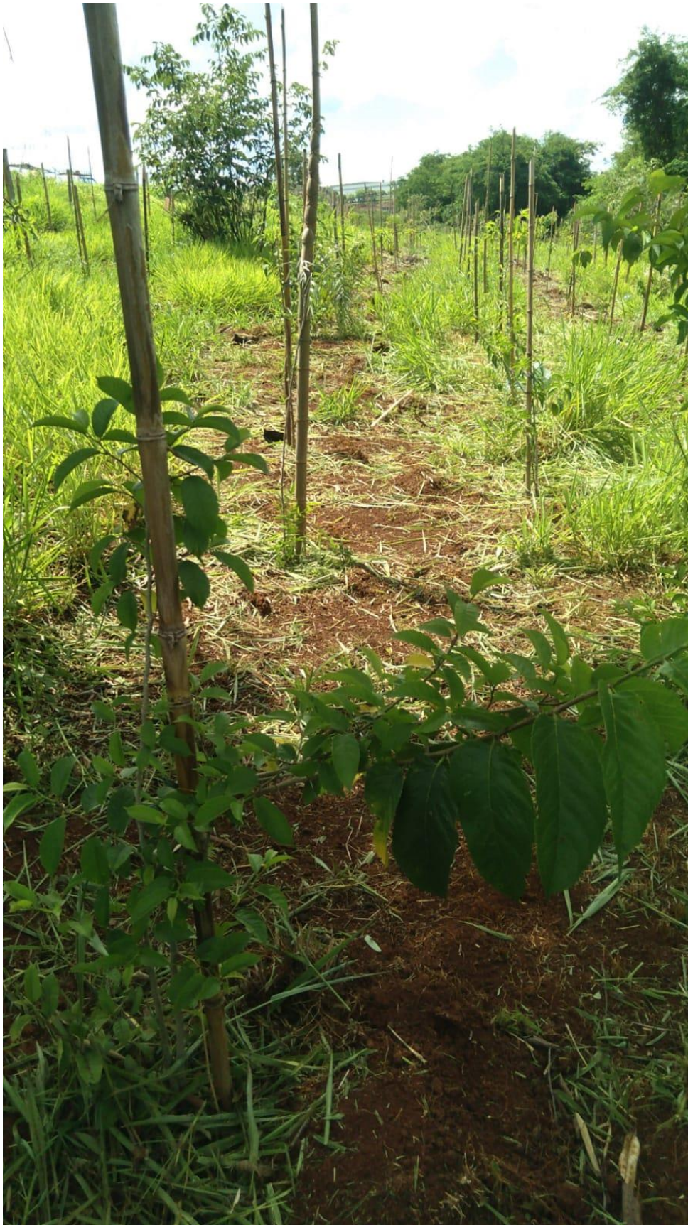
Figura 12 – Mudas já plantadas.