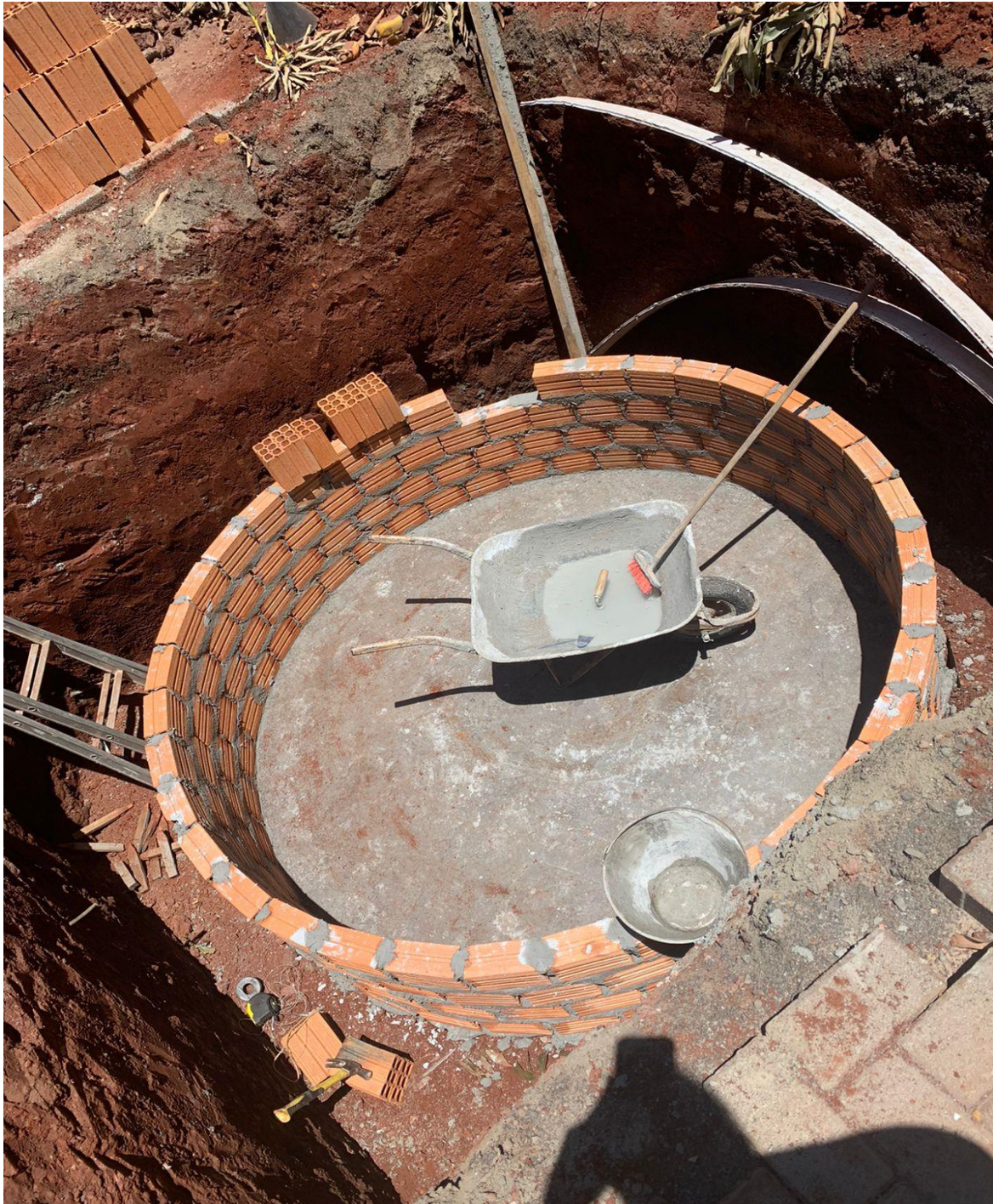
Figura 27 - Execução da cisterna.