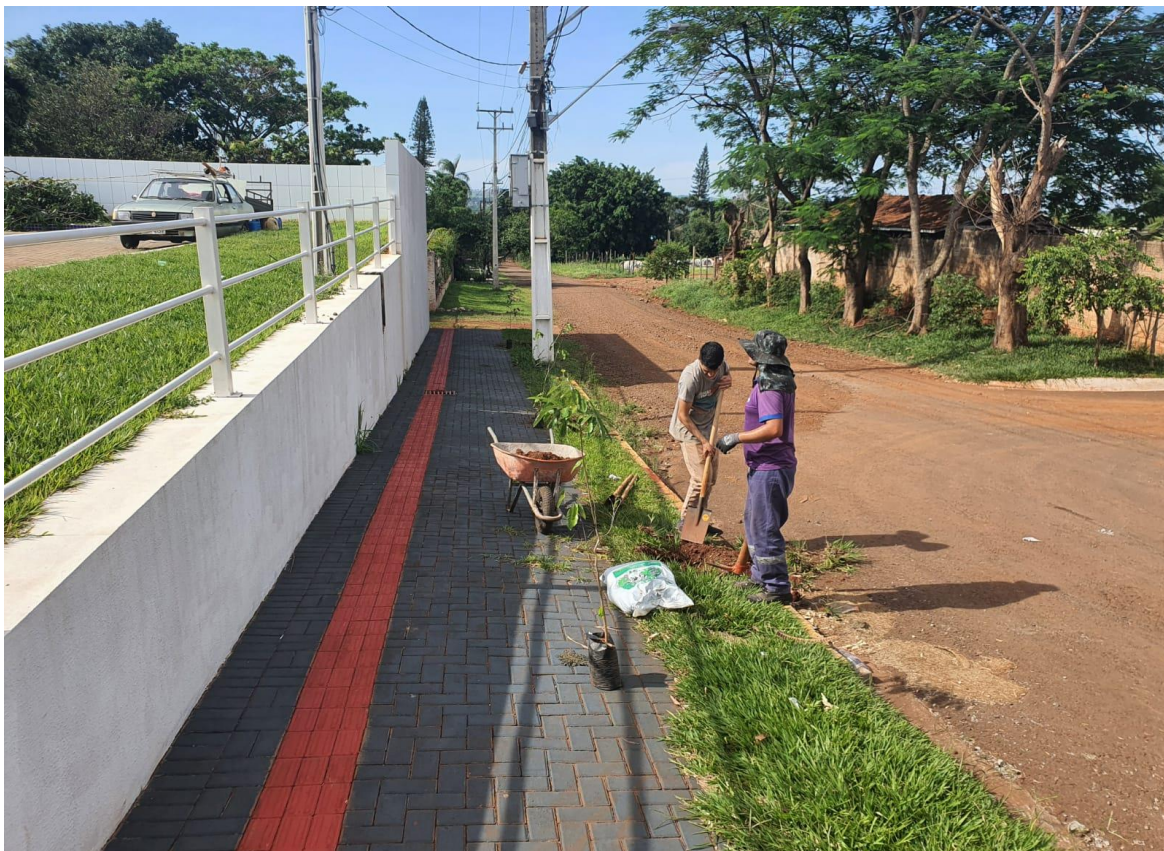
Figura 17 - Mudras plantadas na Rua Rosa Golin Milhorini.