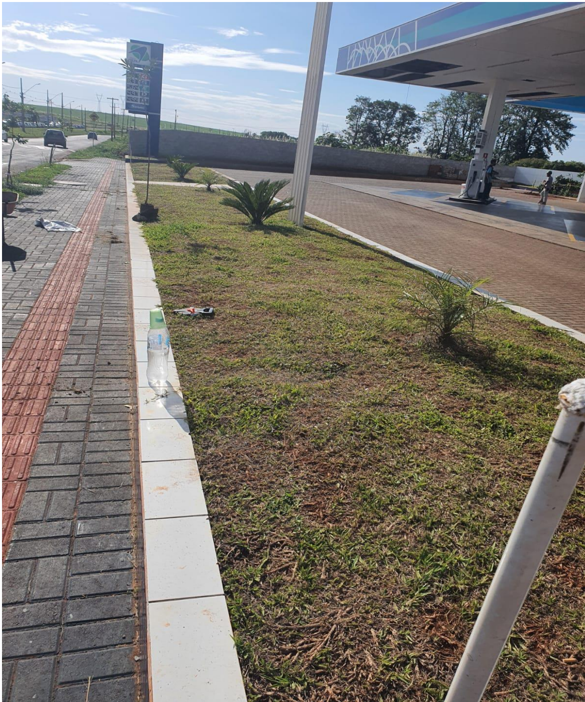
Figura 20 - Canteiros com vegetação.