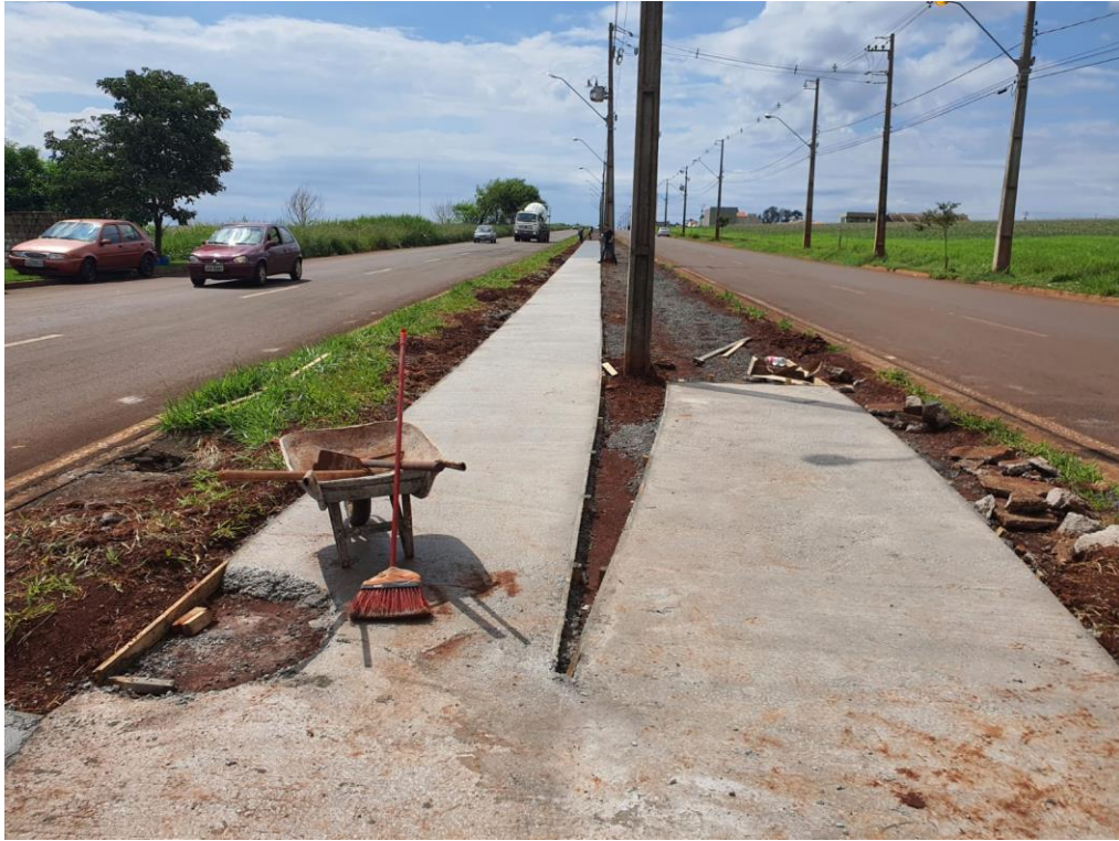
Figura 18 – Etapa 3 – Concretagem da ciclovia.