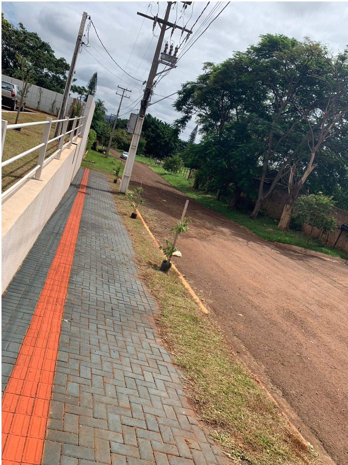
Figura 31 - Rua Rosa Golin Milhorini.

também por um sistema de calhas que leva até a cisterna, conforme projeto em anexo.