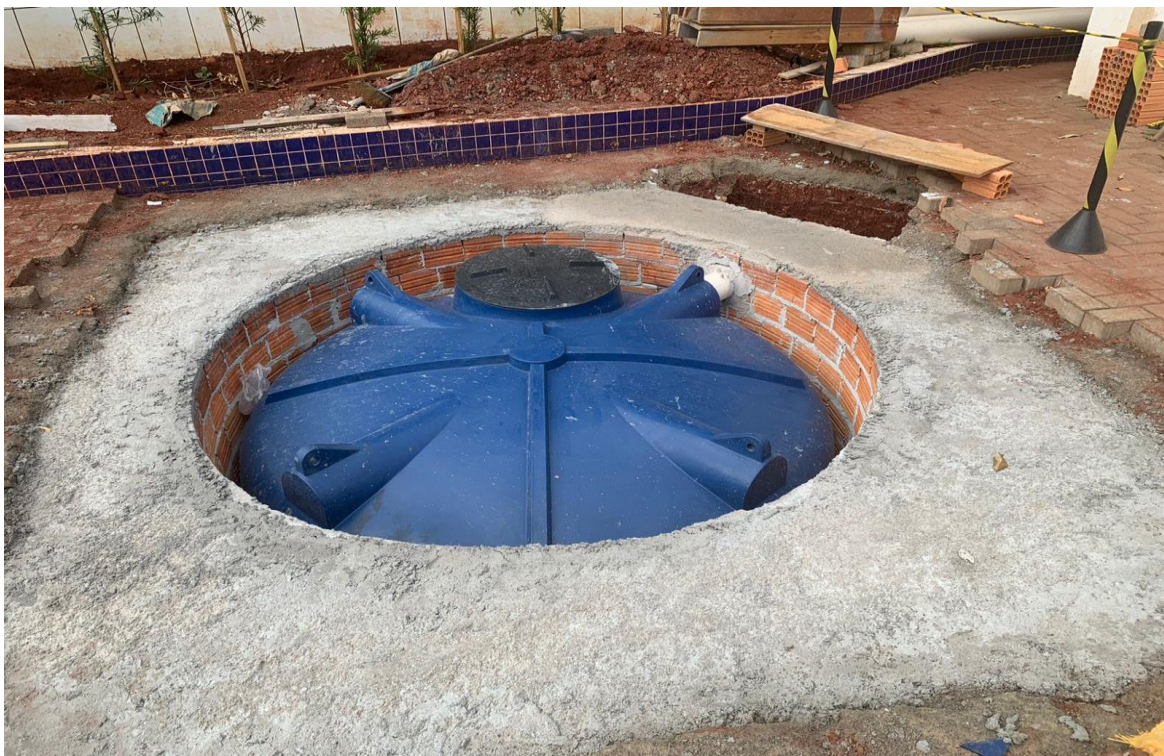
Figura 28 - Execução da cisterna.