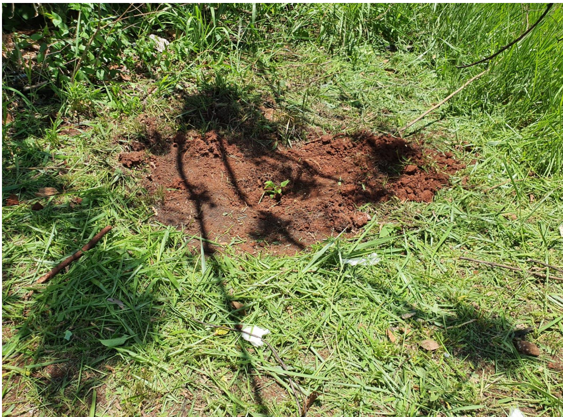
Figura 6 - Limpeza do terreno e preparo da terra.