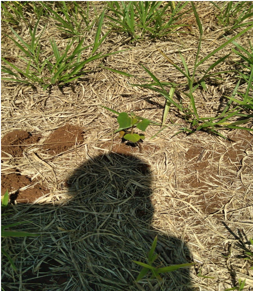
Figura 10 - Mudas já plantadas.