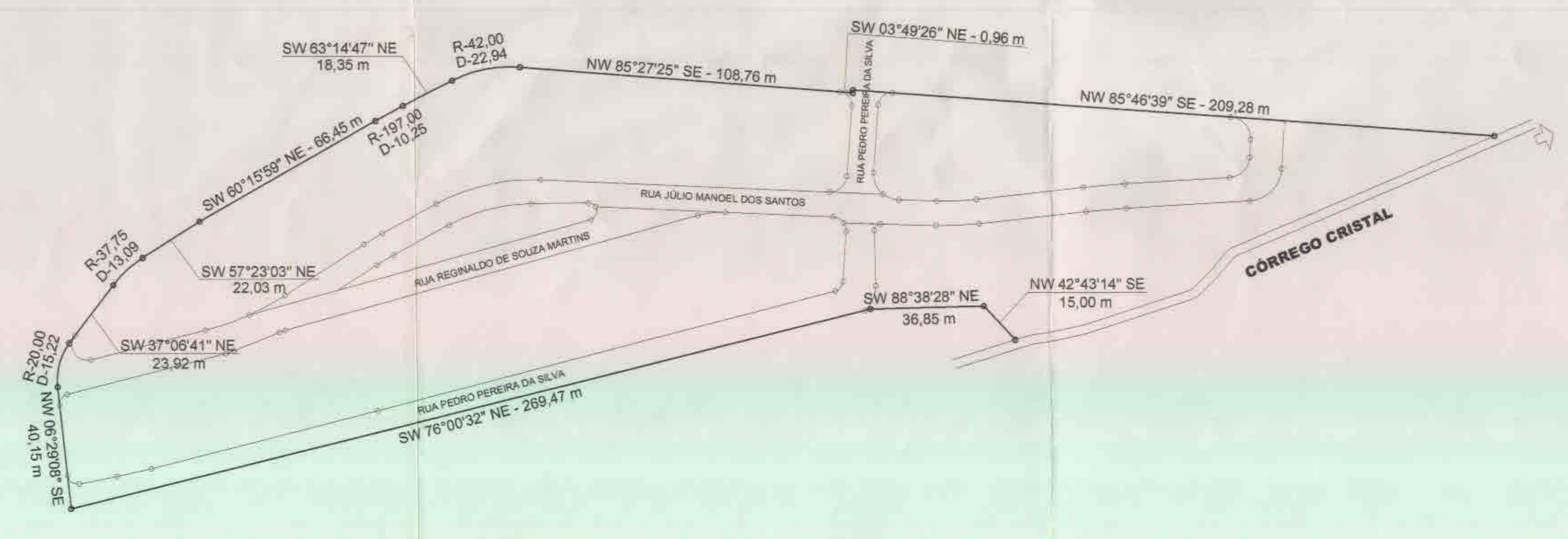
SISTEMA DE CÁLCULO DAS RUAS SEM ESCALA