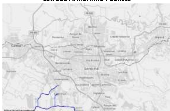
Figura 111: Visão geral: Rua Joaquim Barbosa / Estrada Armarinho Paulista