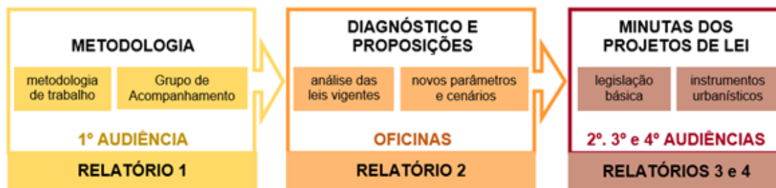
Figura 1 - Fases do trabalho de Revisão das Leis Específicas do PDML