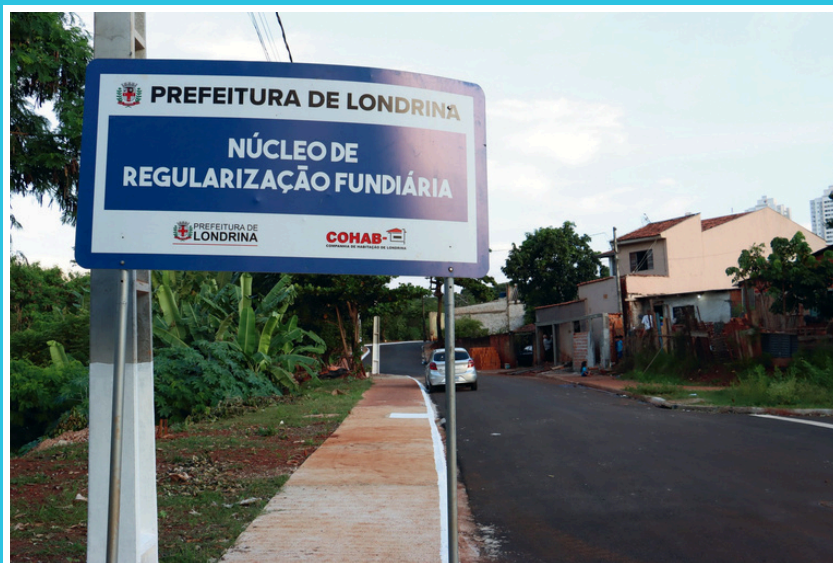
Placa indicando obras de Regularização Fundiária - Londrina Imagens –Vivian Honorato.N.COM. - Londrina

A REURB-S aplica-se aos núcleos urbanos informais ocupados predominantemente por população de baixa renda, assim declarados em ato do Poder Executivo municipal.