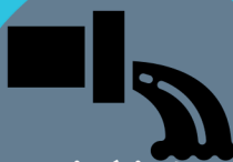
Emissário de esgoto