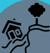
Risco de desabamento

Locais que colocam em risco às pessoas e o meio ambiente não podem passar por Regularização Fundiária.