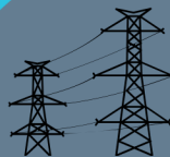
Linha de transmissão