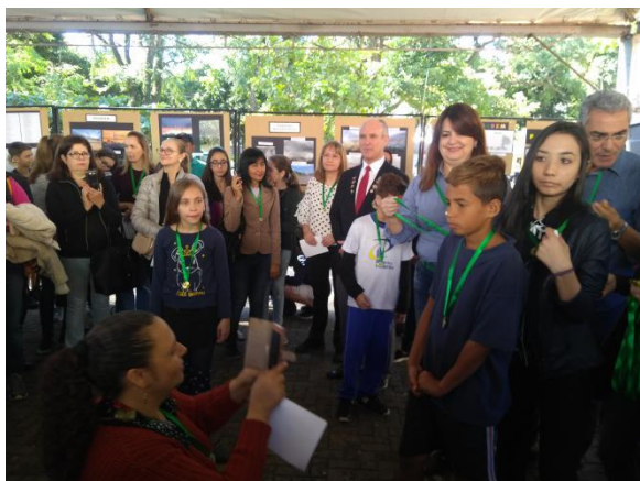
Expoambiental - Calçadão