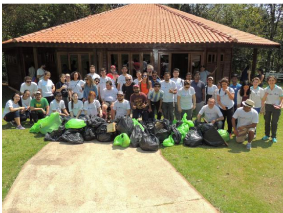
Evento no Parque Arthur Thomas Empresa Tata