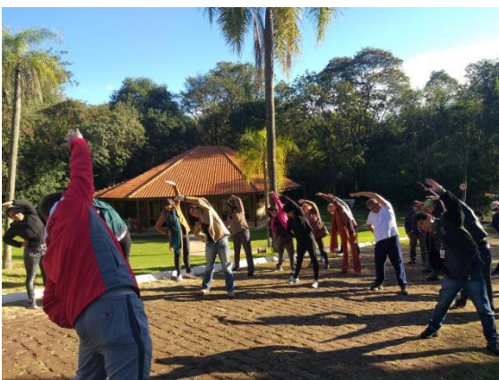
Programa Preparação Aposentadoria - Parque Arthur Thomas