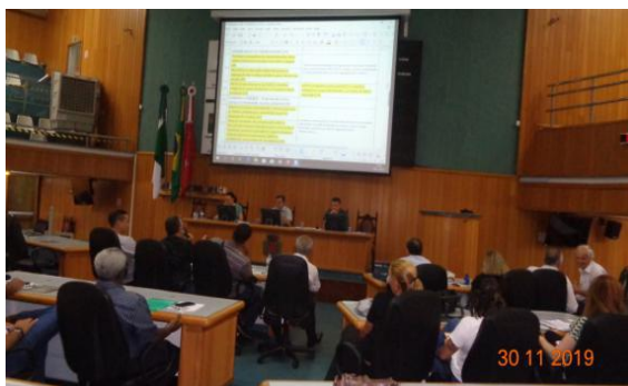
X Conferência do Meio Ambiente