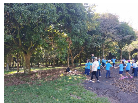
Semana Meio Ambiente - Parque Arthur Thomas