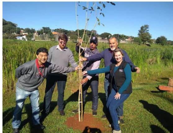
Plantio de árvore - Lago Norte