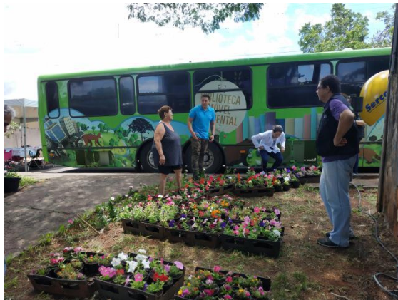
Mutirão nos bairros