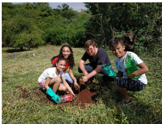
Dia do Rio - Córrego Carambei