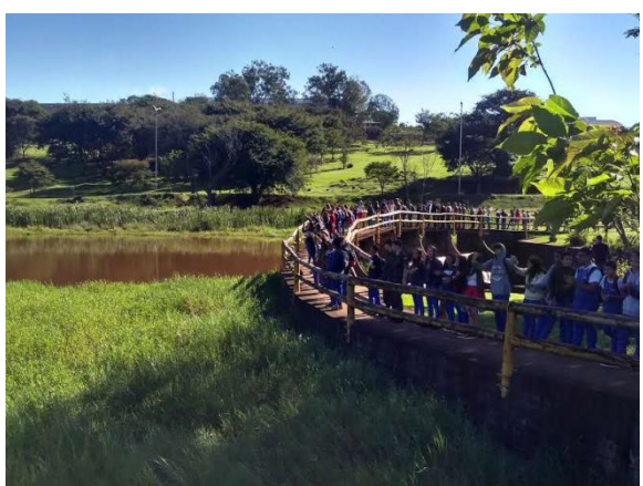
Abraço no Lago Norte