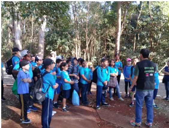
Descobrimo o Parque