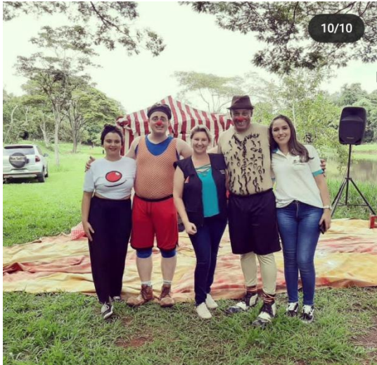
Apresentação cultural - Parque Arthur Thomas