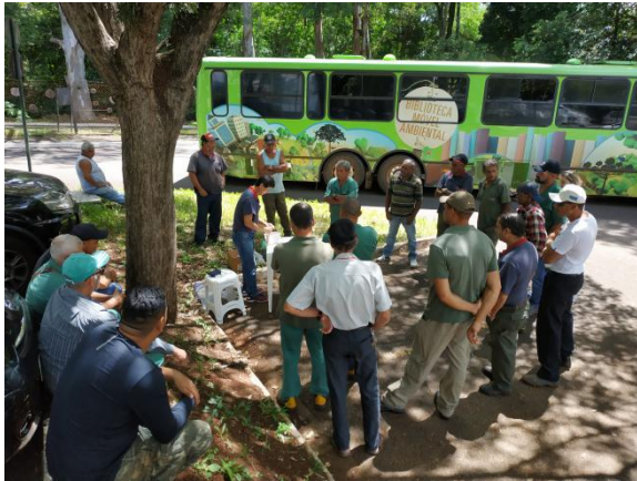
Dia da Água - servidores SEMA/SMAA