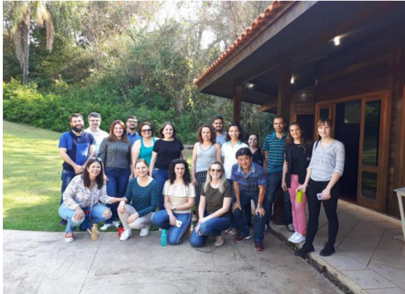
Diálogos no Parque