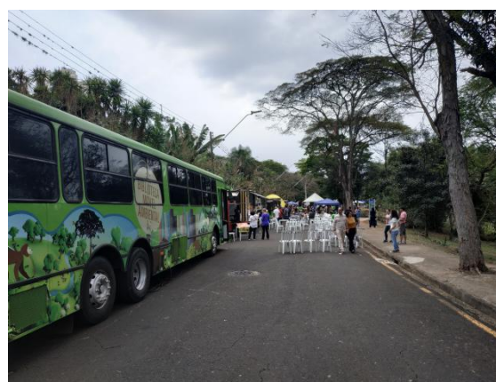
Evento no Vale do Rubi