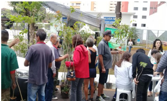
Dia Mundial Sem Carro - Av. Higienópolis