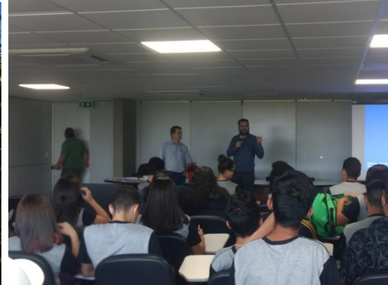
Proverde - apresentação resultado dos projetos