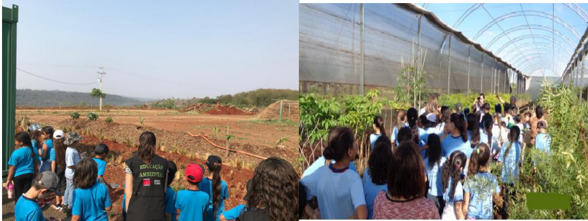
Cultivando o Verde