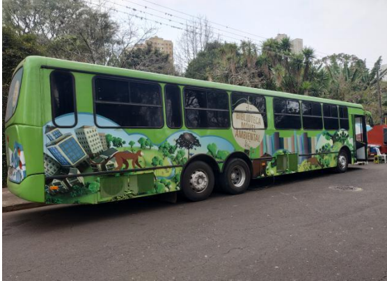
Biblioteca Móvel Ambiental