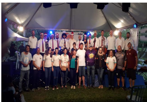
Naturação - Parque Arthur Thomas