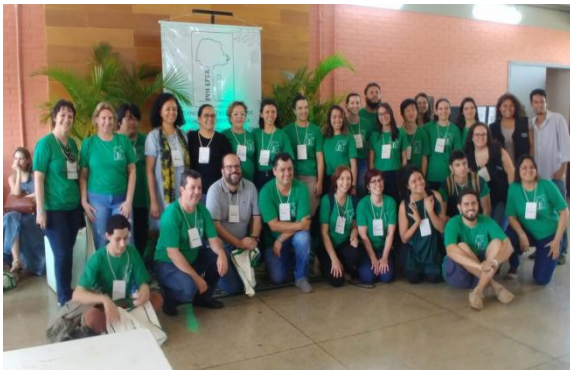
XVII EPEA - Encontro Paranaense Ed. ambiental