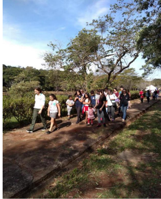
Um dia no Parque