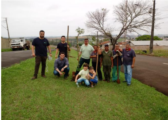
Dia da Árvore