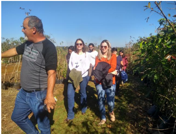
Servidores no Viveiro