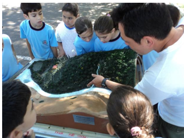
Crianças e a maquete interativa