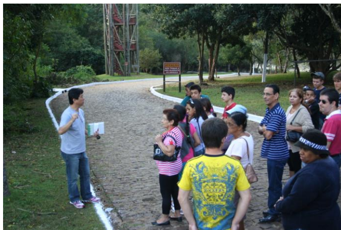
Monitor e pessoas atendidas pelo projeto Descobrindo o Parque

Metodologia: durante a caminhada pela trilha são abordados assuntos sobre o relevo, formação e constituição de vales, bacias hidrográficas, formação dos solos, poluição, fauna regional e local, flora local e condições climáticas da região, bem como sobre o histórico do parque visitado, seu contexto na história de Londrina e preservação de patrimônios públicos. Os temas são expostos de maneira interativa, buscando associações com o cotidiano e o local em que moram.