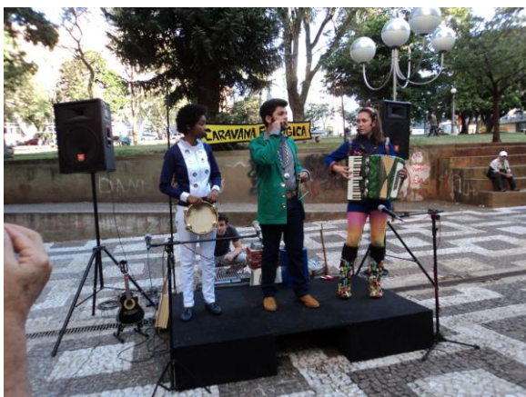
Apresentação da Caravana Ecológica

Participação e organização da “Semana do Meio Ambiente”, com atividades no Calçadão, como por exemplo: distribuição de mudas nativas e ornamentais, Biblioteca Móvel e apresentação da Caravana Ecológica. Houve também a participação da Biblioteca Móvel e da Caravana Ecológica no Aterro do Lago Igapó 2.