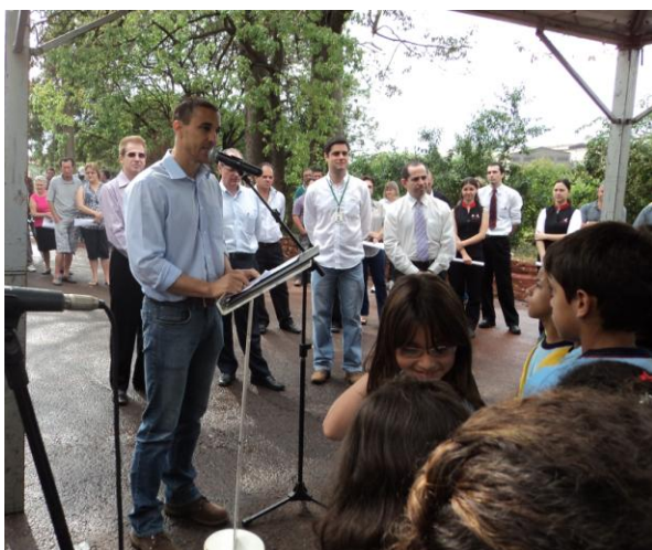
Prefeito Barbosa Neto

Houve também a participação de alunos da E. M. Américo Sabino Coimbra que ajudaram no plantio de algumas árvores no fundo de vale, além de diversas empresas, autoridades e associações de moradores.