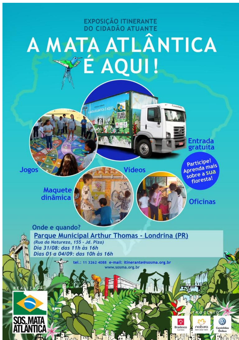
Cartaz da exposição "A Mata Atlântica é Aqui" Londrina/PR