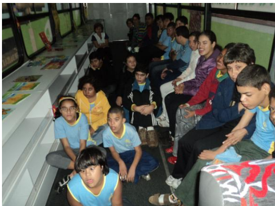
Crianças atendidas pela biblioteca nas escolas

Metodologia: a Biblioteca Móvel Ambiental dispõe de recursos educativos como materiais impressos, audiovisual, fantoches, promovendo o acesso de forma lúdica do público com o meio ambiente.