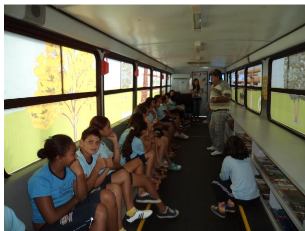
Palestra Dia do Rio na Biblioteca Móvel com os alunos da E.M. Américo Sabino Coimbra