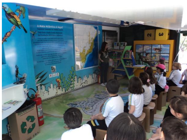
Crianças participando da exposição