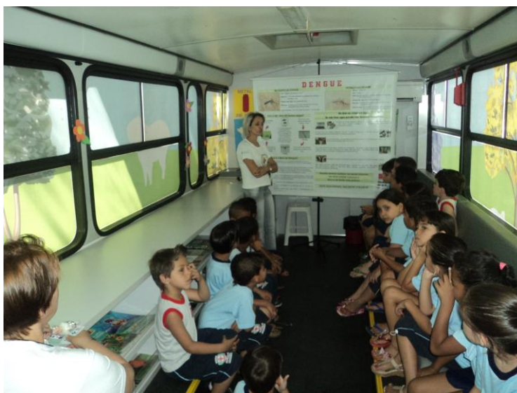
Palestra sobre o combate a Dengue