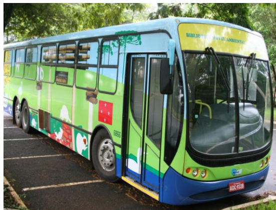
Ônibus da Biblioteca Móvel Ambiental

Atividades: A Biblioteca Móvel Ambiental iniciou suas atividades, deste ano, em 02 de março, atendendo as escolas urbanas e rurais. O agendamento e atendimento foram realizados em diversas escolas e eventos, totalizando 9.814 pessoas, como mostra a tabela abaixo: