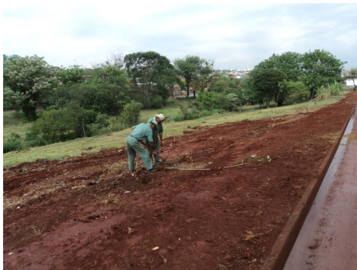
Área preparada para o plantio