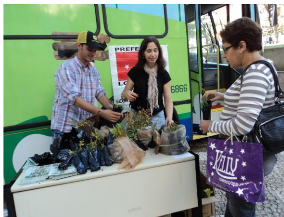
Distribuição de mudas no calçadão