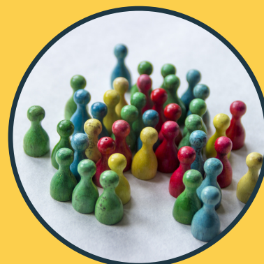
AVALIAÇÃO (MÉTODOS, INDICADORES)

No âmbito do SUAS o monitoramento é uma atividade que compõe a Vigilância Socioassistencial, por meio da qual procura-se levantar continuamente informações sobre o território e sobre os serviços ofertados à população , particularmente no que diz respeito a aspectos de sua qualidade e de sua adequação quanto ao tipo e volume da oferta. O monitoramento é fundamental para a identificação para subsidiar as estratégias de “correção dos rumos”.