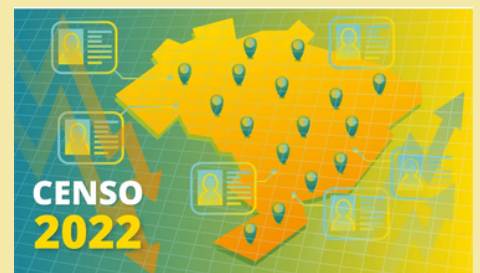
CENSO DEMOGRÁFICO (IBGE)