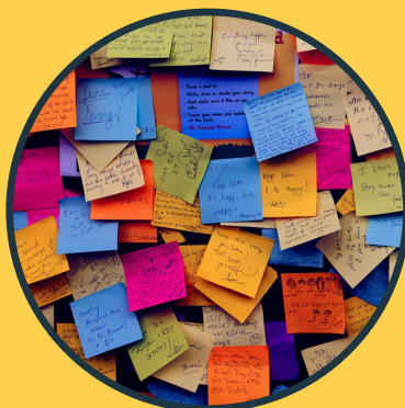
COLETA E ANÁLISE DE DADOS