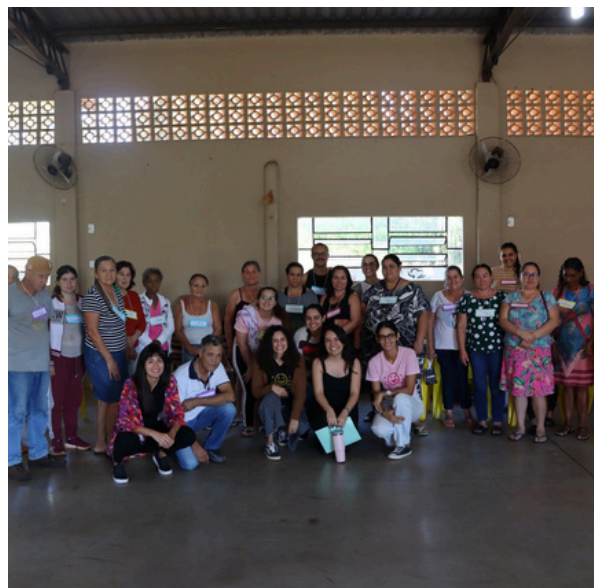
Foto: pré-conferência microterritorial Rural 2025

Esse avanço no conteúdo e na quantidade das proposições reflete o trabalho qualificado e constante das equipes da assistência social, que por meio de ações como escuta ativa, atividades coletivas e acompanhamento familiar, fortalecem o protagonismo dos usuários e incentivam sua participação crítica nos espaços deliberativos. Essa atuação cotidiana tem ampliado a consciência de direitos e contribuído para a elevação da qualidade das contribuições nas conferências.