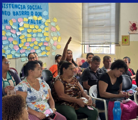
Foto: pré-conferência microterritorial Oeste B2025

O papel social das conferências é fundamental porque elas fortalecem a democracia. Ao permitir que todos tenham voz, ajudam a construir políticas mais justas, reais e próximas das necessidades da população. Além disso, funcionam como um diagnóstico vivo da realidade dos territórios, reunindo informações que os dados estatísticos muitas vezes não mostram: as experiências, os sentimentos, os desafios do dia a dia.