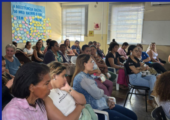
Foto: pré-conferência microterritorial Oeste B 2025

Dentre as propostas das pré-conferências de 2021 e 2023, destacam-se o reajuste dos benefícios eventuais, a ampliação da cobertura dos serviços de proteção básica, o fortalecimento do controle social, a ampliação das equipes técnicas nos CRAS, a melhoria da infraestrutura das unidades e o reforço da articulação intersetorial. Também surgiram novas pautas, como a inclusão digital dos usuários e o aumento da oferta de serviços voltados à população idosa. Muitas dessas propostas foram incorporadas à agenda municipal, resultando, por exemplo, no ajuste dos valores dos benefícios e na intensificação das ações de busca ativa em territórios com maior desproteção social.