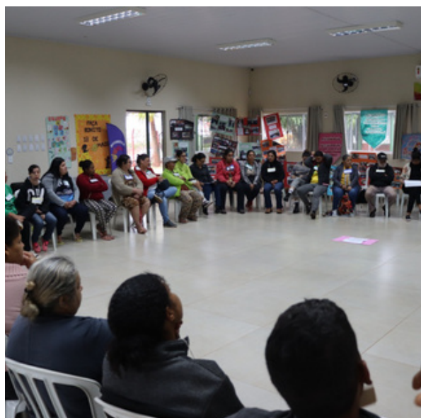
Foto: pré-conferência microterritorial Rural 2025

Agora, em 2025, a 16ª Conferência Municipal de Assistência Social já demonstra um novo salto de participação, com a realização de 39 pré-conferências — o maior número registrado até o momento. Esse crescimento contínuo reflete o fortalecimento dos espaços de escuta nos territórios, a ampliação do controle social e o compromisso do município com uma gestão democrática e participativa da assistência social.