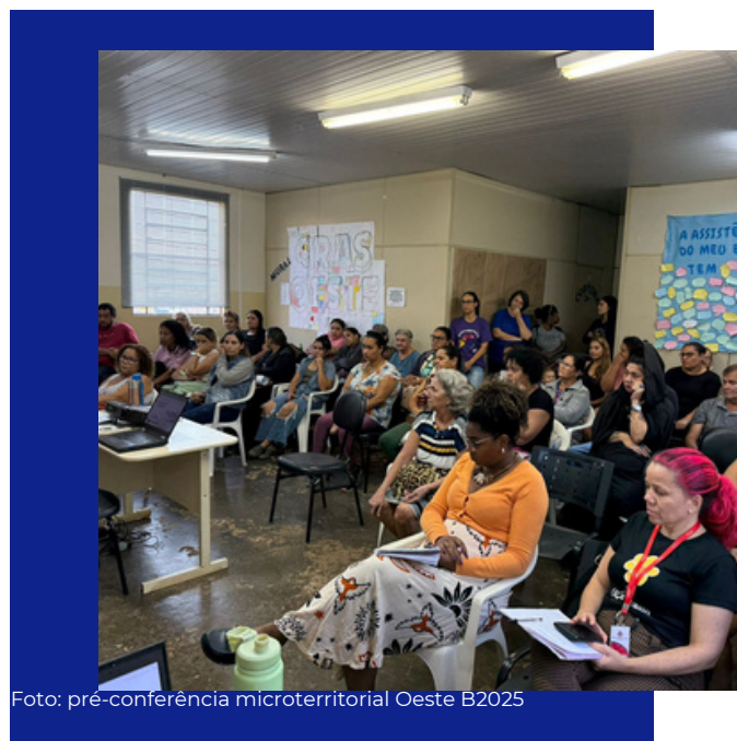
Foto: pré-conferência microterritorial Oeste B2025

Participe! Sua voz importa e faz a diferença!