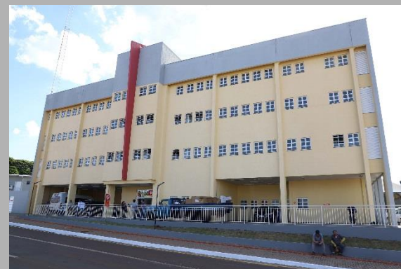
Décimo Quinto E Décimo Sexto Termos Aditivos Ao Contrato Reforma e Ampliação do SAMU