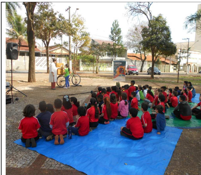
ECOH – Padre Adelino – 25/08/2025