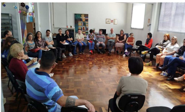
- Encontro do Sistema Estadual de Bibliotecas – 24/10/202