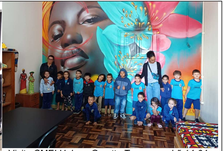
Visita CMEI Helena Ometto Torres manhã 14-04-2025