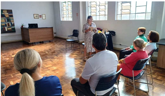
Bem estar no centro histórico – 05/09/2025