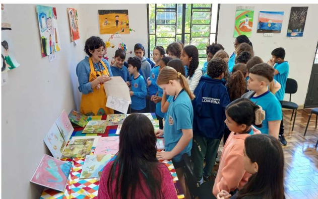
Semana de Nishinomiya – Contação de histórias: “A Lenda do pássaro de Hyoko”,