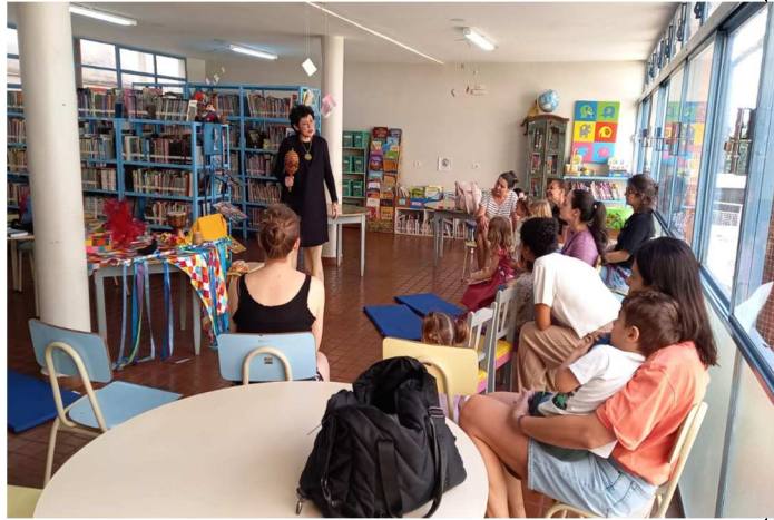
Quartas criativas – 03/09/2025