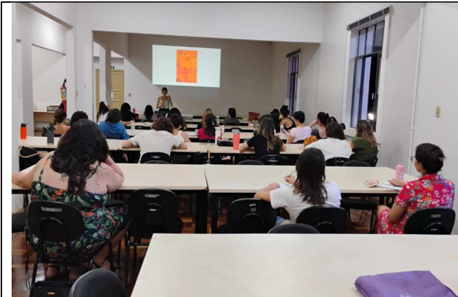
Oficina Escrita e Cura – 19/02/2025