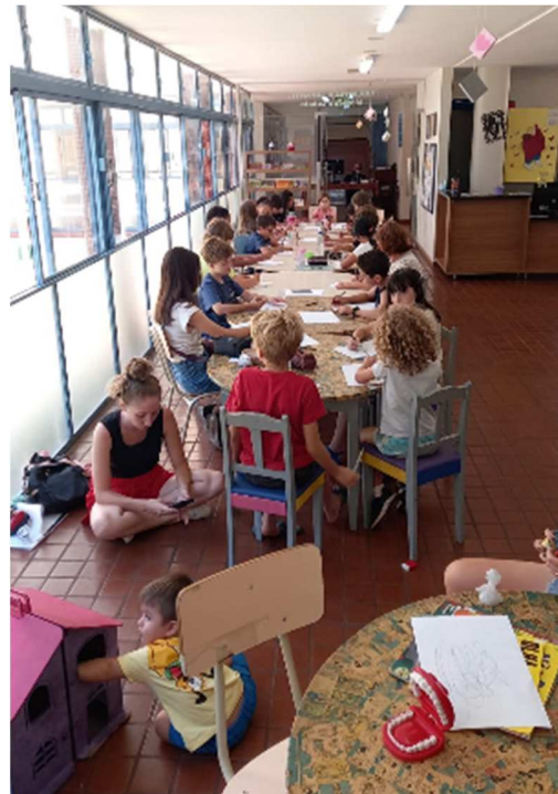
Férias nas Bibliotecas – Biblioteca Infantil – 01/2025