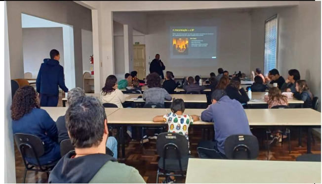
Oficina de RPG - 09/08/2025