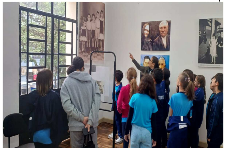
Visita E. M. Bartolomeu Gusmão – 23/06/2025