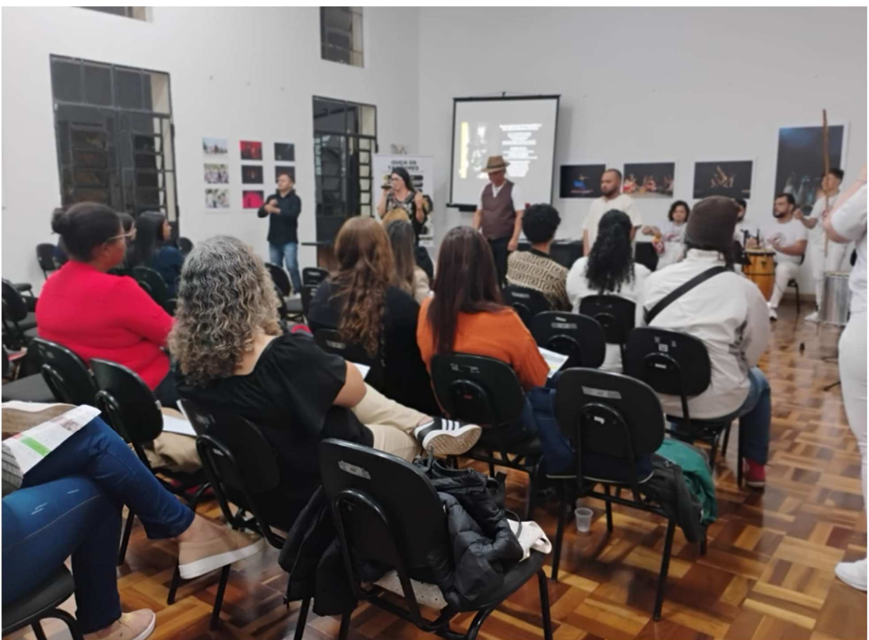
Palestra Ouça os tambores - 13/08/2025