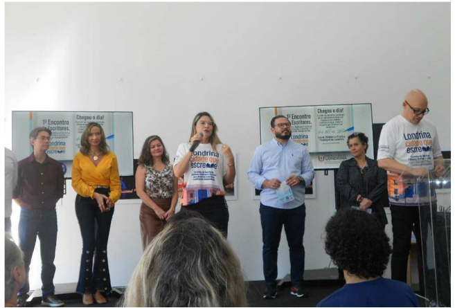
1º Encontro de Escritores, Editores, Gráficas e Livrarias – 29/08/2025