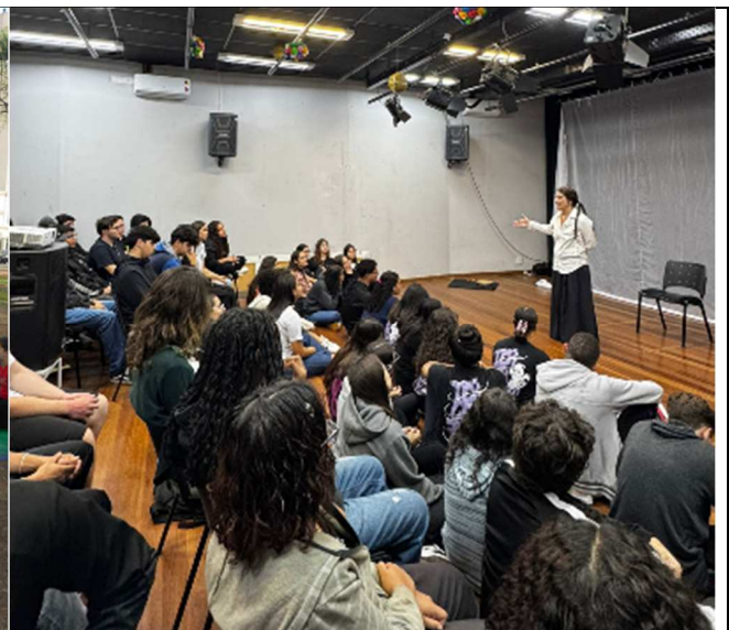
ECOH – Biblioteca do CEU – 28/08/2025