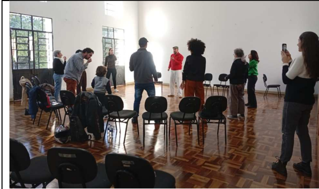
Oficina Palcos Musicais - 30/05/2025