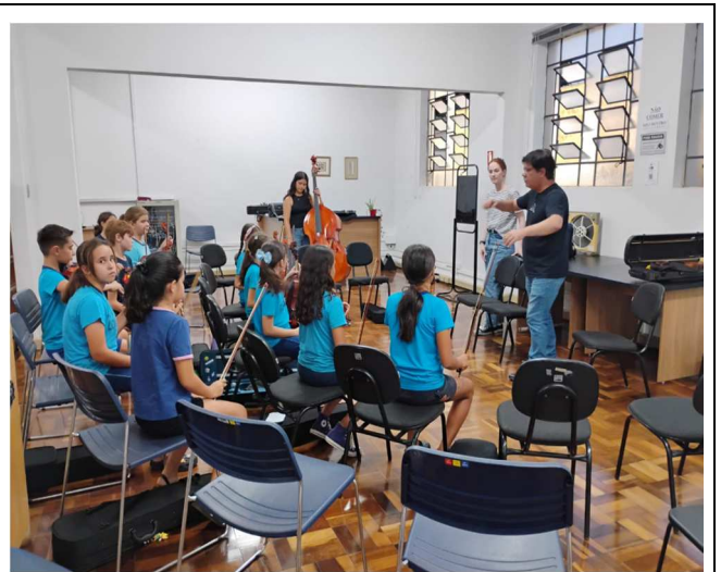
Ensaio Orquestrando o futuro – 17/03/2025