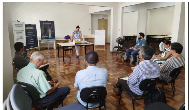
Palestra Projeziologia - 08/03/2025