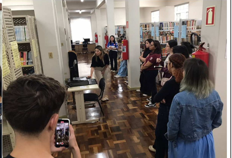
Curso Biblioteconomia UEL - 05-05-2025