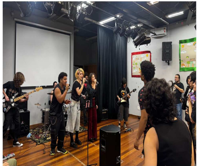
Oficine - Biblioteca do CEU – 14/12/2025