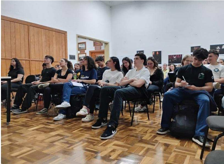
Literatura na Biblioteca – 18/08/2025