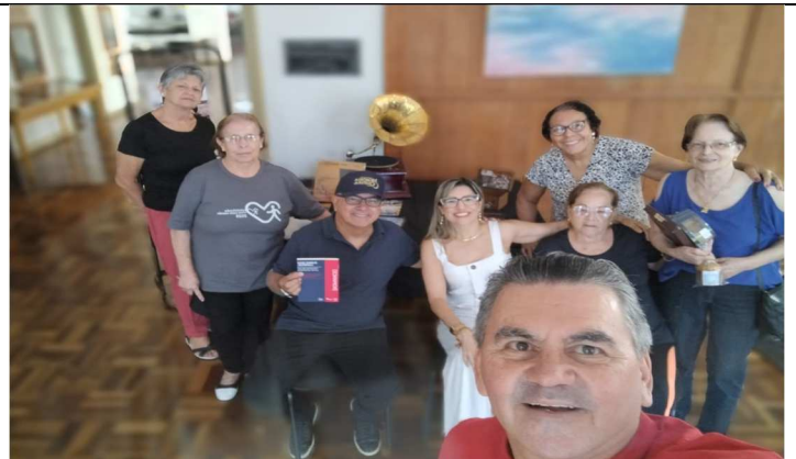
Bem estar no centro histórico – 11/12/2025