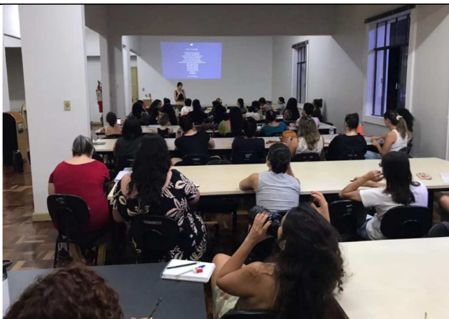
Oficina Escrita e Cura – 10/02/2025