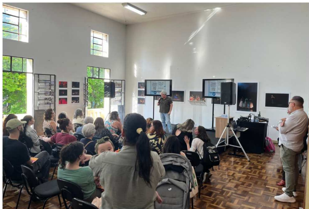
1º Encontro de Escritores, Editores, Gráficas e Livrarias – 29/08/2025