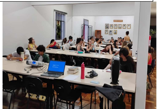
Oficina Escrita e Cura – 12/02/2025