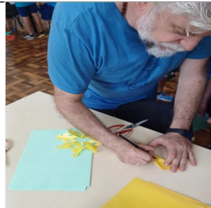
Semana de Nishinomiya – Oficina de Kirigami - 04/11/2025