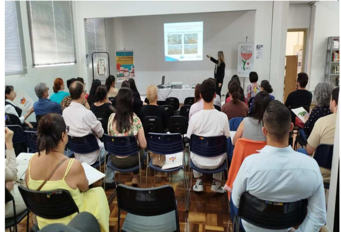
SNLB - Encontro do Sistema Estadual de Bibliotecas – 23/10/202