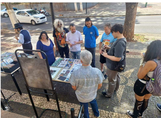
SabadoHQê – 08/02/2025