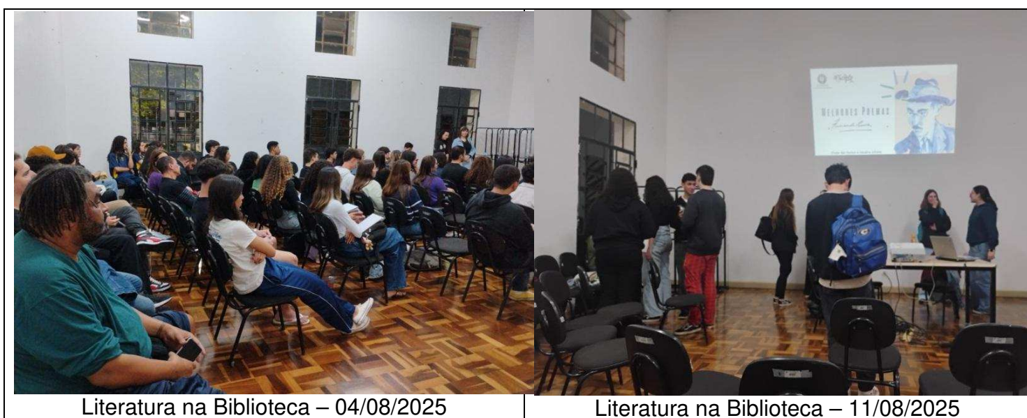
Literatura na Biblioteca – 04/08/2025