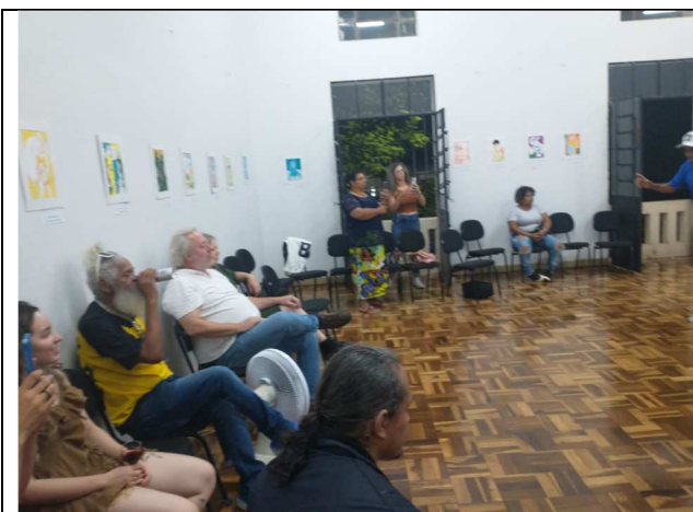
Exposição: Encontro entre amigos - 10/08/2025

Público total atendido nas visitas: 2105