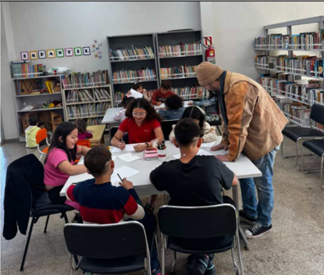
Férias nas bibliotecas – CEU – 07/2025