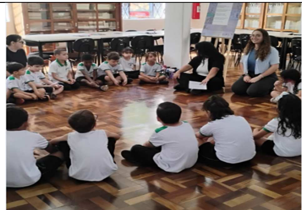
Oficina Abraplip - 04/09/2025