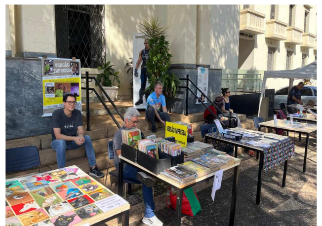
Sabadohqê – 13/09/2025