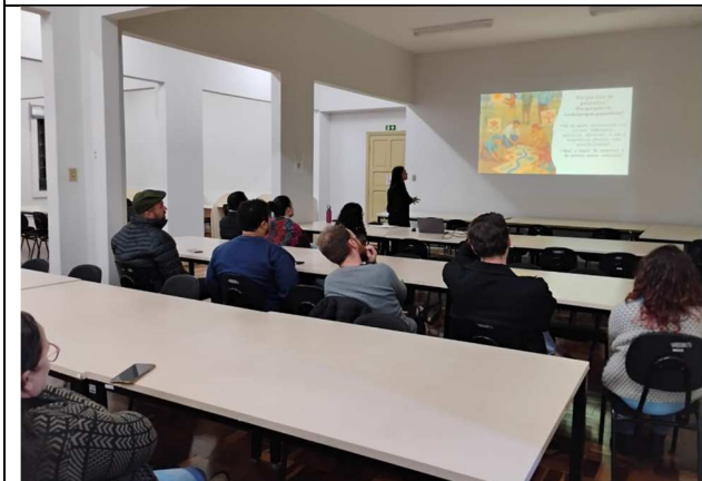
Oficina de criação poética - 24/06/2025