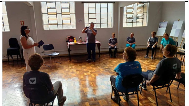
Bem estar no centro histórico – 30/09/2025