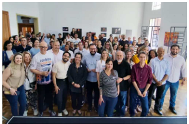
1º Encontro de Escritores, Editores, Gráficas e Livrarias – 29/08/2025