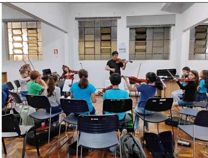
Ensaio Orquestrando o Futuro - 02/06/2025