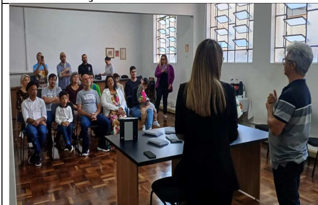
Lançamento de livro - 12/07/2025