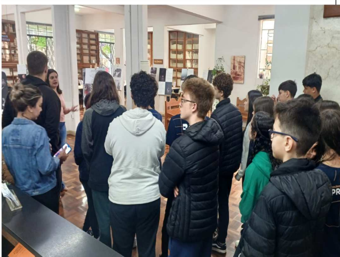
Visita Colegio Premiere 02/09/2025