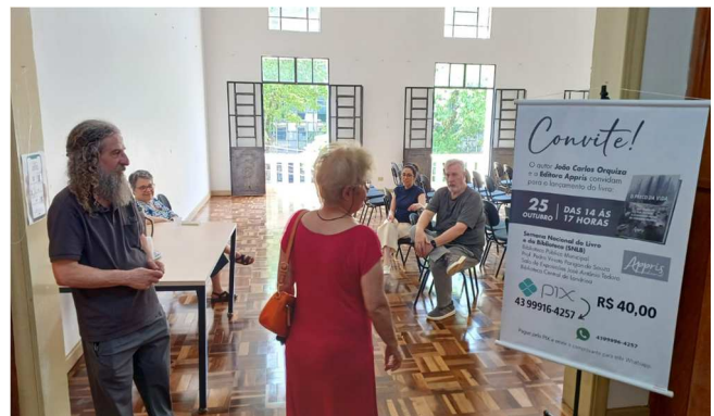
SNLB – Lançamento de livro – 25/10/2025