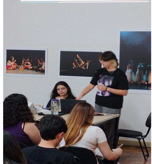
Literatura na Biblioteca – 25/08/2025