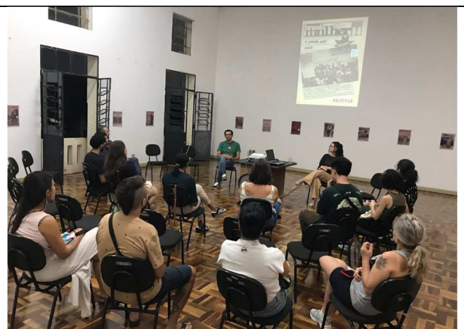
Exposição Páginas de Luta - 10/03/2025