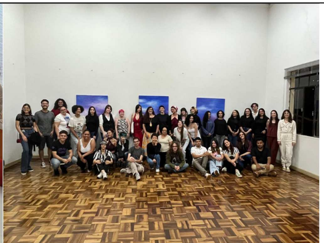
Conhecendo autores e autoras da literatura afro-brasileira - 23/11/2025