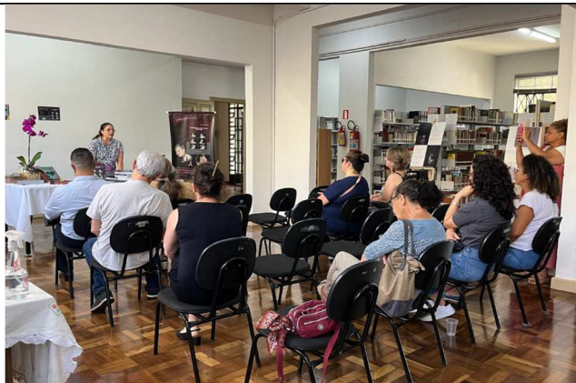
Lançamento do livro: O menino que falava, mas não ouvia - 13/09/2025