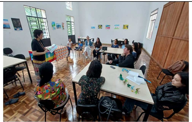
Semana de Nishinomiya – Contação de histórias: “A Lenda do pássaro de Hyoko”,