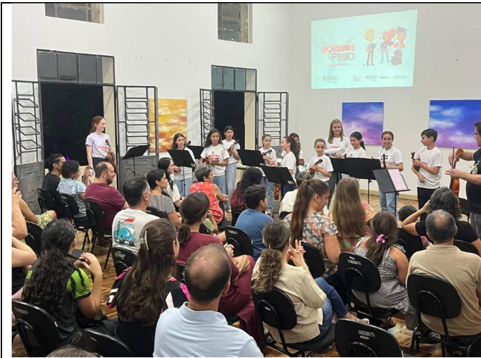
Apresentação Mostra de Música de Câmara e Orquestrando o Futuro – 01/12/2025