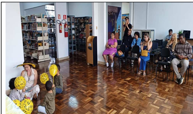
Contação de história - 10/05/2025