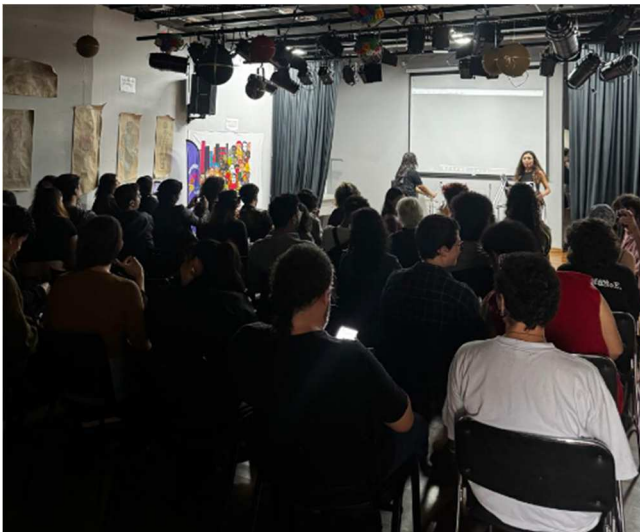
Oficine – Biblioteca do CEU - 14/12/2025