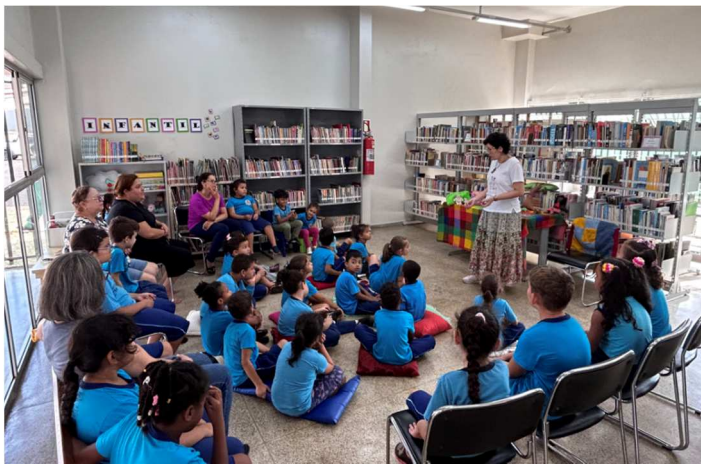
Toda quinta – CEU – 08/05/2025