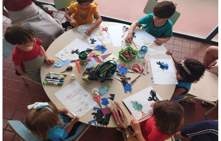
Quartas Criativas – 03/09/2025