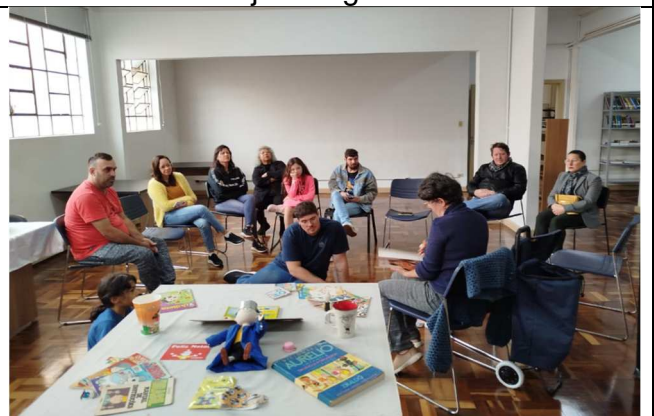
Contação de história - 14/06/2025