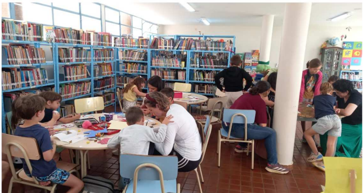
Quartas Criativas – 05/11/2025