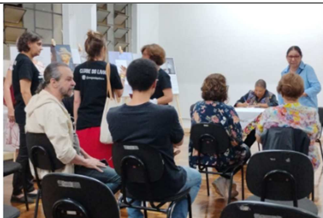
Lançamento do livro: Resgate da nave mãe - 18/08/2025