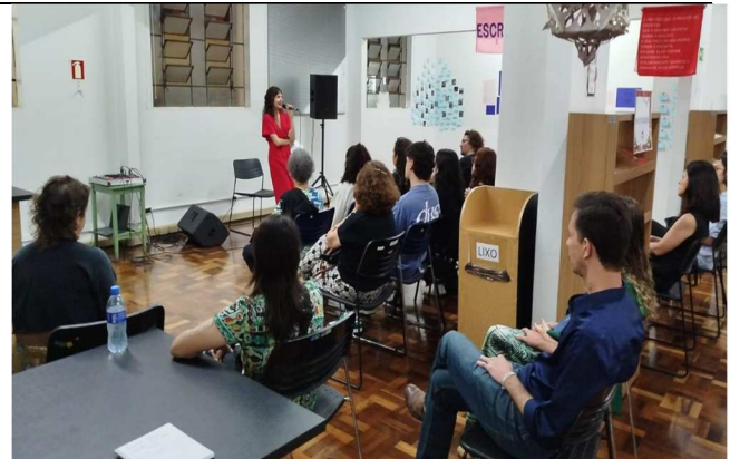
Abertura Exposição Escrita e Cura - 18/12/2025