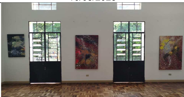
Exposição Rainhas da Guerra - 10/06/2025