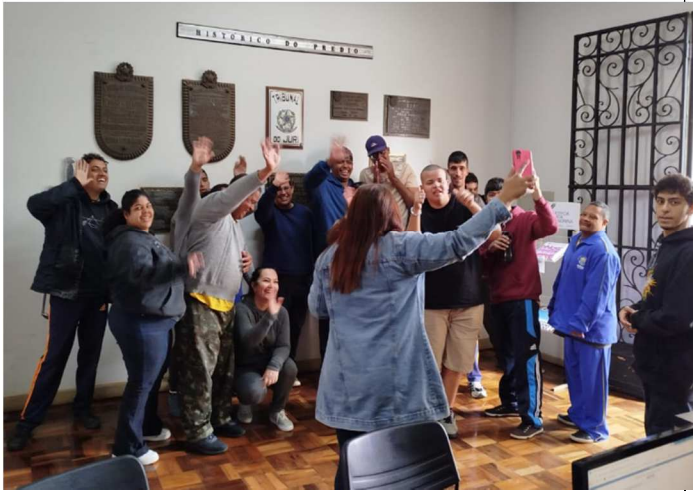
Visita da APAE 02/07/2025