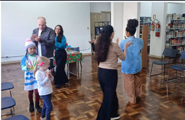
Contação de história - Biblioteca Pedro Viriato Parigot de Souza - 20/08/2025