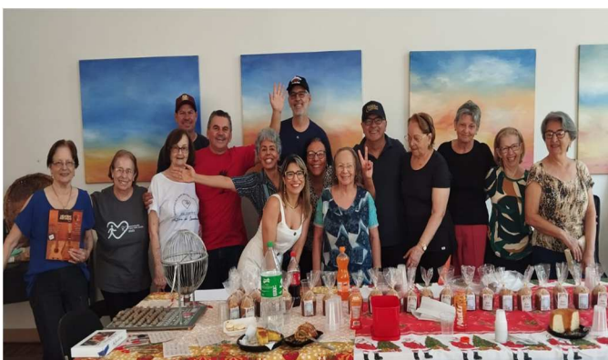
Bem estar no centro histórico – 11/12/2025