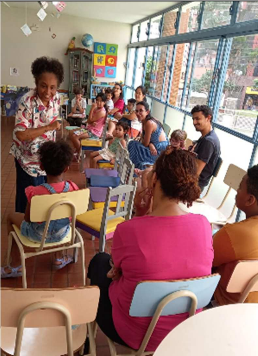
Férias nas Bibliotecas – Biblioteca Infantil – 01/2025