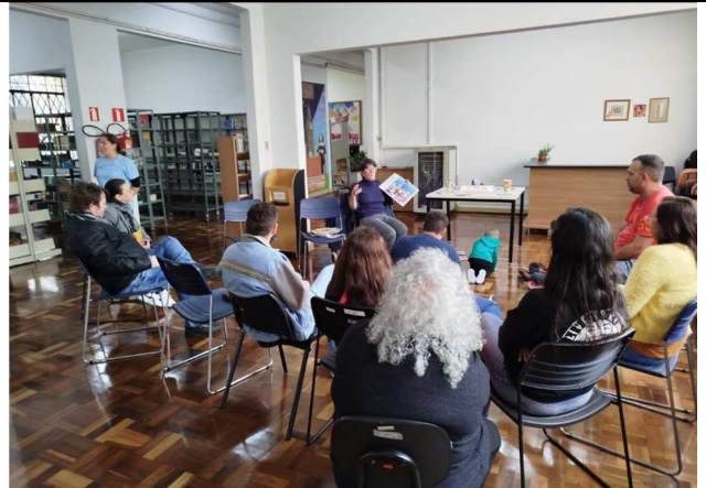
Contação de história - Biblioteca Pedro Viriato Parigot de Souza - 14/06/2025