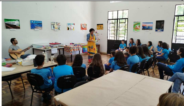
Quartas Criativas – Japão que Inspira – 10/11/2025