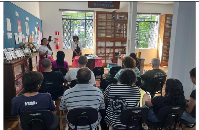
Lançamento do livro: Diário de um psicopata - 13/09/2025