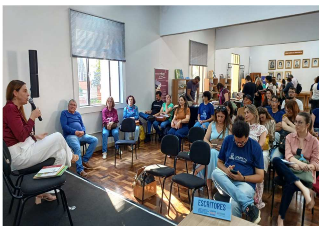
1º Encontro de Escritores, Editores, Gráficas e Livrarias – 29/08/2025