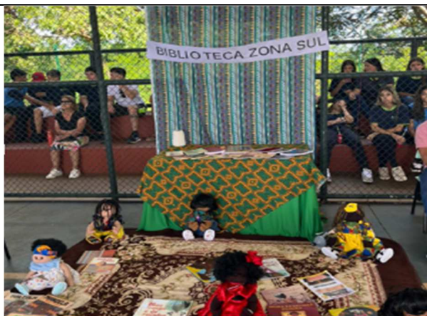
Negritude na Pavilon "sarau da UDV: negritude e periferia a força das raízes afro" - Biblioteca Eugênia Monfrinati - 19/11/2025