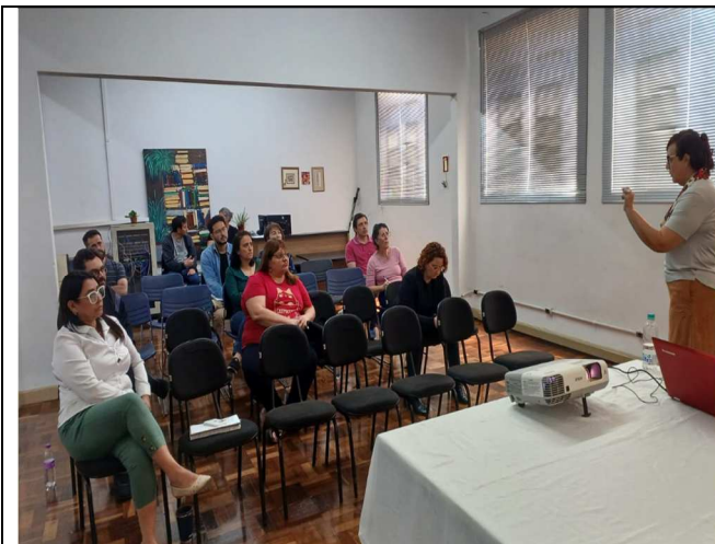
Conhecendo a Literatura Infantil e Juvenil Afro - 18/11/2025