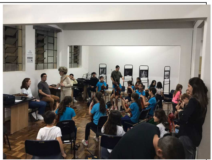
Ensaio Orquestrando o Futuro – 09/05/2025