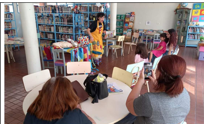
Toda quinta – Biblioteca Infantil – 16/10/2025