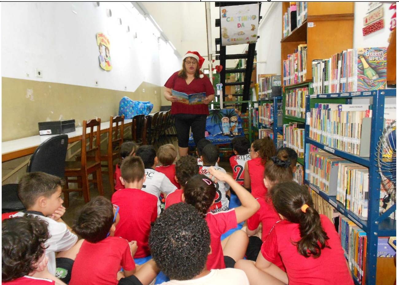
Hora do Conto: Especial de Natal - Biblioteca Adelino de Carli - 02/12/2025