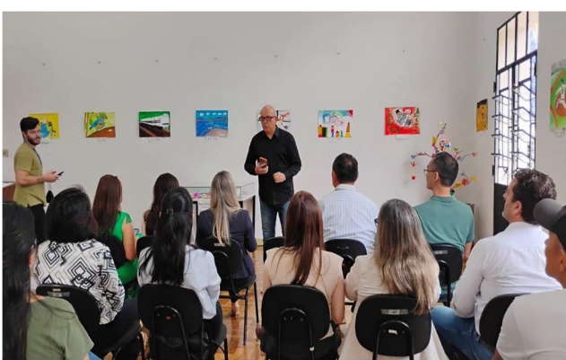
Abertura da Semana de Nishinomiya – 03/11/2025