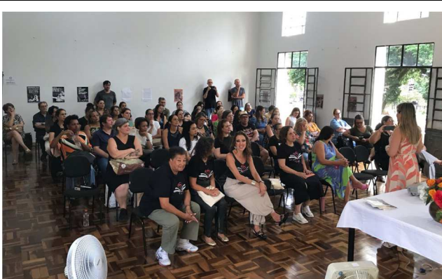
Dia do Bibliotecário – 12/03/2025