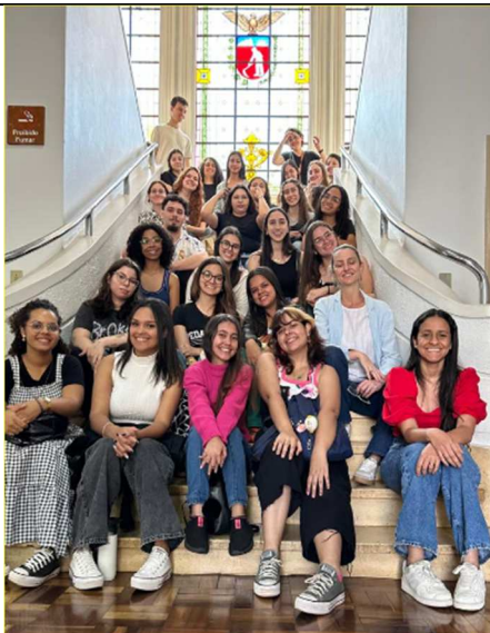
Visita mediada – Pedagogia UEL – 15/09/2025