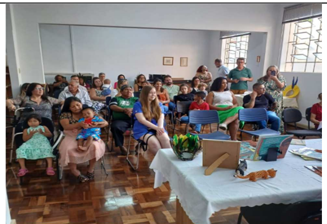
Lançamento do livro: Kuiã Enarê 12/04/2025