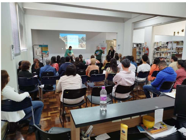
Abertura da SNLB - Encontro do Sistema Estadual de Bibliotecas – 23/10/2025