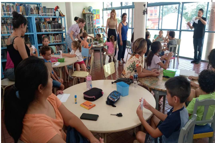
Férias nas Bibliotecas – Biblioteca Infantil – 01/2025