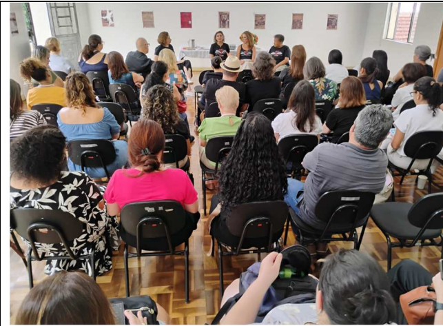
Dia do Bibliotecário – 12/03/2025