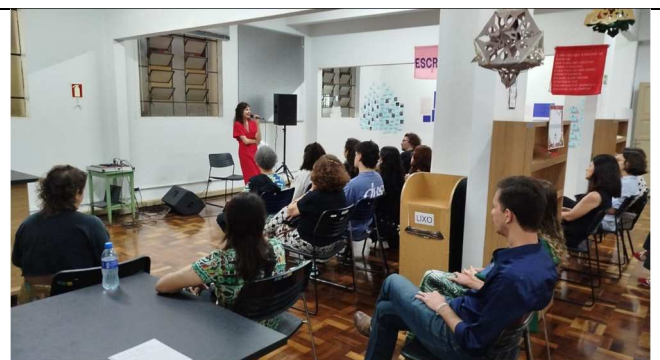
Exposição Arte e Cura - 18/12/2025