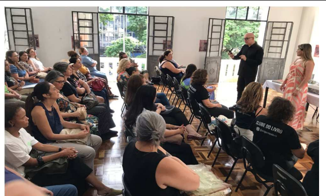
Dia do Bibliotecário – 12/03/2025