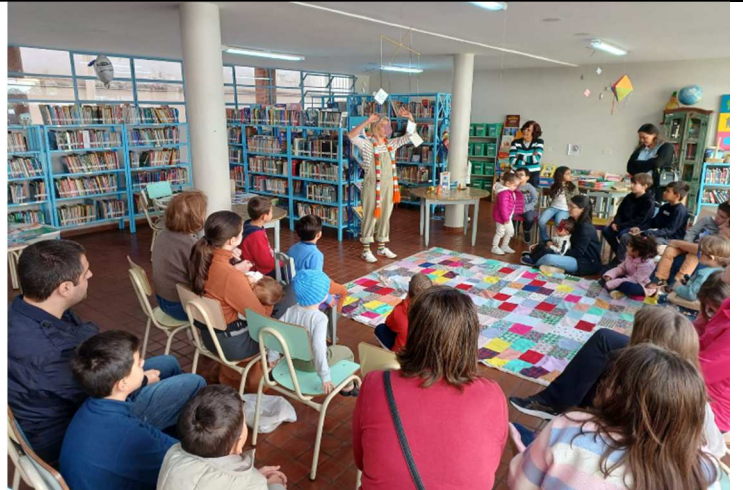
Férias nas Bibliotecas – Biblioteca Infantil 11/07/2025