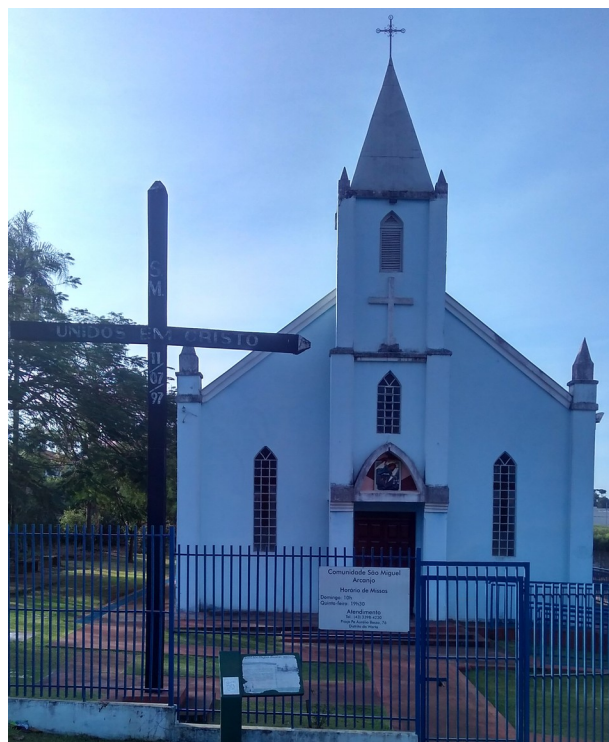
Vista da capela, 2018