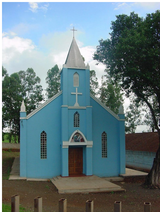
Vista frontal, 2003.