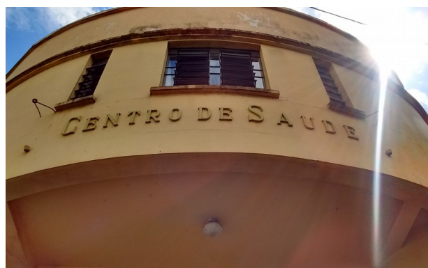
Fachada principal, 2018