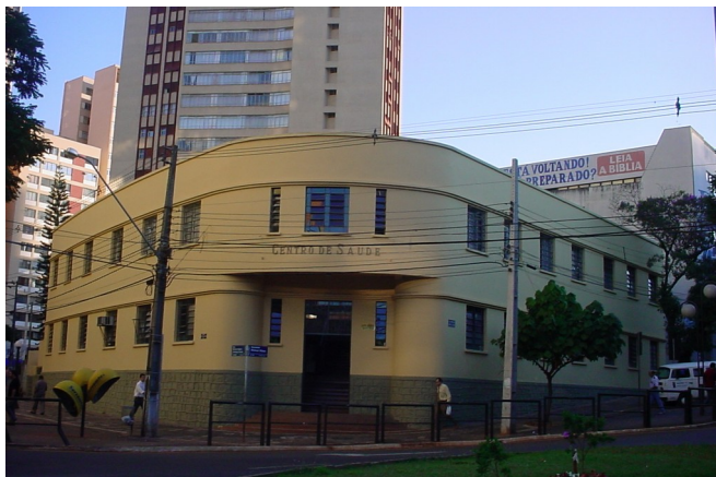
Fachada do Centro de Saúde após a reforma. Fonte: Carla Caires - 05/07/2007 Diretoria de Patrimônio Histórico-Cultural sobre base IPPUL, 1991