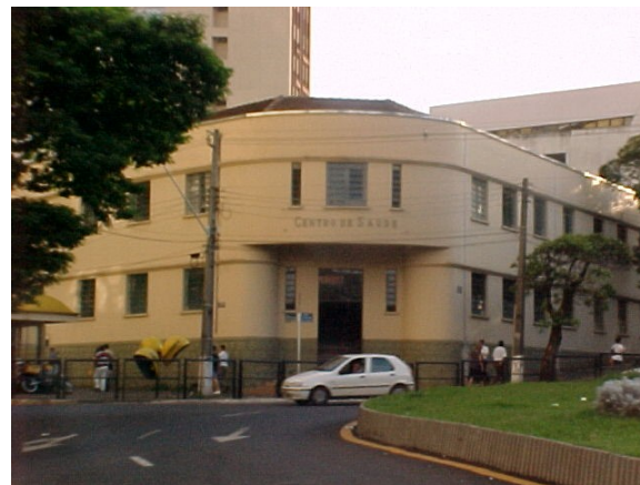
Vista externa, 2001