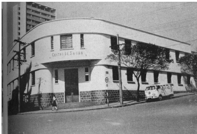
Vista externa, década de 1970.