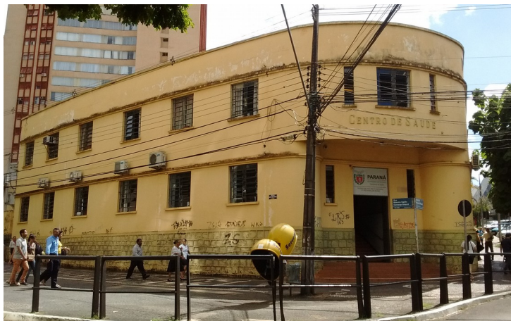
Vista externa, 2018

Fonte: Diretoria de Patrimônio Histórico-Cultural PML