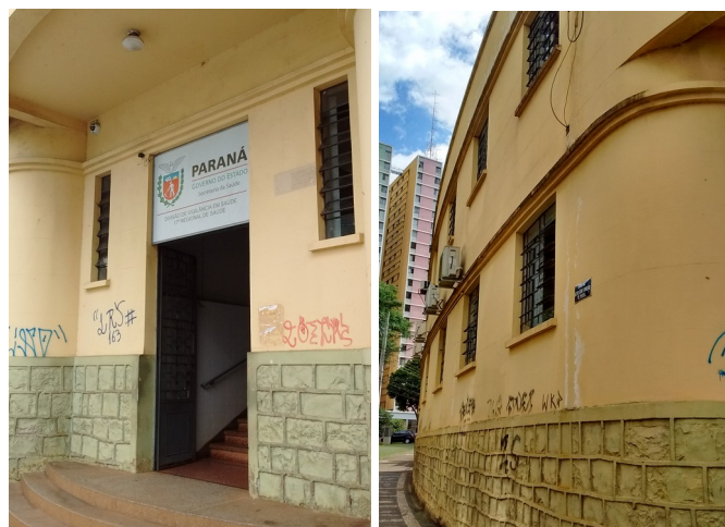
Entrada principal, 2018