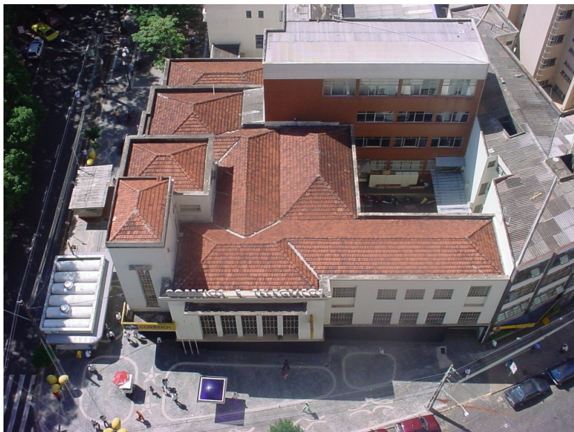
Cobertura da agência, 2004.