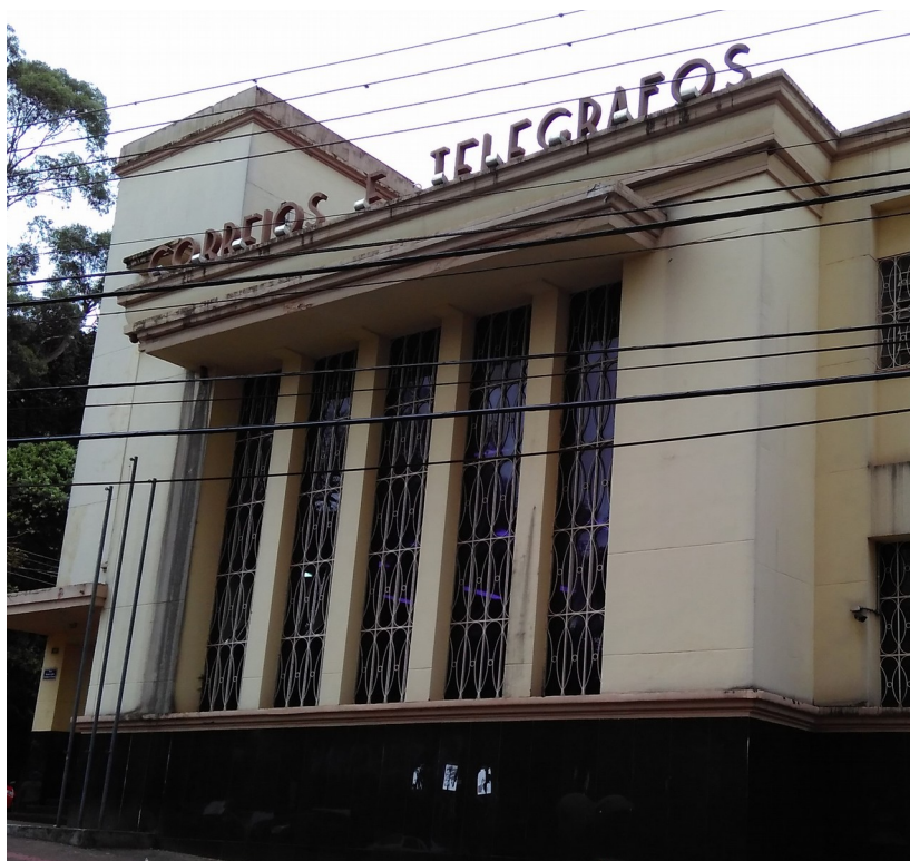
Fachada principal, 2018.