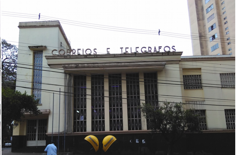
Vista externa, 2018