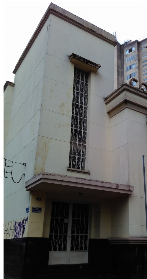
Detalhe esquadrias, 2018.