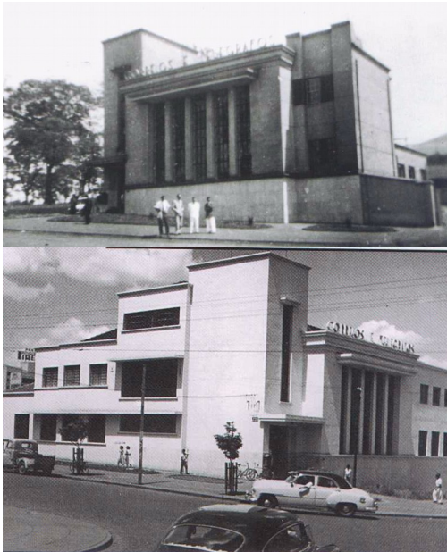
Acima, agência recém construída (1949) Abaixo, década de 1960.