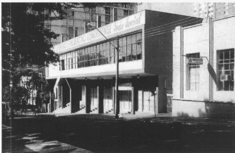
Vista externa, sem data