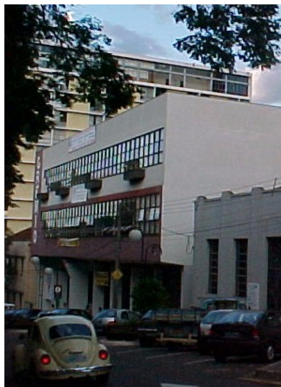
Vista externa, 2004