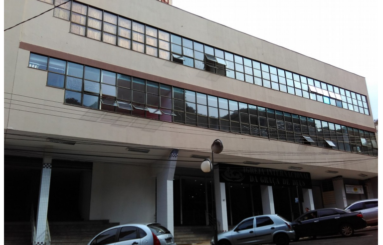
Vista recente, 2018