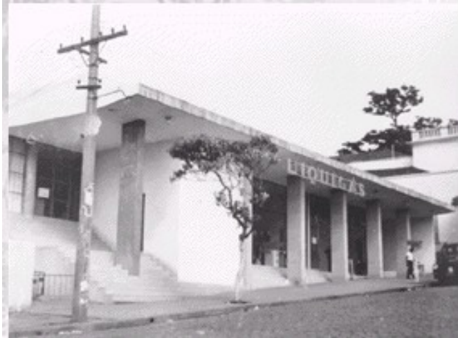
Vista externa década de 1950