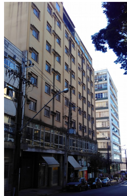
Sahão Palace Hotel em 2018