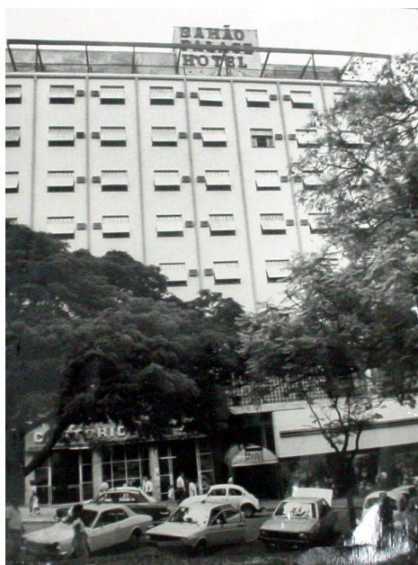
Sahão Palace Hotel