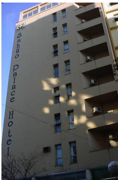
Sahão Palace Hotel em 2004