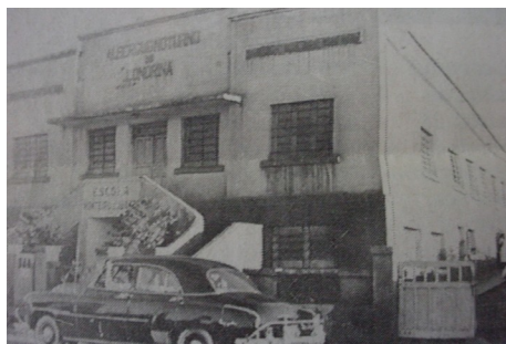
Albergue Noturno - década de 50.