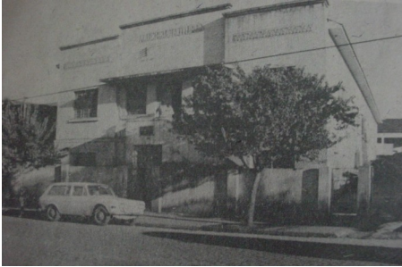
Albergue Noturno - década de 70.