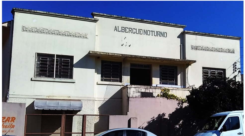
Albergue Noturno, 2018.