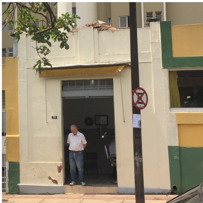
Fachada, 2016.