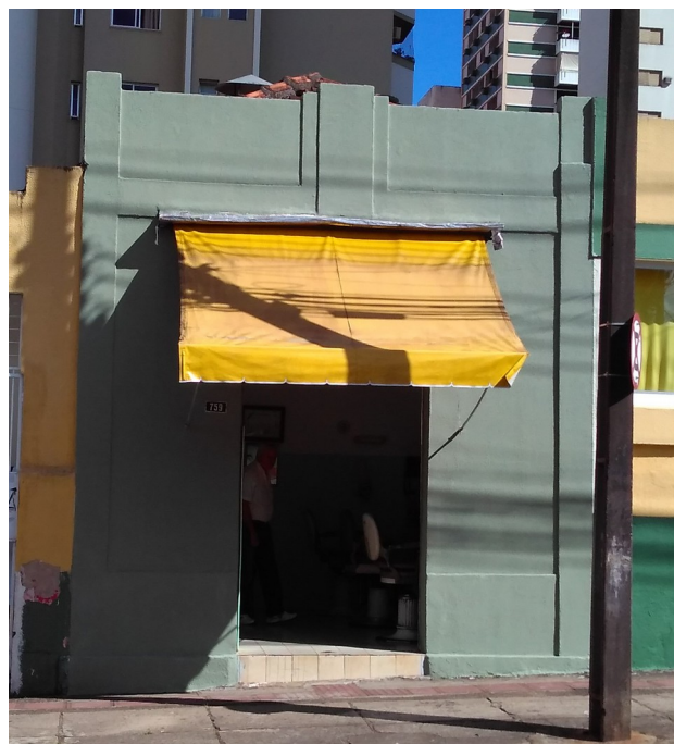
Fachada, 2018.