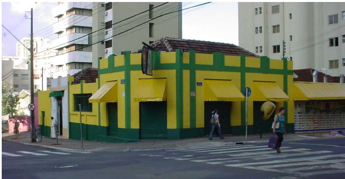
Bar Brasil - Fachada, esquina das ruas Hugo Cabral e Piauí. Fonte: Diretoria de Patrimônio Histórico-Cultural PML, 2005.