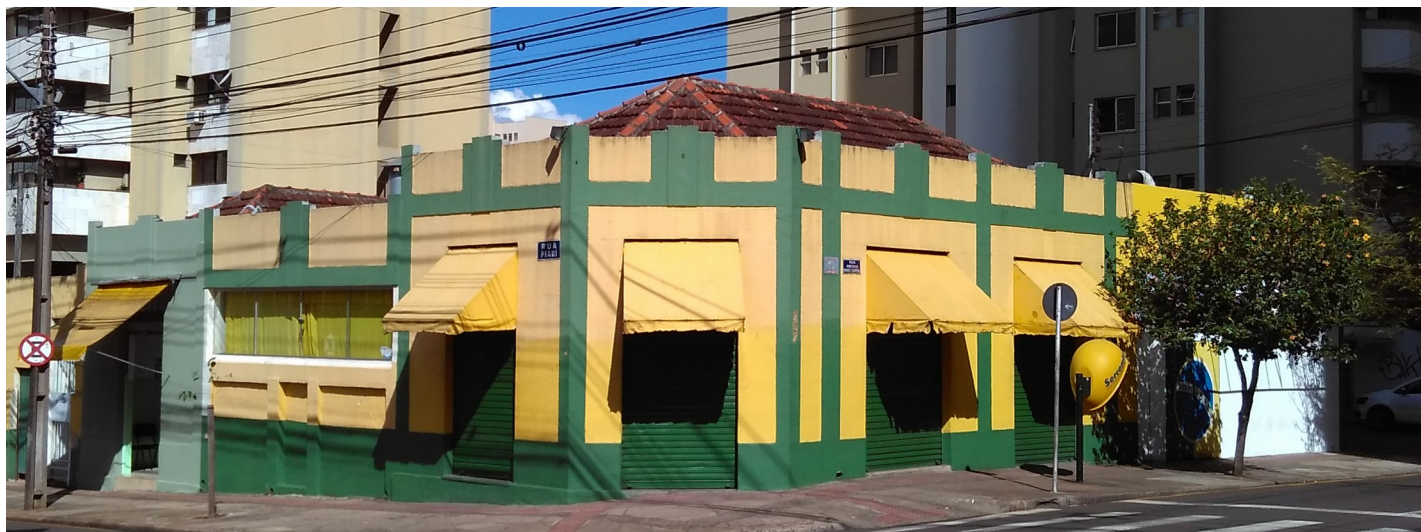
Bar Brasil - Fachada, esquina das ruas Hugo Cabral e Piauí.