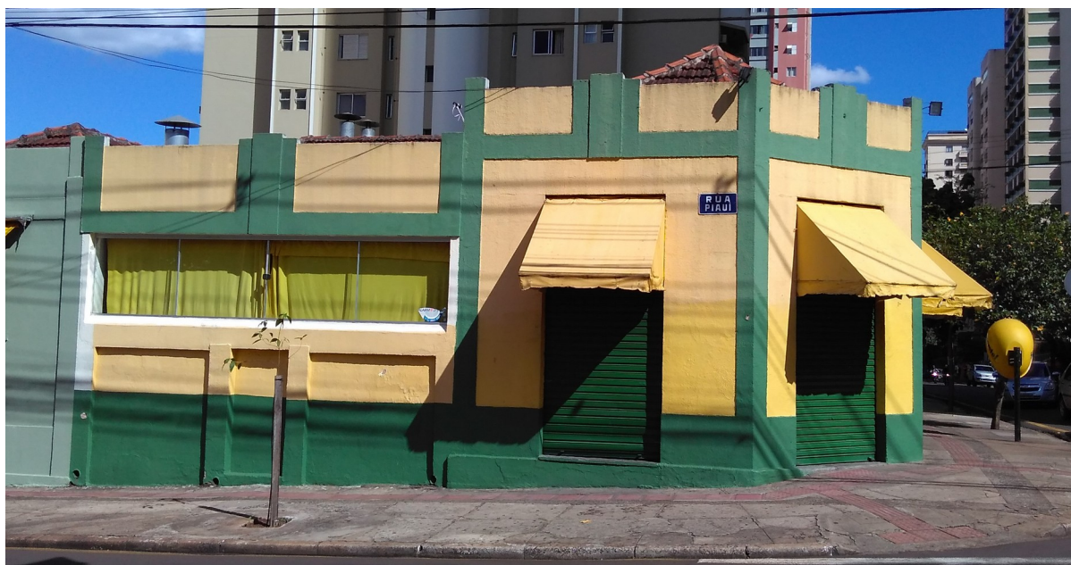
Bar Brasil - Fachada, esquina da Rua Piauí.