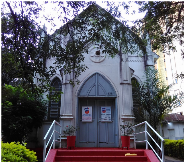
Vista Geral Par. São Lucas, 2018.