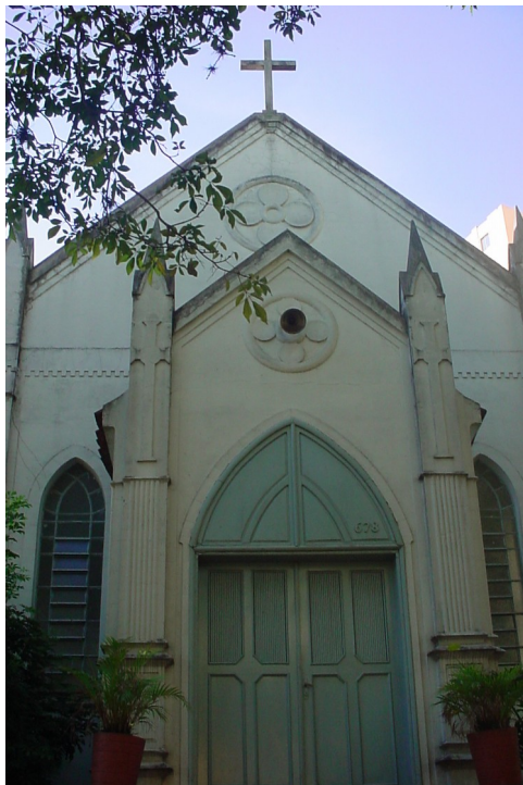
Vista Frontal, 2006

Fonte: Diretoria de Patrimônio Histórico.