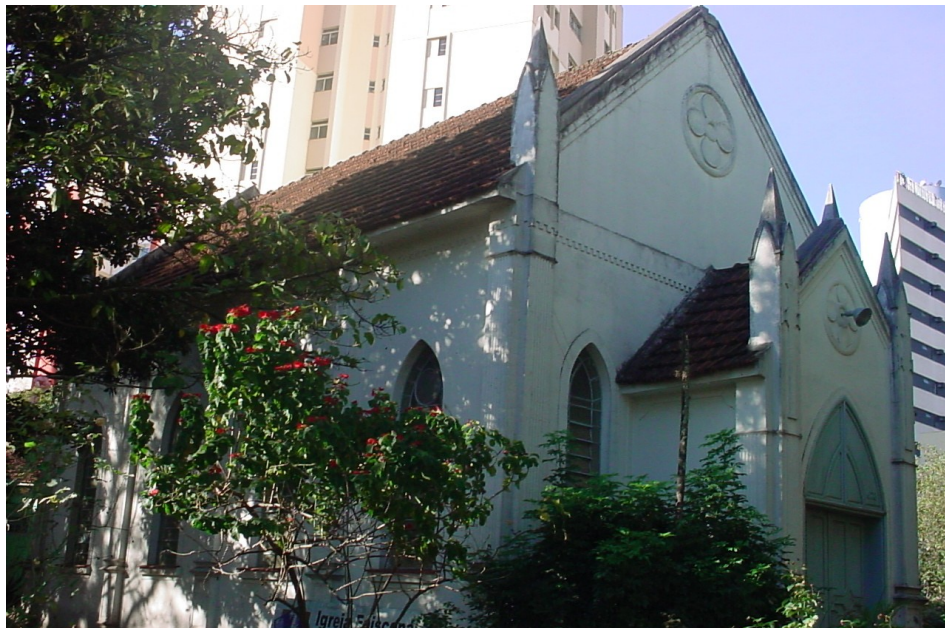
Vista Geral Par. São Lucas, 2006