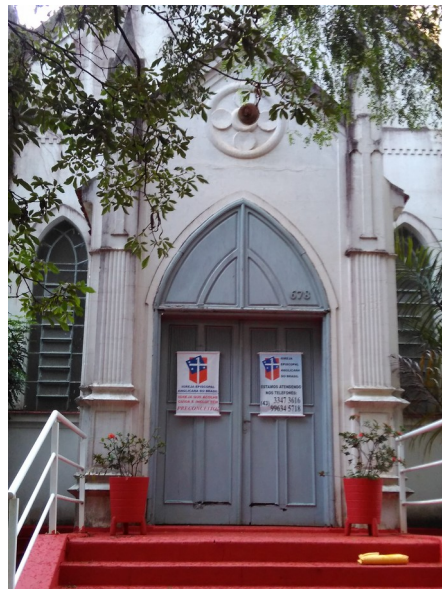
Vista Geral Par. São Lucas, 2018.