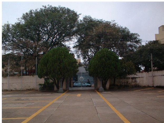
Vista do portão de entrada na Rua Mossoró, 2004.