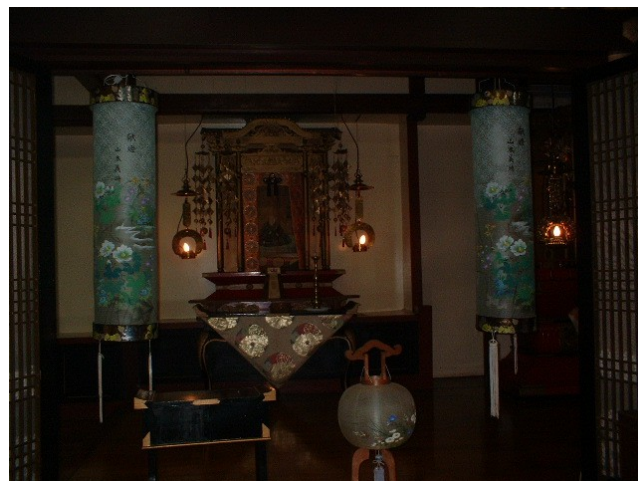
Vista do “altar” no interior do Templo, 2004.