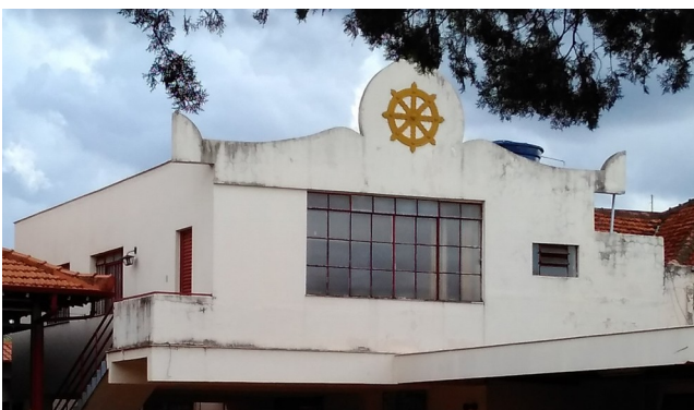
Detalhe Fachada