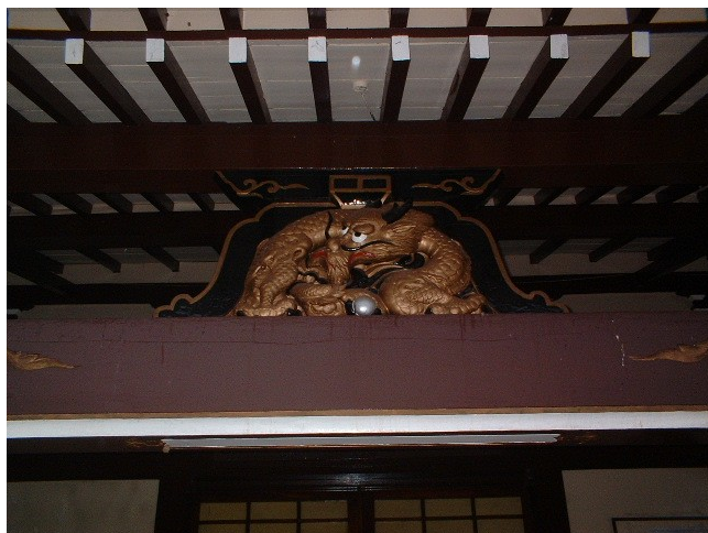
Detalhe do ornamento na entrada principal, 2004.