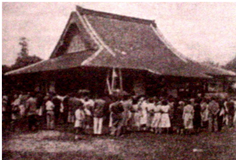
Foto antiga do Templo Budista