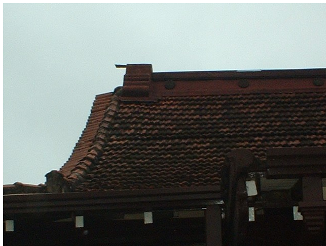
Detalhe da “telha da crista” (Onigawara), 2004.