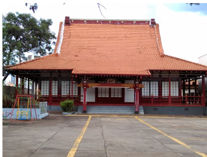
Vista frontal do Templo pelo estacionamento