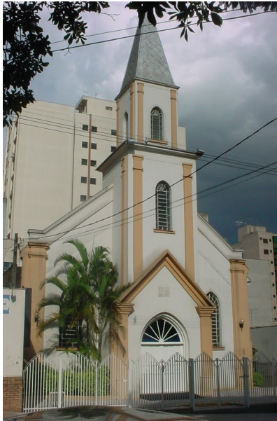
Vista frontal da Igreja