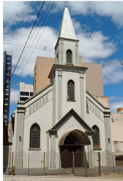
Vista frontal da Igreja