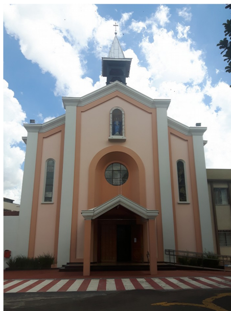
Vista recente da edificação, 2017.