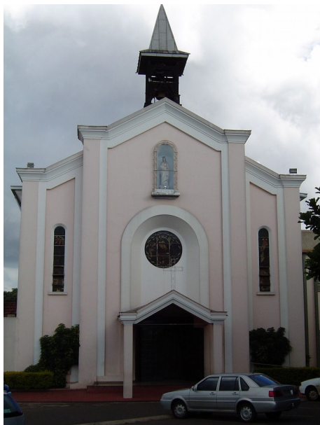
Fachada principal, 2004