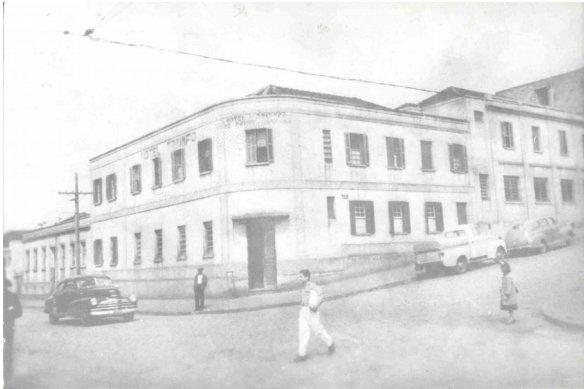
Hotel Triunfo, sem data.