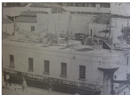
Hotel Triunfo: demolição em Janeiro de 1995.