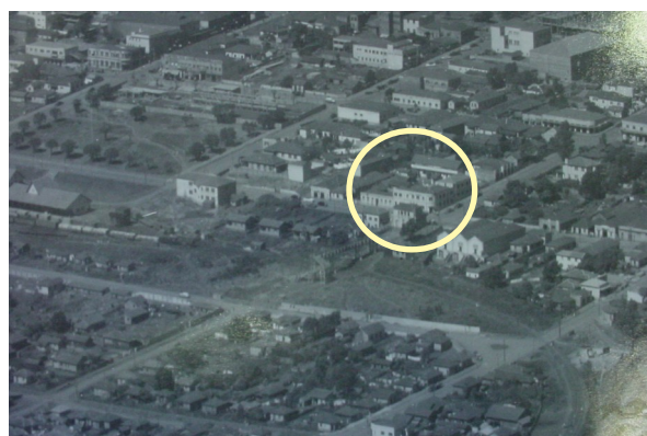
Foto aérea, com destaque no Hotel Triunfo. 1970

Fonte: Museu Histórico "Pe. Carlos Weiss"