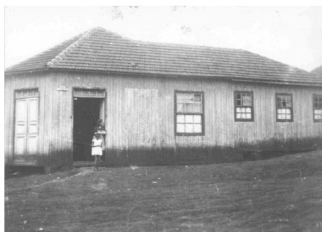
Pensão Triunfo: edificação em madeira.