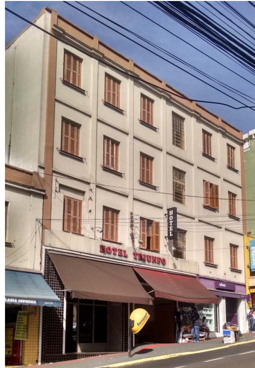
Hotel Triunfo, 2018.