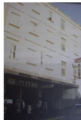
Edificação ainda existente da demolição.