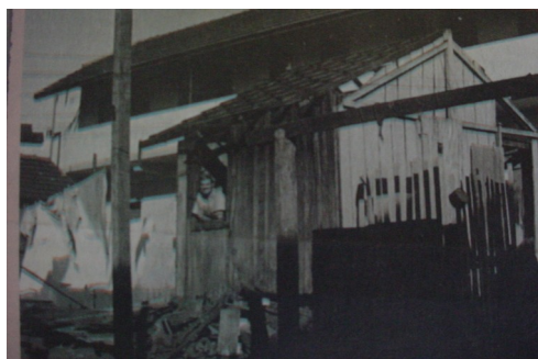
Pensão Triunfo: construção em madeira em 1934.