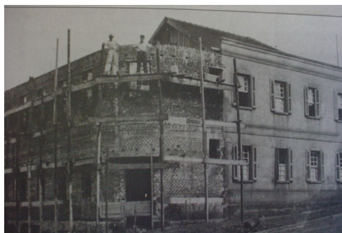
Construção do Hotel Triunfo na esquina da Rua Benjamin Constant, por volta de 1942.