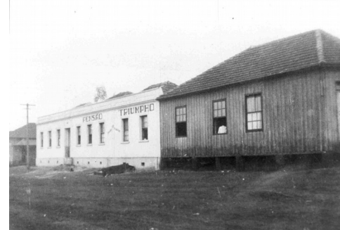
Pensão Triunfo: edificação em alvenaria de 1939.