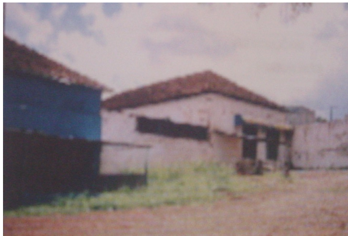
Detalhe do frontão com inscrições antigas, identificando a antiga serraria.