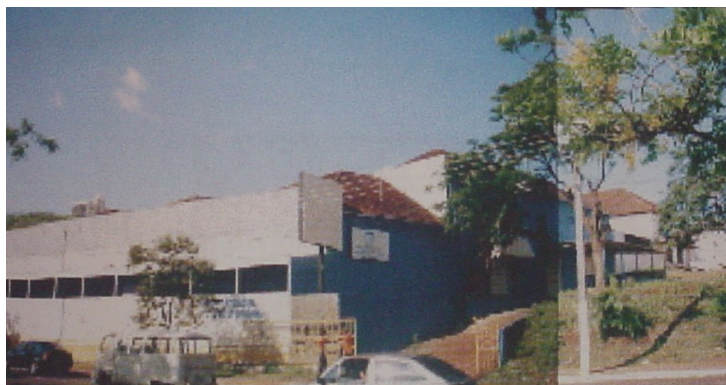
Fachada principal da antiga indústria Trabalho final da graduação da Arquiteta Ilzangela Keila de Almeida, 2003.