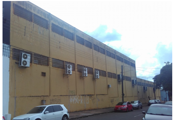
Fachada atualmente.