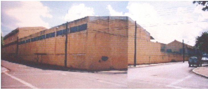
Fachada principal do antigo armazém. Fonte: Trabalho Final de Graduação da Arquiteta Ilzângela Keila de Almeida, 2003.