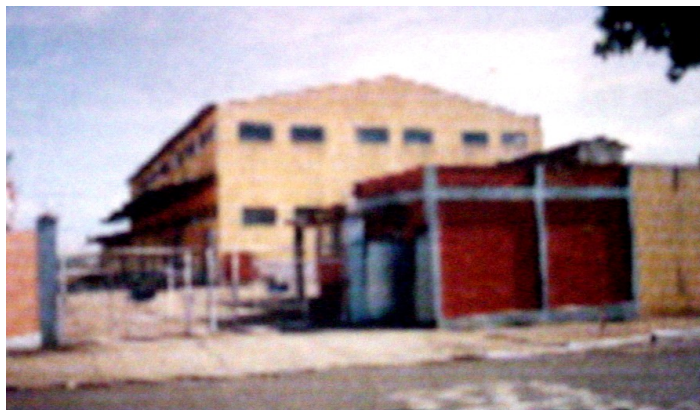
Vista barracões de 2 pavimentos.