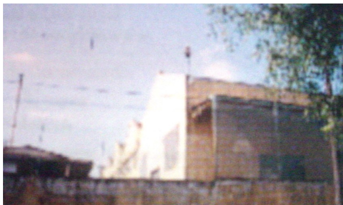
Vista dos primeiros barracões construídos do conjunto.