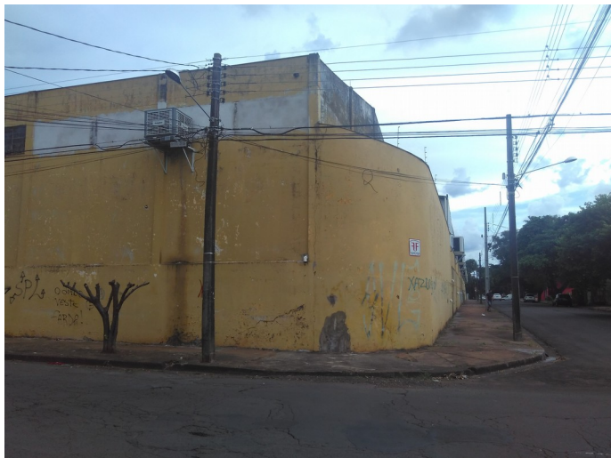
Vista da esquina do armazém, 2018.