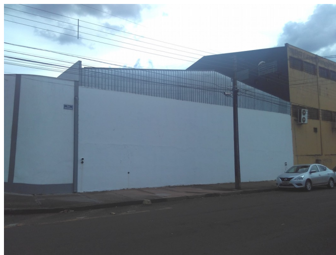
Lateral do armazém, 2018.