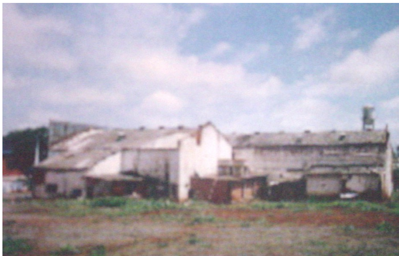
Vista dos fundos.