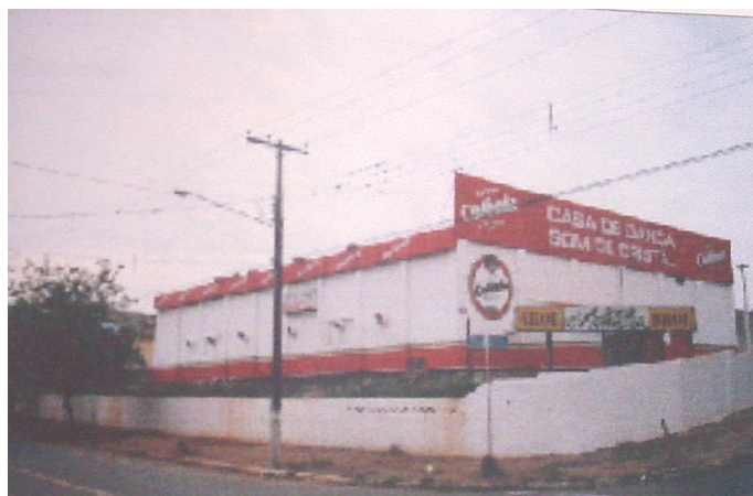
Fachada principal da Casa de Dança.