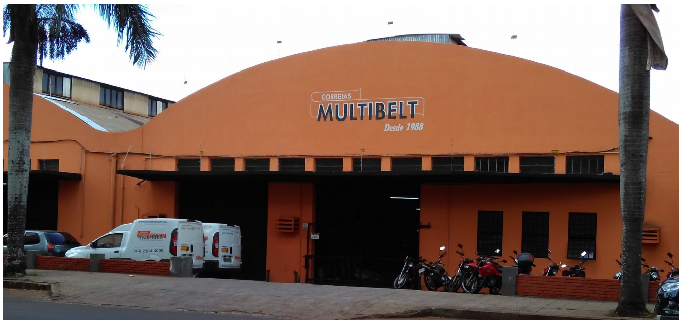
Vista entrada principal, 2018.