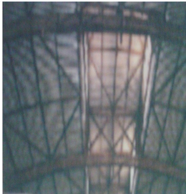
Estrutura da cobertura em arcos laminados de madeira, 2003.