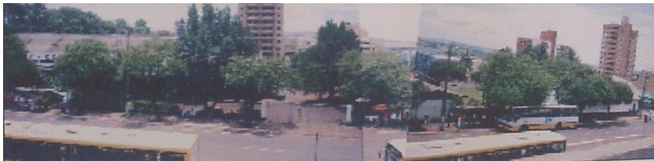
Vista geral do armazém.