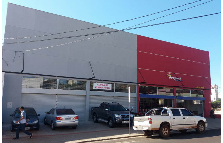
Vista geral do armazém.