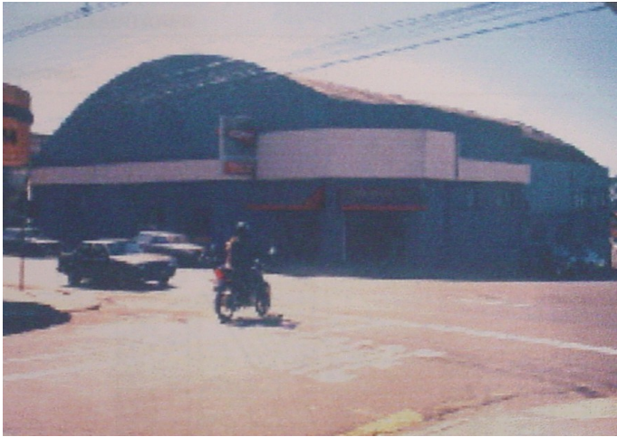
Vista geral do armazém.