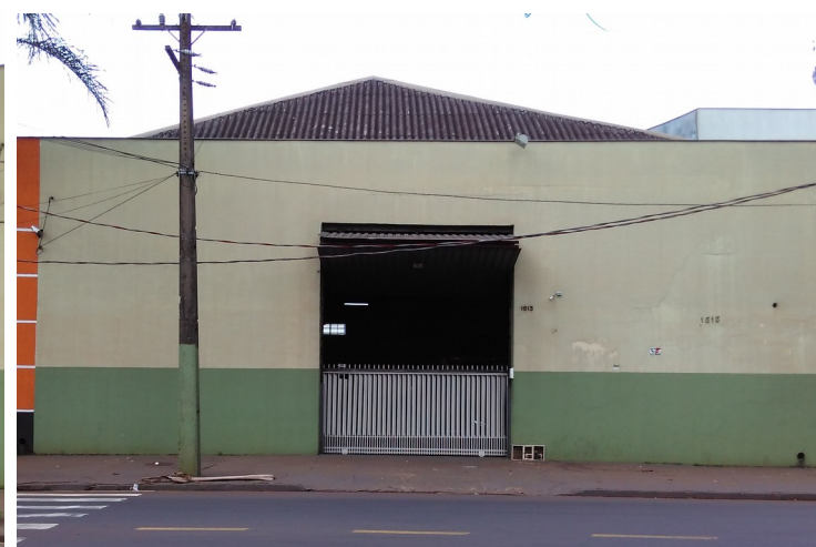
Vista do armazém 4.