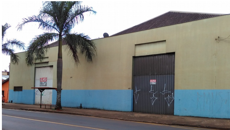
Vista dos armazéns 1 e 2.