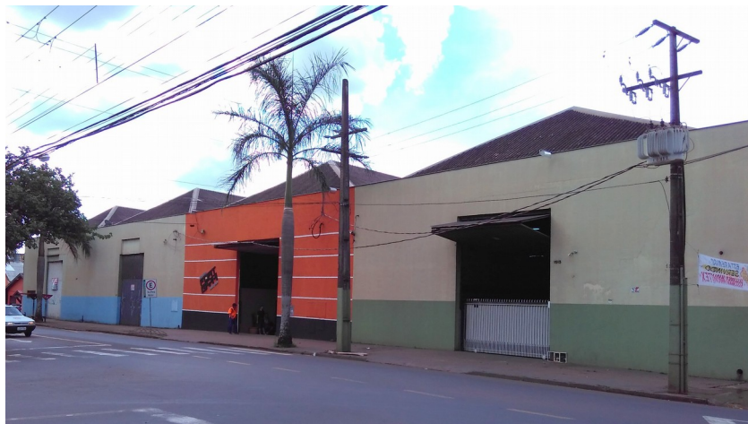
Vista dos barracões