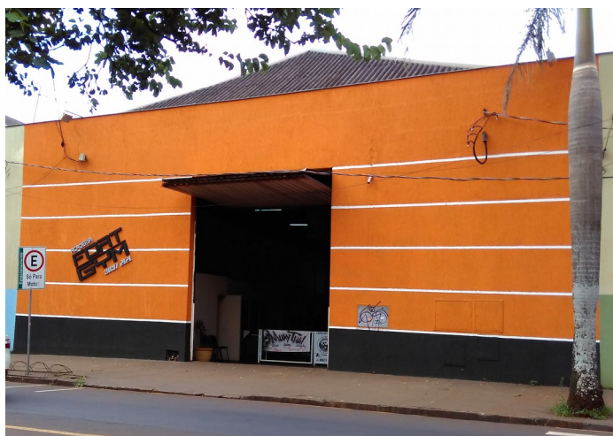
Vista do armazém 3.

Fonte: Diretoria de Patrimônio Histórico, 2018.