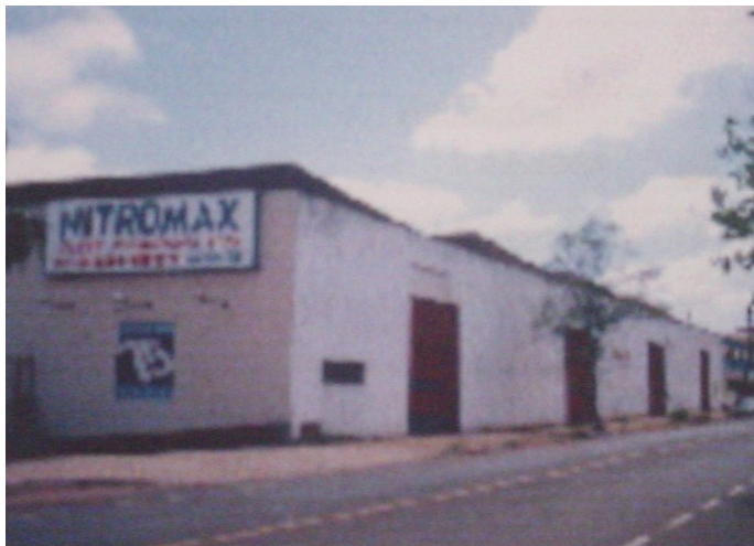
Vista geral do armazém.