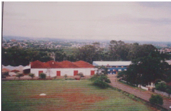
Vista geral do armazém.