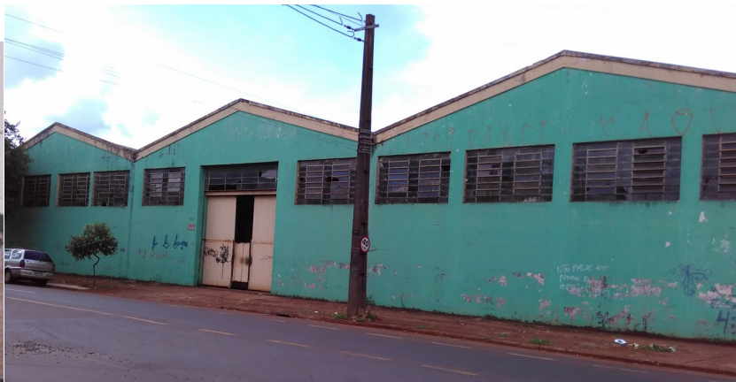
Vista geral do armazém.