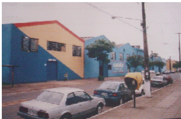
Vista geral do armazém.