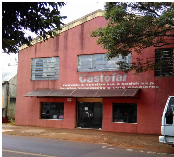
Vista do armazém 3.