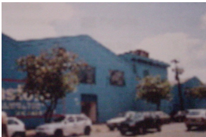
Detalhe barracão e cabine de alta tensão ao lado, 2003.