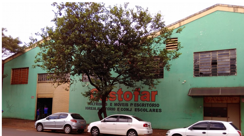
Vista do armazém 2.