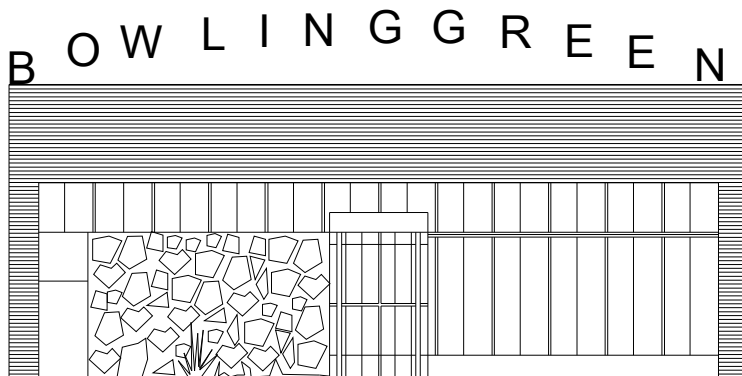
Elevação frontal cf. projeto original