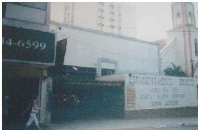
Vista geral do barracão.