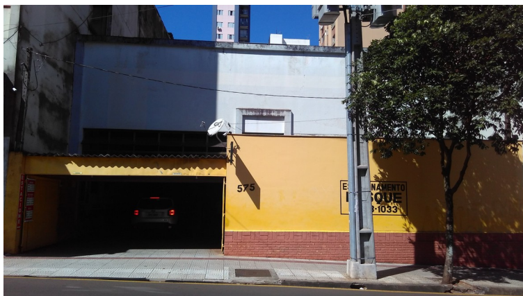
Vista geral do barracão.